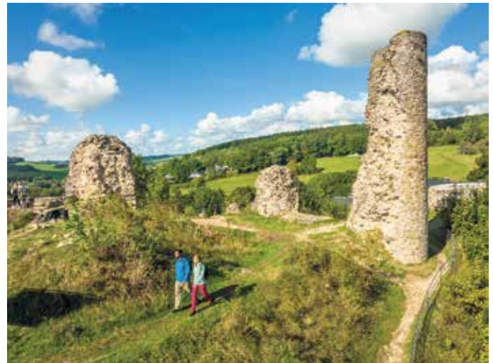
An der Burgruine Kronenburg sind in den nächsten Jahren umfangreiche Sanierungsarbeiten erforderlich.

Die Burgruine von Kronenburg oberhalb des historischen Burgberings ist mit dem herausragenden Rundumblick ein wichtiges touristisches Angebot und Ziel für die vielen Gäste in Kronenburg und der Gemeinde.