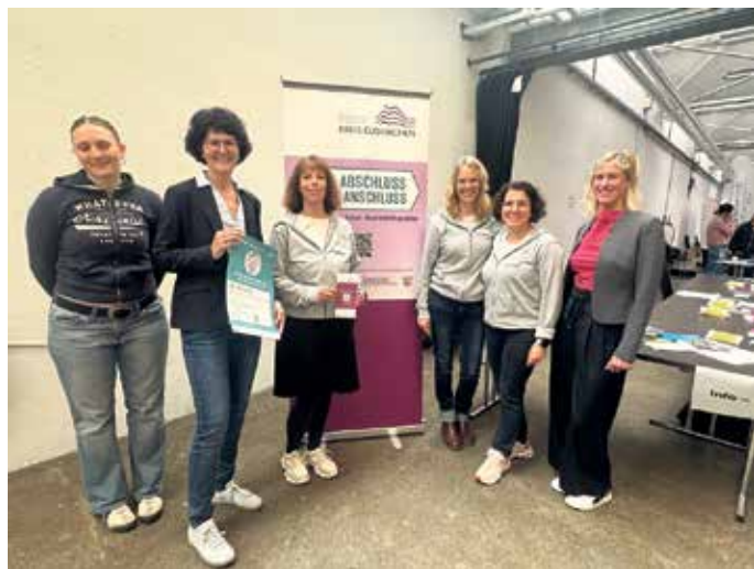
Das Orga-Team der Kreisverwaltung freut sich über das große Interesse (Kommunale Koordinierungsstelle Übergang Schule-Beruf, KoBIZ)