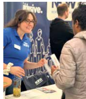
Schüler der Nikolausschule informiert sich bei der NE.W über Ausbildungsmöglichkeiten

Organisiert wurde die Messe von der Agentur für Arbeit Brühl, dem Landschaftsverband Rheinland, der Fachberaterin für KAoA-STAR sowie der Kommunalen Koordinierungsstelle Übergang Schule-Beruf im KoBIZ des Kreises Euskirchen. Neuer Kooperationspartner in diesem Jahr ist die IHK Aachen.