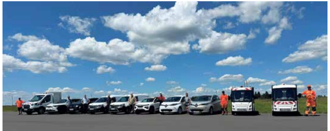
Die Mitarbeiter der Gemeindeverwaltung mit ihren E-Fahrzeugen.

Die erforderliche Nutzung der Fahrzeuge passt gut zur E-Mobilität mit täglichen Kurzfahrstrecken bis 100km am Tag