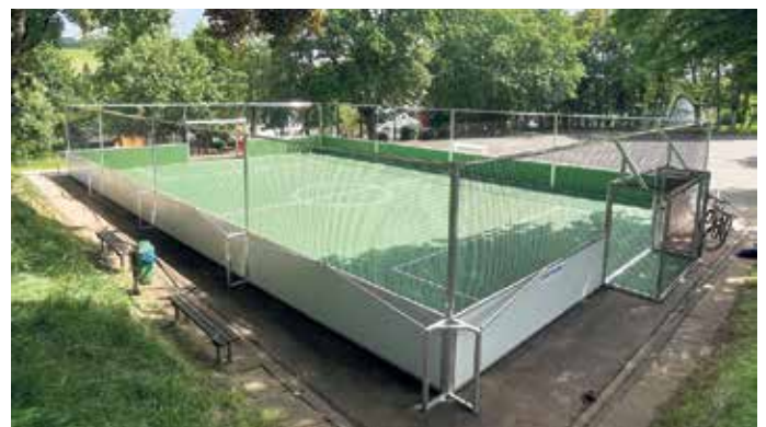
Der neue Soccer Court an der Grundschule in Dahlem

Die neue Anlage hat eine Größe von 20m x 13m, die Gesamtkosten von 56.000€ werden zu 85% gefördert durch das Land NRW.