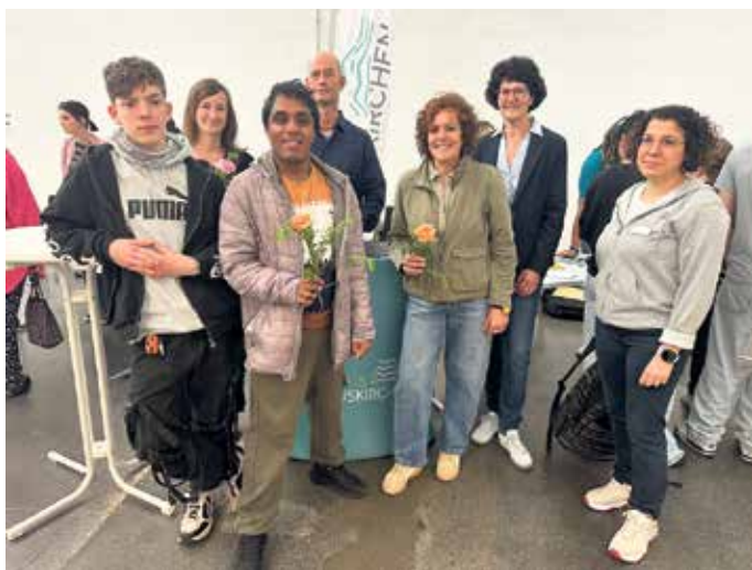
Schüler und Lehrer der Nikolausschule in Kall am Stand der Kreisverwaltung