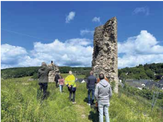
Zur Abstimmung der Sanierungsarbeiten trafen sich die Beteiligten Behörden vor Ort auf der Burgruine.