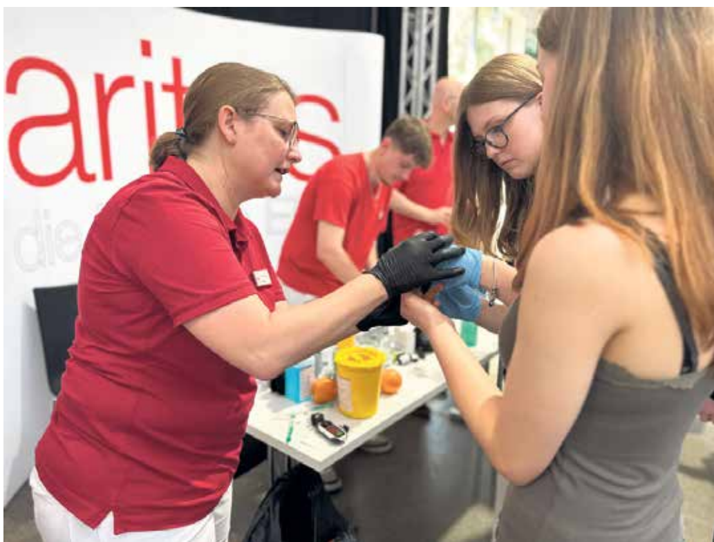
Schülerinnen der Gesamtschule Weilerswist am Stand der Caritas.

Auch für Berufsrückkehrerinnen und Berufsrückkehrer sowie Quereinsteigerinnen und Quereinsteiger eröffnen sich gute Perspektiven, da