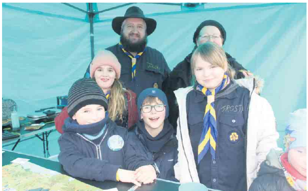
Die Bad Driburger Pfadfinder tragen mit Waldmeisterwaffeln zum Frühlingserwachen bei.