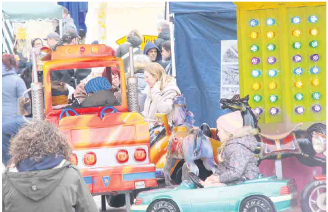
Natürlich darf beim verkaufsoffenen Sonntag in Bad Driburg auch ein Kinderkarussell nicht fehlen.