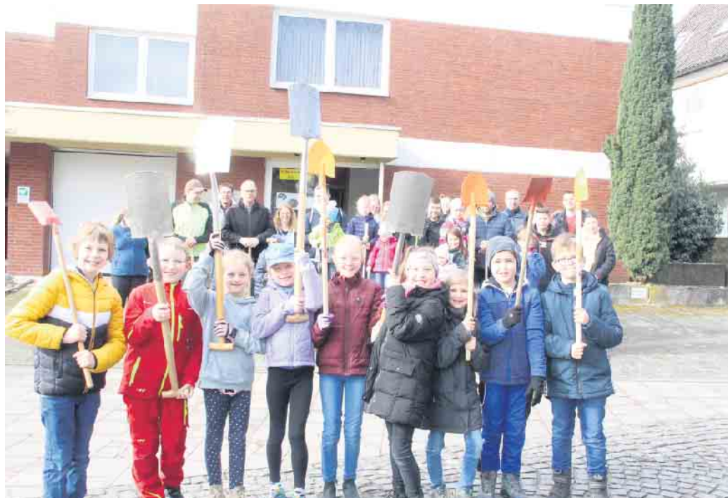
Mit viel Eifer machen sich die Helfer an die Pflanzaktion.