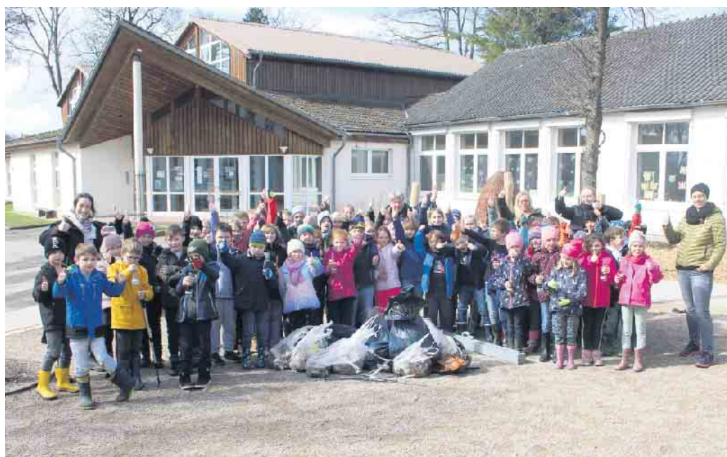
Umwelttag mit der Grundschule St. Walburga in Neunheerse

nehmer den Umwelttag nach getaner Arbeit bei guten Gesprächen ausklingen.