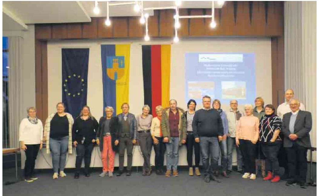
Vorstand und Mitglieder des Fördervereins.

Das vorrangige Ziel des Fördervereins ist der Erhalt und die At-