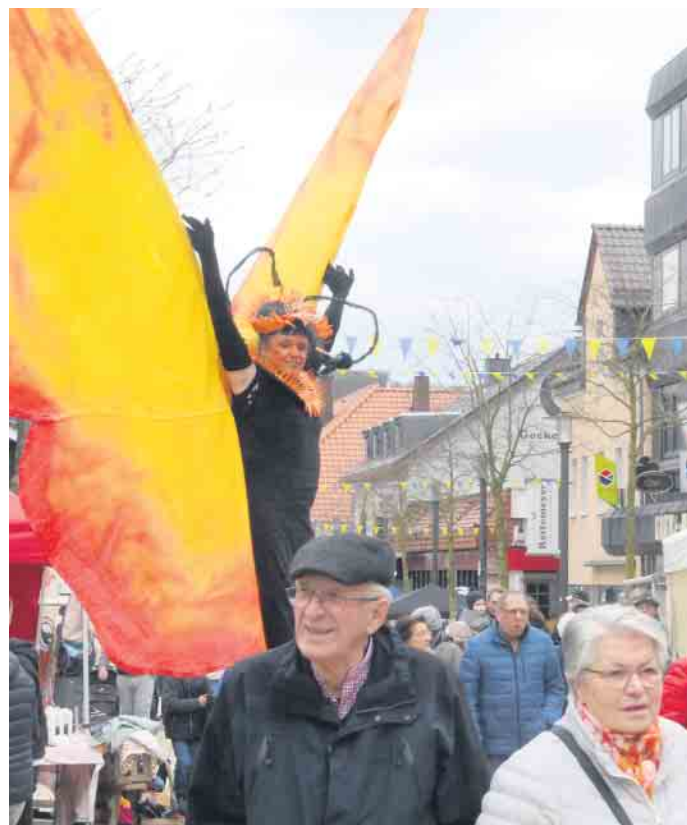
In der Bad Driburger Innenstadt ist zum Frühlingserwachen viel los.