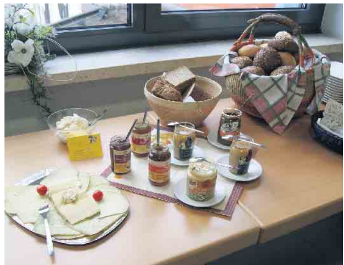
Lokale und fair gehandelte Leckereien beim Fairen Frühstück.

pro Person bitten wir bis zum 26. April auf folgendes Konto zu überweisen: DE02472643677600344310, Frau Rosemann, Verwendungszweck „Fairtrade“. Aufgrund des beschränkten Platzangebotes ist die Zahl der Teilnehmenden leider auf maximal 80 Plätze begrenzt, wobei der Zahlungseingang die Reihenfolge bestimmt. Ansprechpartnerin zu Fragen rund um die Anmeldung ist Karin Rosemann, erreichbar unter der Mobilfunknummer: 017696974633. Sie erreichen uns zudem unter fairtrade@bad-driburg.com. Wir freuen uns auf Sie. Ihre Fairtrade-Steuerungsgruppe