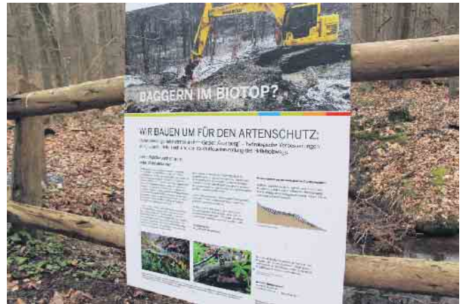
Eine Infotafel hat Spaziergänger über die Arbeiten aufgeklärt.

Kalktuffquellen treten oftmals kleinflächig auf und sind lediglich in Gebieten mit kalk-