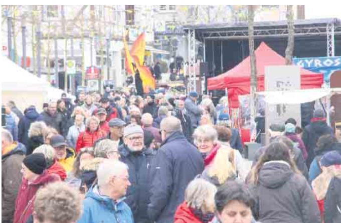
Zum ersten verkaufsoffenen Sonntag im Jahr ist die Bad Driburger Innenstadt bestens gefüllt.