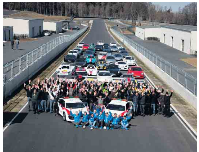
Offizielle Streckenfreigabe und Inbetriebnahme des Bilster Berg Drive Resorts durch die Gesellschafter im April 2013.

Weitere Informationen unter www.graeflicher-park.de/park/zehn-jahre-bilster-berg