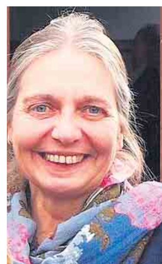
Die GRÜNEN bedauern, dass es nicht gelungen ist, Fördergelder aus dem Programm „Aufholen nach Corona“ für Schulsozialarbeit nach Bad Driburg zu holen.

Ende: Aus der Arbeit der Parteien Bündnis90 / Die Grünen