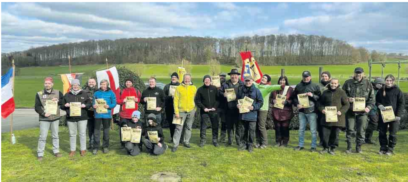
Die Gewinner beim gemeinsamen Gruppenfoto in allen Bogenklassen und Disziplinen beim 23. Internationalen Weitschuss Turnier in Bad Driburg-Dringenberg