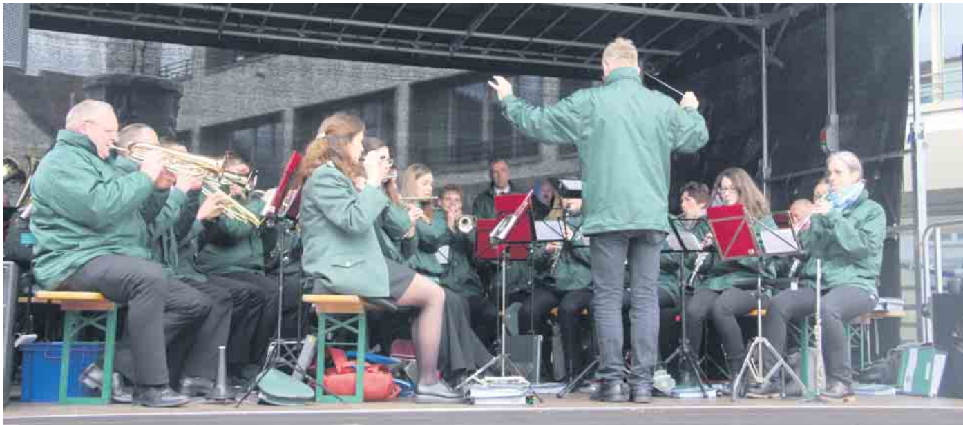
Die Bad Driburger Stadtkapelle legt sich ins Zeug.

Frühlingserwachen mit verkaufsoffenen Sonntag ist ein Publikumsmagnet