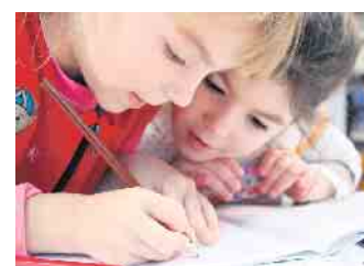
Die CDU hält die offene Jugendarbeit für besonders wichtig.