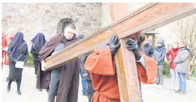
Die Kreuztracht in Pömbesen ist seit 1754 urkundlich belegt.

Im Erzbistum Paderborn gibt es sechs Kreuztrachten, der Kreis Höxter ist der einzige Kreis mit zwei Trachten. Neben Pömbesen gibt es auch in Gehrden eine Kreuztracht. Seit der zweiten Hälfte des 17. Jahrhunderts ist die Gehrden Kreuztracht belegt. In einem langen Zug folgten die Gläubigen der Kreuzigungsgruppe in Gehrden hinauf auf den Katharinenberg. Bei der Gehrden Kreuztracht wird der Jesus-Darsteller von vier Husaren flankiert. Die anderen Karfreitagsprozessionen sind in Delbrück, in Menden, in Sundern-Stockum und in Wiedenbrück. Das Wort „Tracht“ leitet sich aus dem altdeutschen Wort für „tragen“ ab.