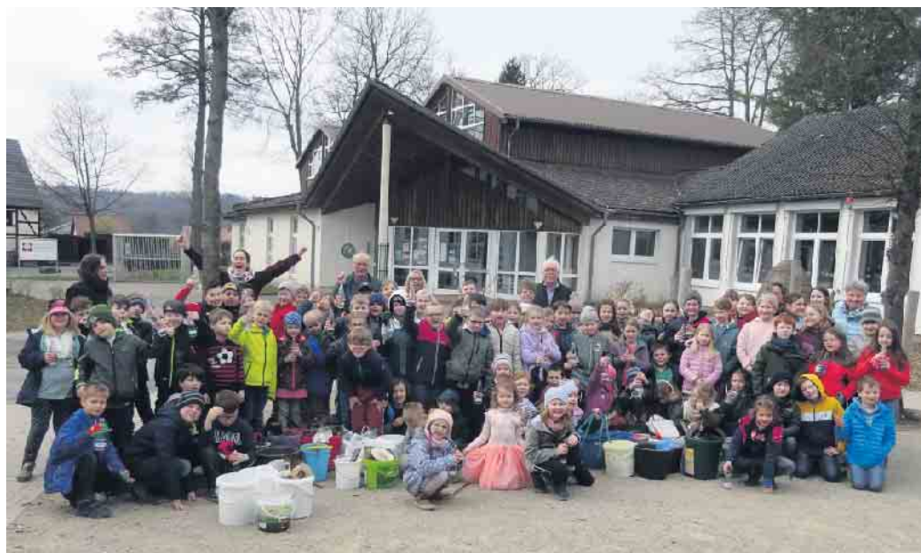
Umwelttag mit der Grundschule St. Walburga in Neuenheerse

biss und kalten Getränke ließen die Teilnehmer den Umwelttag nach getaner Arbeit bei guten Gesprächen ausklingen.