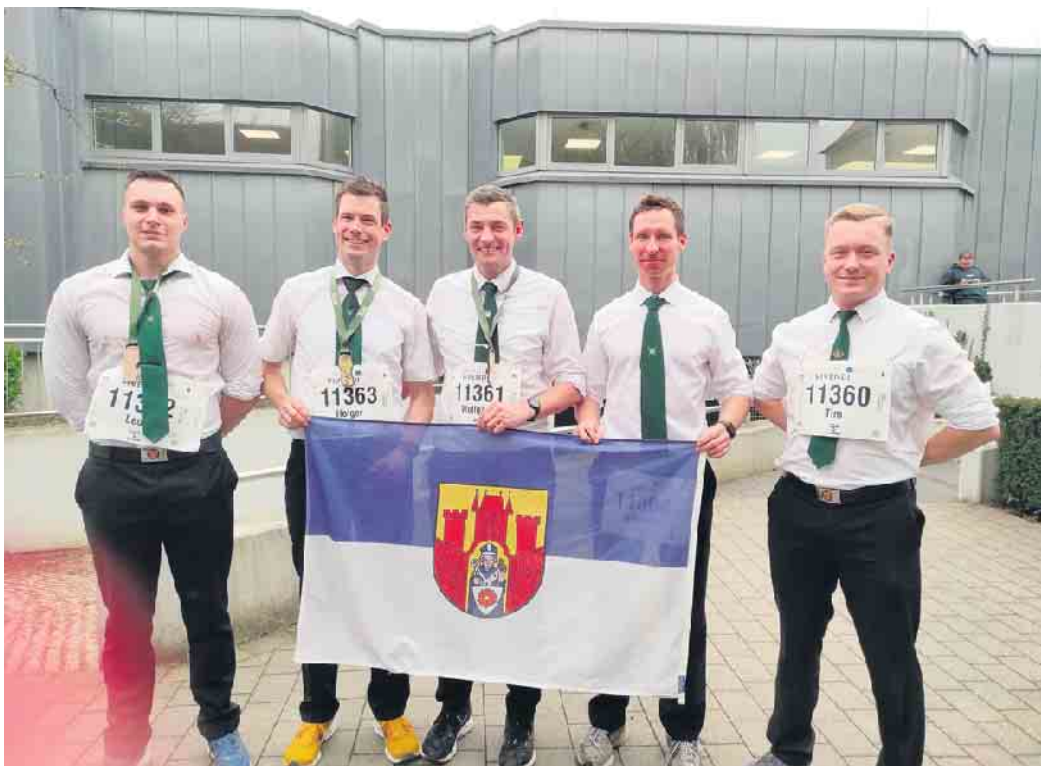
Die Dringenberger Schützen nach dem Lauf

Nach dem Motto „Laufen statt saufen“ haben wir die Wettkämpfe genutzt um sichtbar als Schützen aufzutreten und für die Sucht- und Drogenberatung des Beratungszentrums in Brakel zu spenden.