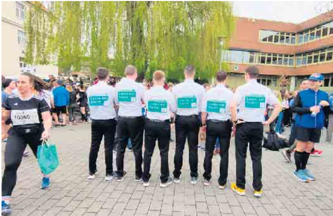
Die Schützen mit dem Motto auf dem Rücken