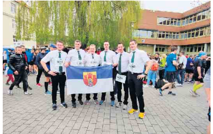
Die Dringenberger Schützen vor dem Lauf

Sechs Schützen unserer St. Sebastian Schützenbruderschaft Dringenberg haben am Osterlauf in Paderborn beim Fünf- und Zehn-Kilometerlauf teilgenommen.