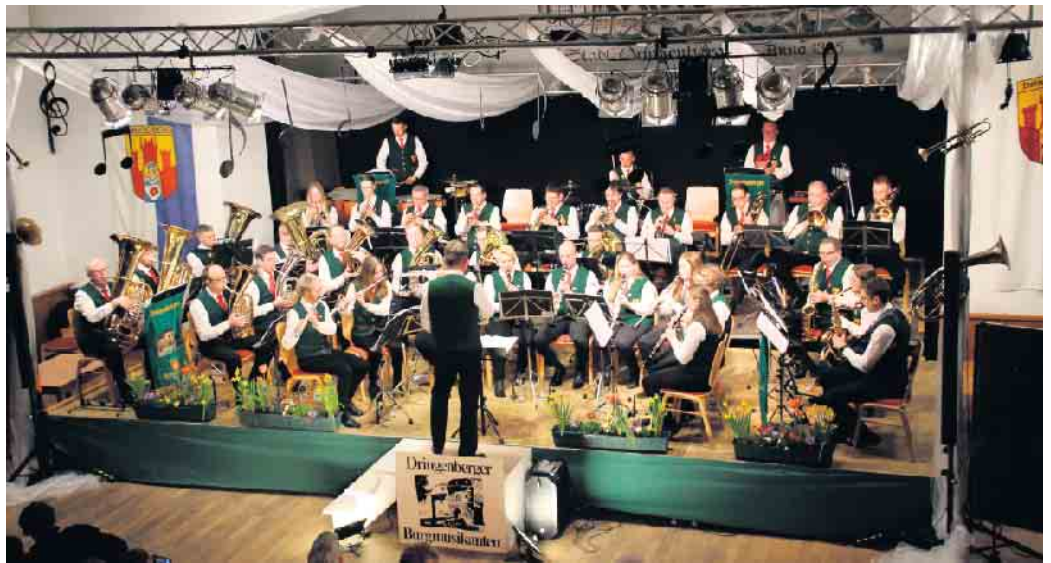
Die Dringenberger Burgmusikanten begeistern das Publikum mit ihren Klängen.

In der zweiten Hälfte erklangen unter anderem Melodien der „Neuen Deutschen Welle“ mit einem mitreißenden Medley bestehend aus Nenas größten Hits, sowie dem Rock'n'Roll