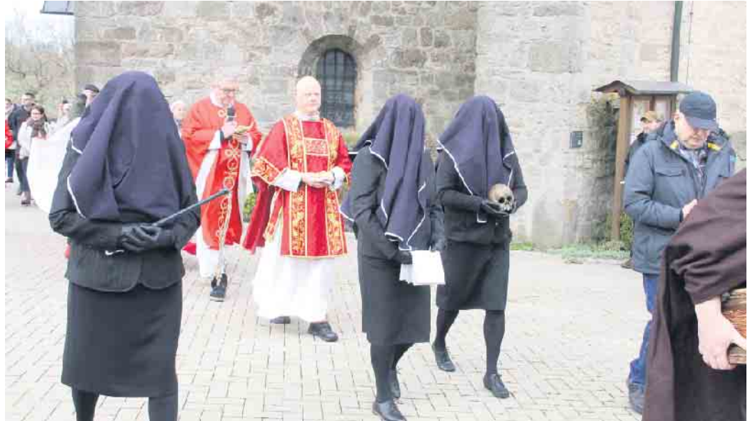
Drei verschleierte Frauen mit den Leidenssymbolen Geißel, Schweiß Tuch und Totenschädel folgen in Pömbesen dem Kreuzträger.

In Pömbesen begleiten drei verschleierte „fromme Frauen“ die Kreuztracht. Sie tragen die Lei-