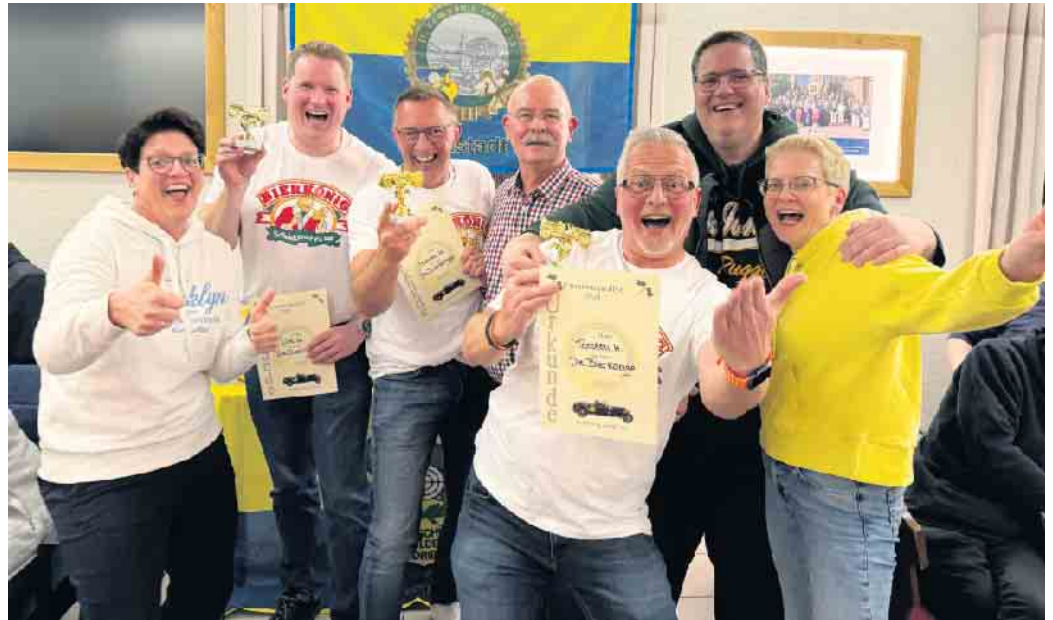
Die Siegermannschaft mit Gratulanten

Den umjubelten ersten Platz errang, für sie selbst überraschend, die Mannschaft „Die Bierköni-