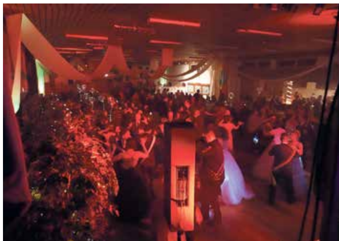
Beste Stimmung herrschte in der festlich geschmückten und gut gefüllten Martinushalle in Reelsen.