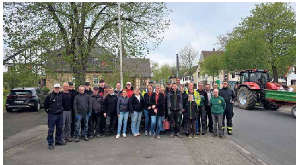
Teilnehmer des Dorfaktionstag Herste