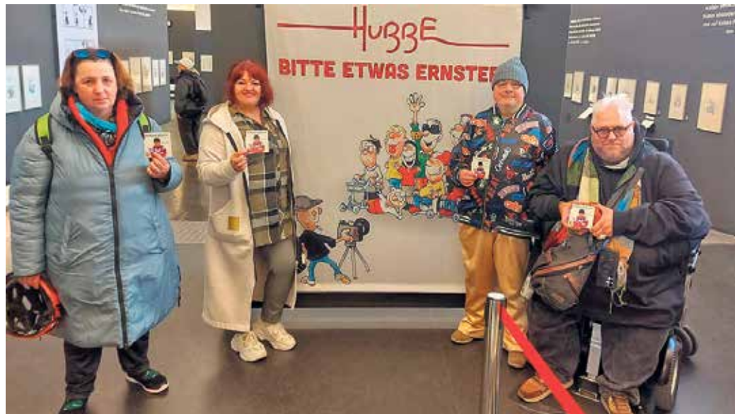
In der Hubbe-Ausstellung

Danach ging die Truppe in den Food Point im Einkaufszentrum City Point. Dort wurde bei verschiedenen Anbie-