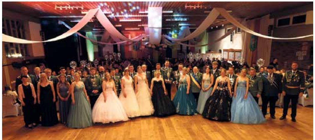
Königspaare und Majestäten der Großgemeinde Bad Driburg

Die Bürgerschützengilde Bad Driburg gewann das Schießen vor der Schützenbruderschaft St. Martinus