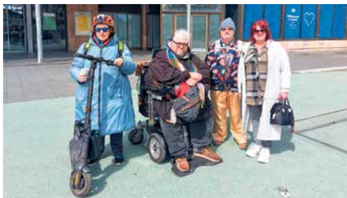
Das Wetter meinte es in Kassel gut

tern bestellt und an diversen Plätzen gegessen. Auch die Behindertentoiletten waren in Ordnung. Danach ging es auf die nahegelegene Casseler Frühlings-Freyheit, einem