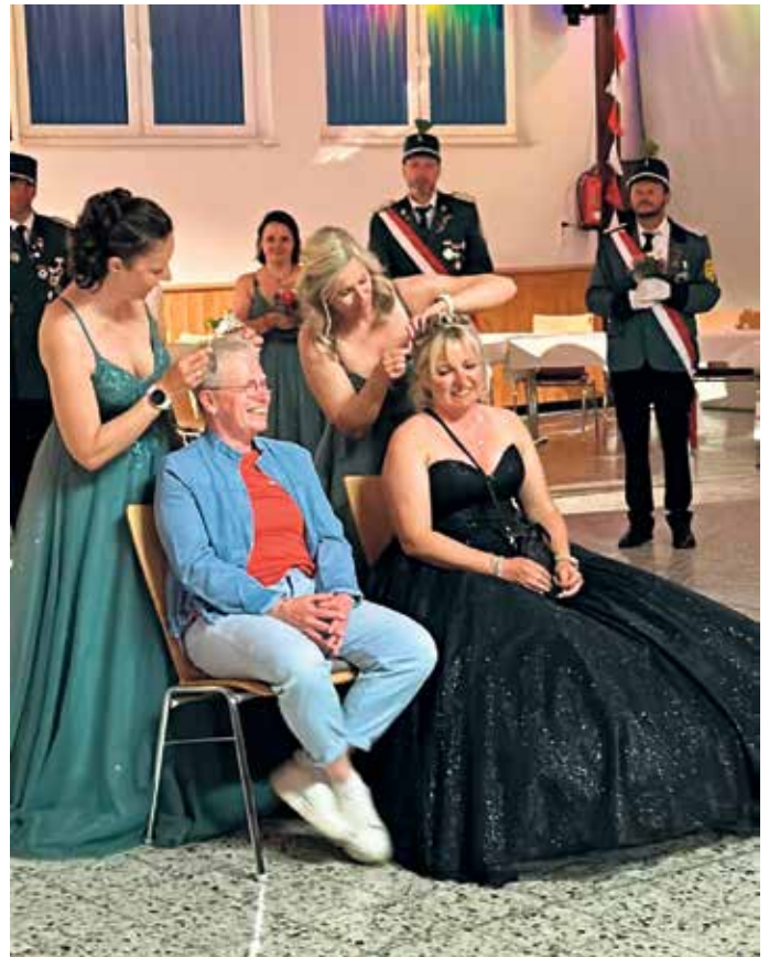
Proklamation (Übergabe der Krone)

Höhepunkt des Nachmittags ist die Parade um 15:00 Uhr an der Dreizehnlindenhalle. Am Abend folgt ab 18:00 Uhr Unterhaltung durch „limetree music“, bevor um 20:00 Uhr die Ehrentänze stattfinden. Der Montag, 18. Mai, beginnt um 09:00 Uhr mit dem Schützenhochamt. Um 10:00 Uhr lädt das Schützenfrühstück mit Ehrungen zum geselligen Beisammensein ein. Parallel findet das Frauenfrühstück statt. Um 13:15 Uhr treten erneut die Jungschützen an, um ihren König abzuholen. Um 14:00 Uhr treffen sich die Schützen am Weberplatz, um die Königsfamilie sowie die Damen zum Königskafee abzuholen. Am Nachmittag folgt um 17:00 Uhr der Kindertanz. Ab 20:00 Uhr sorgt die Partyband „VIVA“ für musikalische Unterhaltung, bevor um 22:00 Uhr die Ehrentänze den festlichen Abschluss bilden.