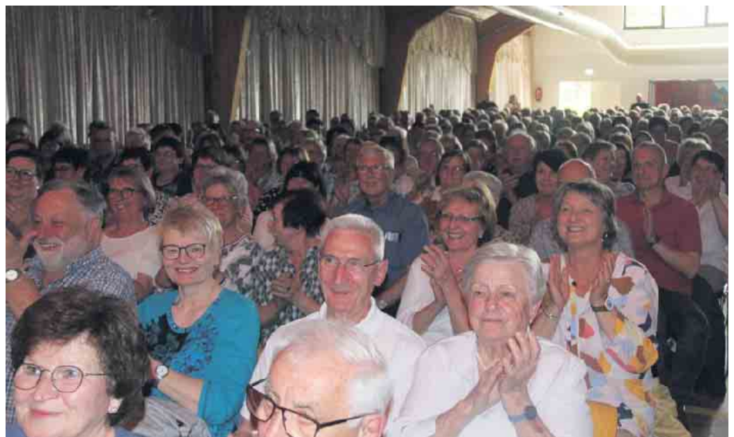
Das Publikum in der ausverkauften Schützenhalle amüsiert sich prächtig.

Dann wird Ruhrpott-Rockikone Stoppok auf der Bühne der Bad Driburger Schützenhalle stehen. Beginn ist um 20 Uhr, Einlass 19 Uhr. Stefan Stoppok ist Sänger, Musiker, deutschsprachiger Liedermacher und großartiger Gitarrist. Seine Musik ist eine eigenständige Mischung aus Folk, Rock, Blues und Country. Er singt mit feinem Humor über die Widrigkeiten des Alltags und profiliert sich dabei immer wieder neu als kritischer Betrachter seiner Umwelt.