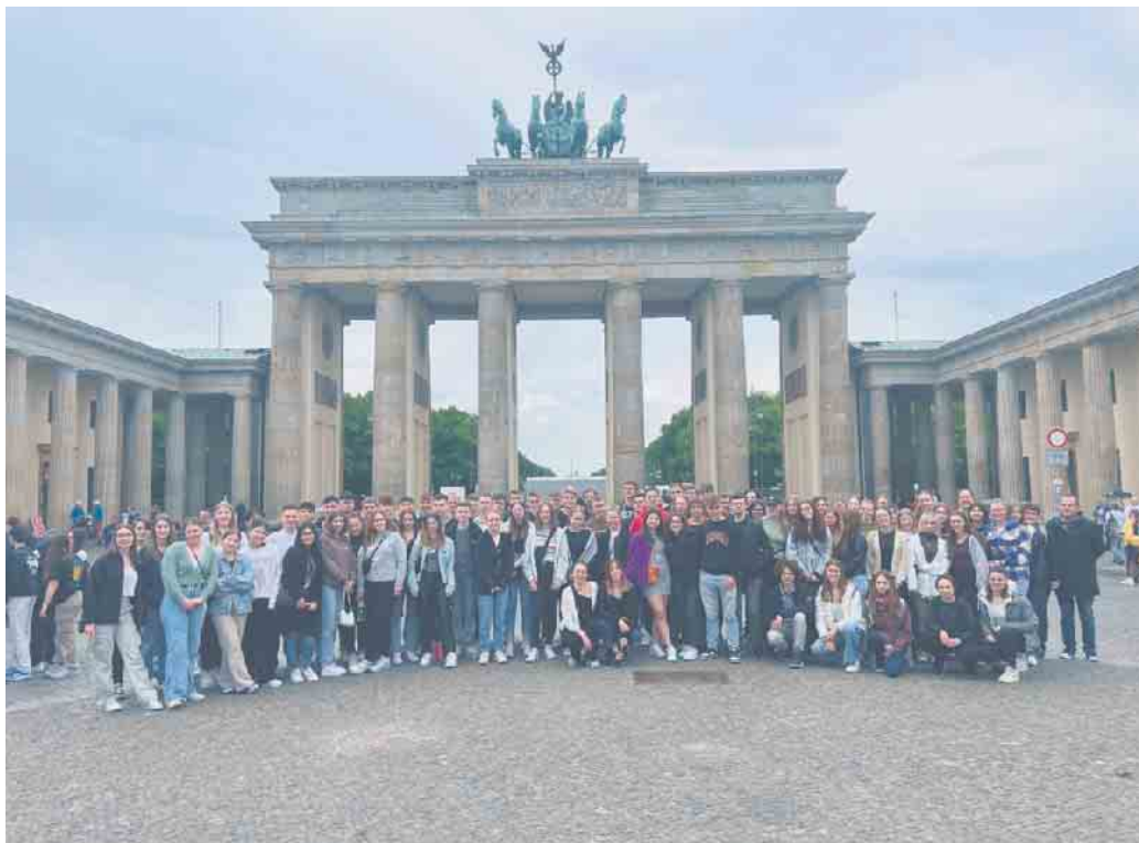
Das traditionelle Gruppenfoto vor dem Brandenburger Tor.

Schülerinnen und Schüler erleben abwechslungsreiche Tage