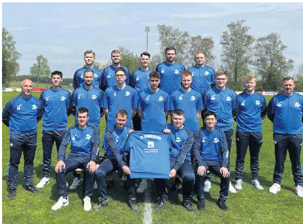
Die Burgreserve präsentiert die neue Teamausrüstung mit Präsentationsanzügen, Aufwärmshirts und Trainingskleidung.

Hierfür kann auf einige neue junge Spieler zurückgegriffen werden, die nun in den Seniorenbereich wechseln. Auch konnten ehemaligen Akteure wieder für das Team gewonnen werden. „Auf jeden Fall haben wir noch ein paar Trainingsanzüge frei, Spieler die Lust haben