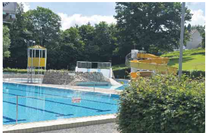
Freizeitbad Bad Driburg.