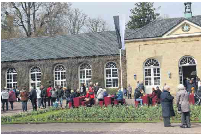
Umsonst und draußen: Das Parkfest im Gräflichen Park bietet ein buntes Programm für die ganze Familie

Buntes Programm lockt mit Spiel, Spaß und Musik