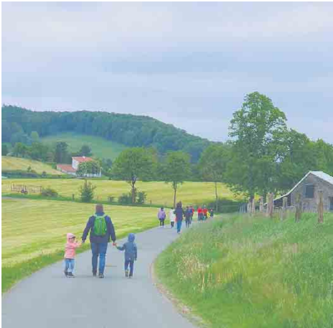
Die Wandergruppe auf dem Weg zurück ins Dorf.

Für Bieneninteressierte hat das Bücherei-Team eine ganze Fensterbank mit Büchern und Informationen hergerichtet. Schaut gerne vorbei.