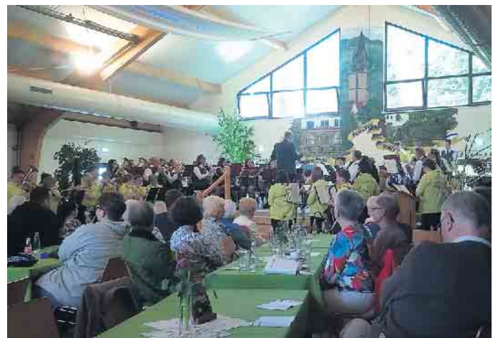
Am Ende des Konzertes blieb es nicht nur bei einer Zugabe. Als Sahnehäubchen spielten alle Musiker zusammen Melodien der Gruppe „Santiano“.

Songs von Queen oder Musik aus Disney-Filmen. „Unvergesslich waren unsere Probetage auf Helgoland“, so ein Teilnehmer im Gespräch. Das Projektorchester der Stadtkapelle mit mehr als 70 Teilnehmern probte schon zum achten Mal intensiv und begeistert auf der Hochseeinsel. Endlich konnten jetzt während des Frühjahrskonzertes die Urkunden an junge Musikerinnen und junge Musiker in einem würdigen Rahmen überreicht werden. Ein gelungener Sonntagnachmittag mit vielen fleißigen Akteuren im Vordergrund und engagierten Helfern im Hintergrund ging zu Ende. Doris Dietrich