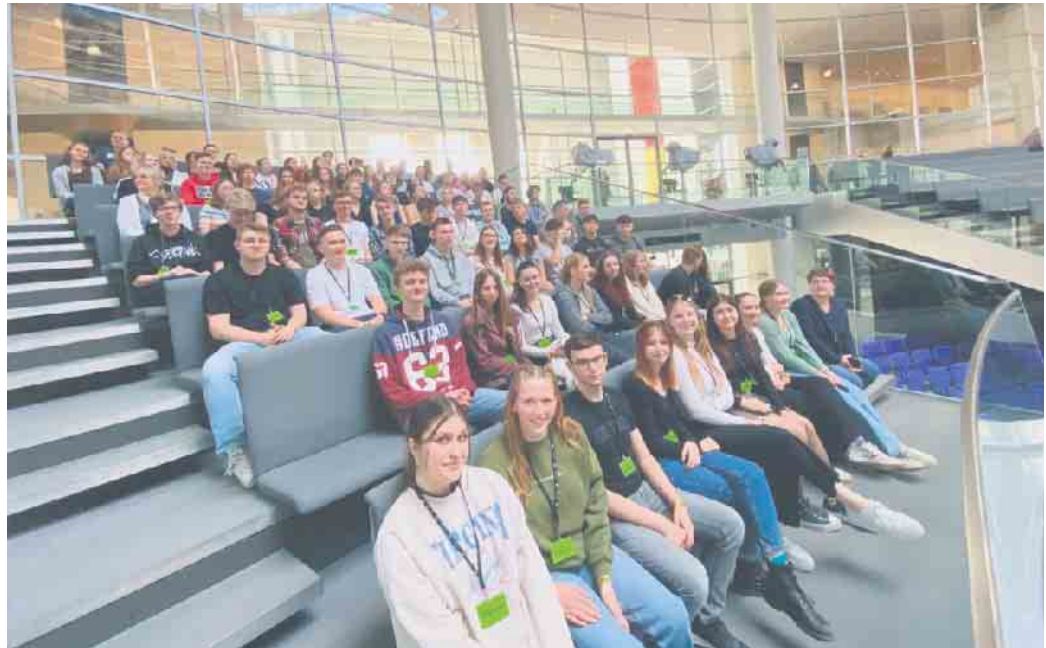
Spannende politische Einblicke erlebten die Schülerinnen und Schüler im Plenarsaal des Bundestags.

So war die Berlinfahrt auch in diesem Jahr nicht nur eine vergügliche Abschlussfahrt nach zwölf Jahren Schule, sondern sie beinhaltete die wichtige Erfahrung, dass unser Leben in Freiheit eben keine Selbstverständlichkeit ist, sondern etwas, für das auch diese Abiturientia in Zukunft einstehen muss.