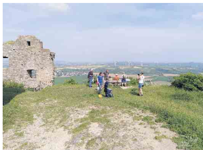
Geschafft: Pause an der Ruine auf dem Desenberg.