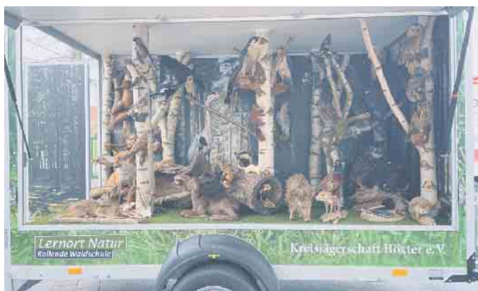
Waldschule: Neu dabei in diesem Jahr: die rollende Waldschule der Kreisjägerschaft Höxter

Ebenfalls neu im Gräflichen Park ist das Gräfliche MVZ - Medizinisches Versorgungszentrum. Im alten Stahlbadehaus wird das MVZ für Ärztliche Psychotherapie am Sonntag, 4. Juni, um 12 Uhr feierlich eröffnet. Alle Besucher sind herzlich eingeladen, die neuen Räumlichkeiten kennenzulernen. Weitere Informationen unter www.graeflicher-park.de