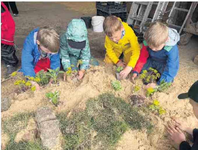
Mit großer Begeisterung und Fantasie gestalten die Kinder im Sand mit Steinen und Pflanzen eine kleine Landschaft.