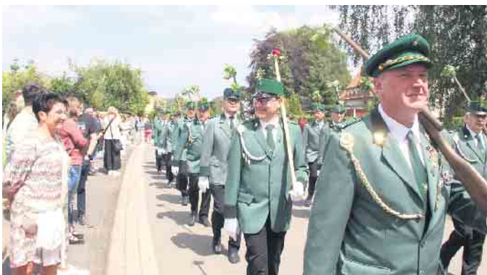
Viele Schaulustige stehen an den Straßenrändern und applaudieren.

lieferten sich beim Prinzenschießen ein hartes Kopf an Kopf rennen und konnten sich schlussendlich mit treffsicheren Schüssen durchsetzen. Beim traditionellen Königsschießen am Schützenfestmontag, werde der neue König in diesem Jahr erstmals nicht durch ein Scheibenschießen ermittelt, sondern durch ein Vogelschießen auf einen Holzadler, teilte Schützenoberst Philipp Frahmke mit.