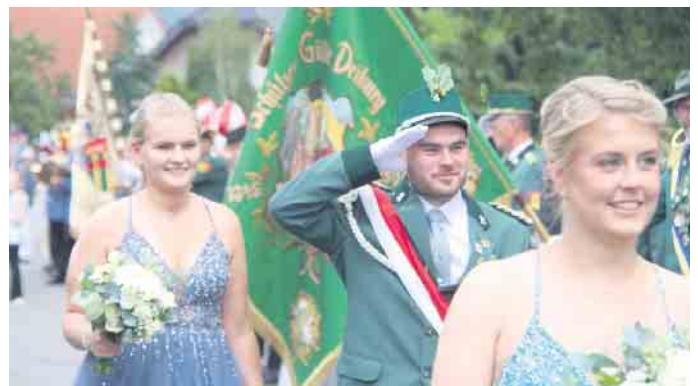
Die Schützenbruderschaft St. Urbanus Herste feiert ein strahlendes Schützenfest.