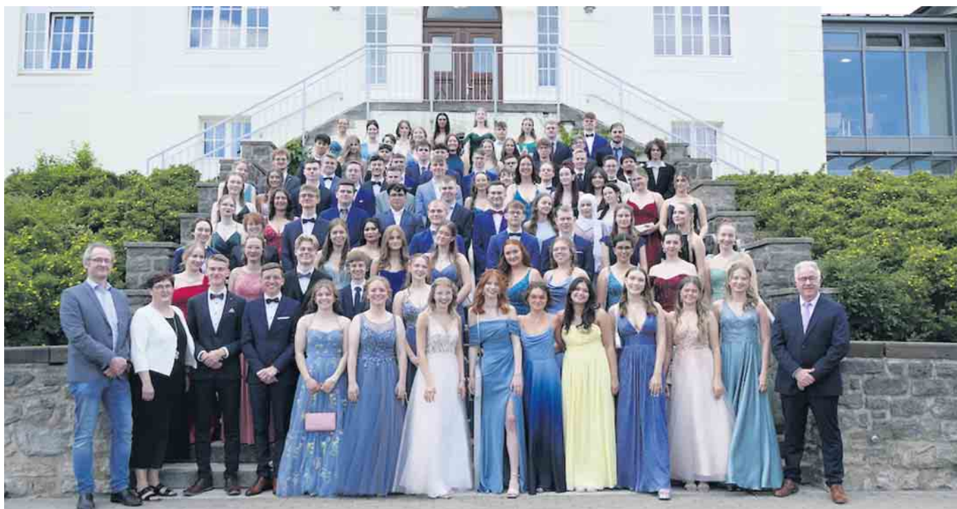
Die Abiturentinnen und Abiturienten am Gymnasium St. Xaver.

Abiturentlassfeier am Gymnasium St. Xaver