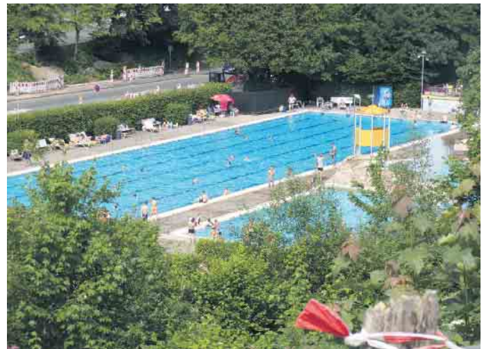
Der Förderverein wünscht allen Besucherinnen und Besuchern einen sonnigen Aufenthalt im schönen Freibad an der neu gestalteten Brunnenstraße.