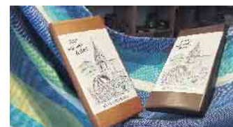
Bad Driburger Schokolade