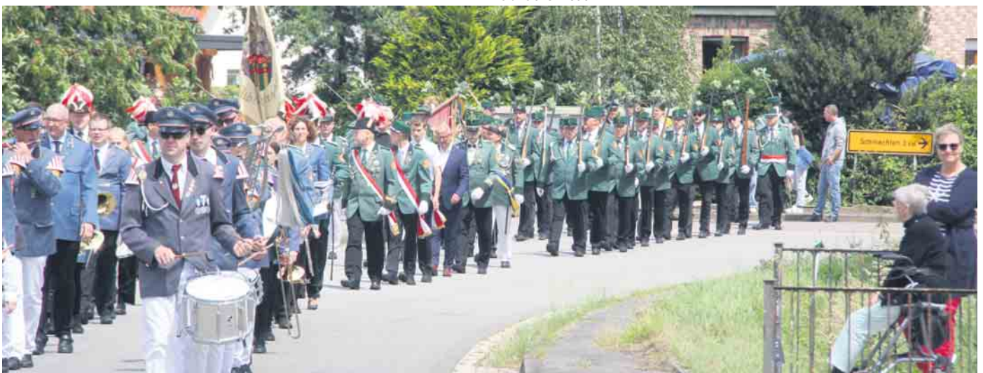
Der große Festumzug zieht durch das Dorf.