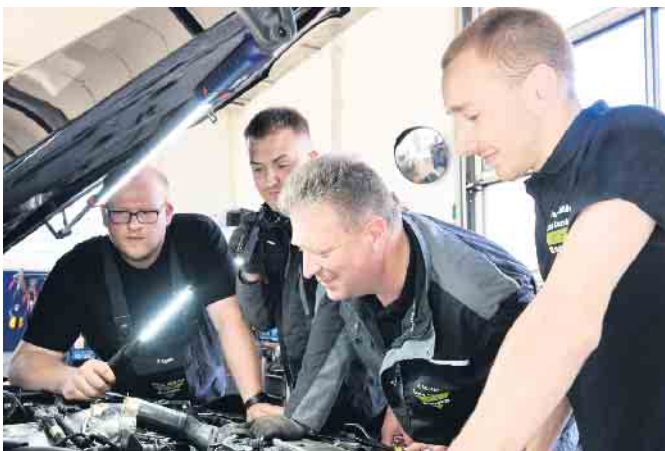
Eine hohe Fachkompetenz zeichnet das Auto Center Roosen aus.