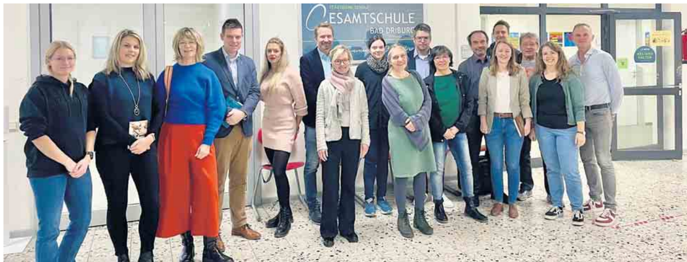
Viele Freunde und Förderer der Gesamtschule folgten der Einladung und lasen den SchülerInnen vor.

Zahlreiche Kooperationspartner und Freunde am bundesweiten Vorlesetag zu Gast in der Gesamtschule Bad Driburg