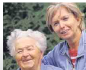
Meine Mutter braucht Pflege