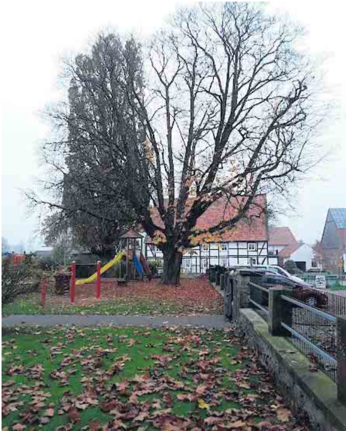
Die Kastanie an der Kita in Herste.