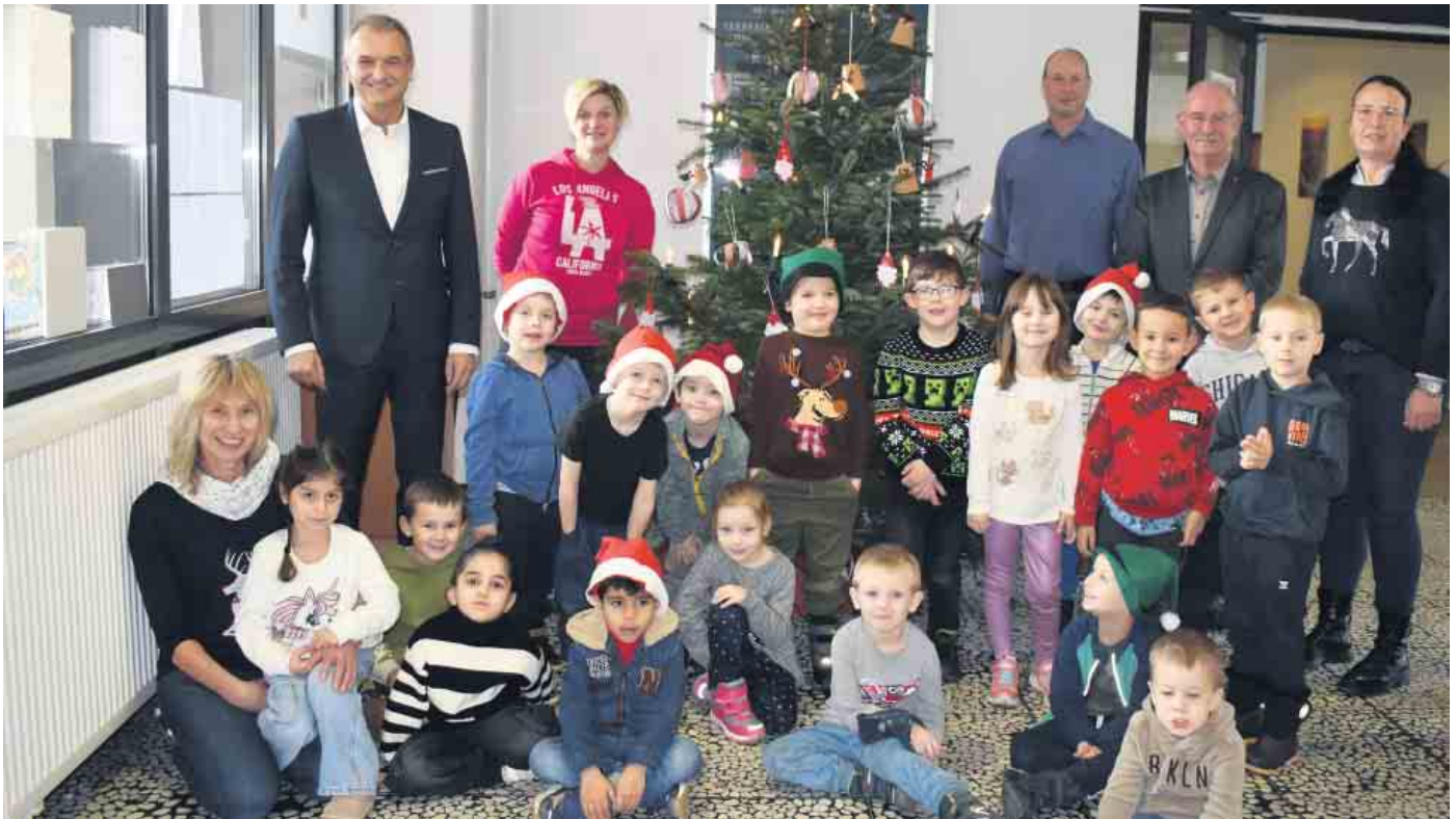
Bürgermeister Burkhard Deppe, 3. von links, freute sich über den schönen Weihnachtsschmuck der Kita-Kinder des Familienzentrums Miteinander.

Bunt verziert und mit Lichtern behängt erfreut im Eingangsbereich des Bad Driburger Rathauses jetzt wieder der Weihnachtsbaum die Bürger und Mitarbeiter. Für den farnefrohen und kreativen Schmuck haben in diesem Jahr die Kinder des städtischen Familienzentrums „Miteinander“