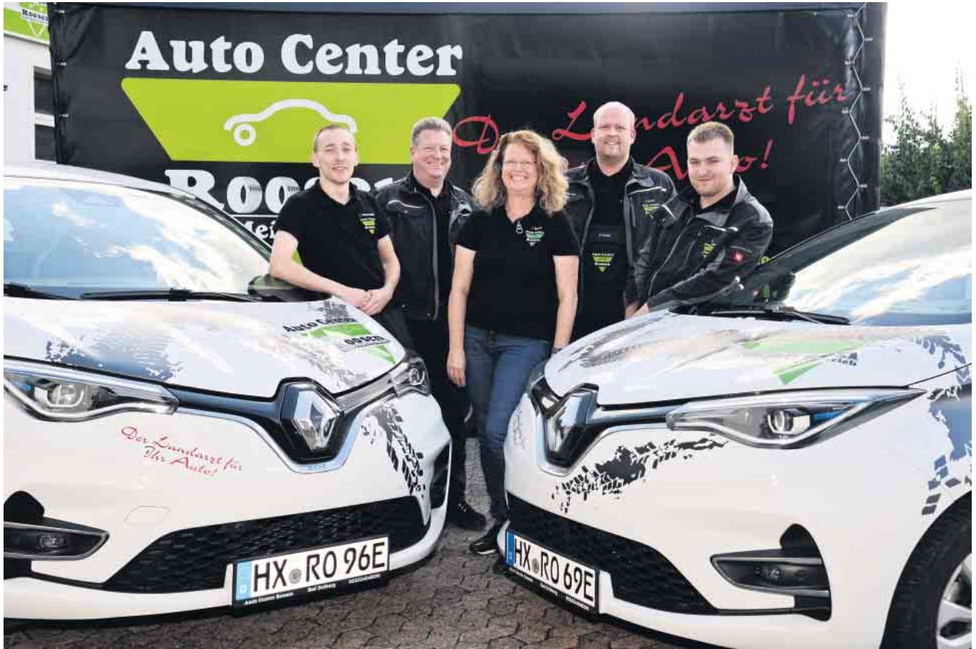
Das Team vom Auto Center Roosen. Hier ist das Fahrzeug in guten Händen.

bis heute die Ausbildung des Nachwuchses. Jahrelang war er als Ausbilder im Technologie- und Berufsbildungszentrum Paderborn tätig und gibt sein Wissen mit Leidenschaft an die nächste Generation von Kfz-Mechatroniker/innen weiter.