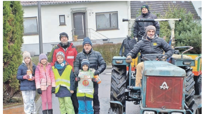
Wehrendorfer Ortsjubiläum 950 Jahre, das vom 30. August bis 1. September 2024 gefeiert werden soll. FL ●

ausgedienter Weihnachtsbäume aufgeboden. In Wehrendorf sind es gleich 17 Fuhrwerke und ca. 100 Helfer (darunter auch viele Jugendliche), die in bewährter Tauschmethode Spende gegen Mitnahme ausgedienter Weihnachtsbäume die Kasse klingeln lassen. Der Fleiß hat sich gelohnt, 12.300 € klimperten oder rauschten in die Büchsen. Nach 51 Jahren sind es insgesamt 257.300 €, die auf das Konto der Krebshilfe geflossen sind. Das ist schon mal ein guter Einstieg für das anstehende