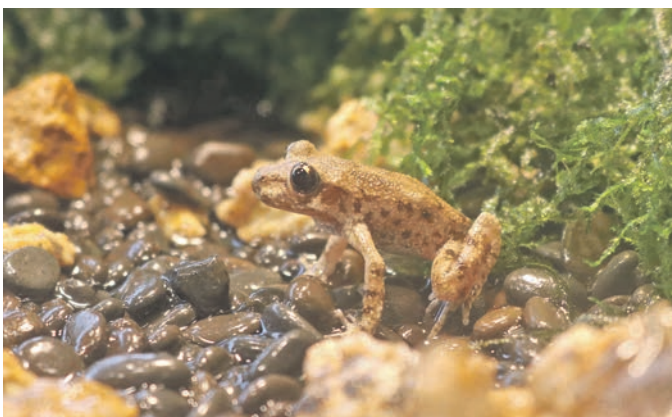
Mallorca-Geburtshelferkröten: Die Mallorca-Geburtshelferkröten sind nur knapp 4 Zentimeter groß.

Das Mönchsgeier-Weibchen Hera, das bisher im Zoo Osnabrück lebte, ist nun im Zoo Planckendael Zuhause. „Wir sind im Austausch mit den Kollegen in Belgien. Da das Zuchtbuch der Mönchsgeier