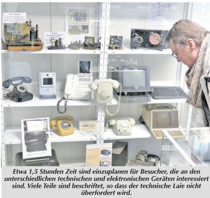
Etwa 1,5 Stunden Zeit sind einzuplanen für Besucher, die an den unterschiedlichen technischen und elektronischen Geräten interessiert sind. Viele Teile sind beschriftet, so dass der technische Laie nicht überfordert wird.