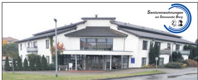
Seniorenwohnungen am Sternwider Berg

Ein umfangreiches Kuchenangebot rundet die Veranstaltung ab! Nähere Informationen zum Flohmarkt werden auf der Internetseite www.sekundarschule-preussisch-oldendorf.de unter der Rubrik Förderverein bereit gestellt. Tischreservierungen können ab sofort unter 05742/921497 erfolgen.