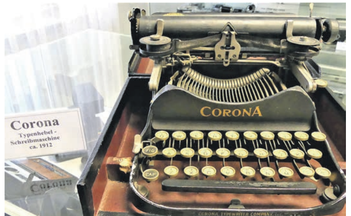
Schon makaber, der damalige Hersteller bezeichnete seine Typenhebel-Schreibmaschine von 1912 mit dem Namen Corona - sie konnten vor 110 Jahren nicht wissen, dass in den Jahren um 2020 mit dem Namen „Corona“ eine Virus-Pandemie bezeichnet werden sollte, die die Weltwirtschaft fast zum Erliegen bringen sollte.