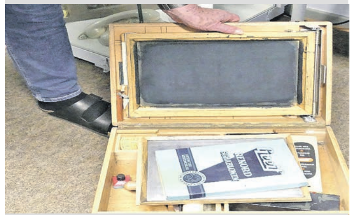
Ob mit diesem oder einem anderen Druckkasten der Marke Geha die beiden Geschwister Scholl unter dem Synonym „Schwarze Rose“ ihre Protestzettel gegen die NS-Diktatur druckten? Die mutigen Geschwister wurden von den Nazis hingerichtet, weil sie Zivilcourage bewiesen und das Unrecht des Systems früh erkannten.