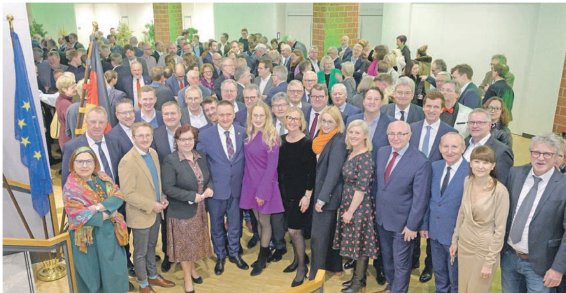
2024 - Gemeinsam für das Osnabrücker Land. Zum Auftakt ins neue Jahr empfing Landrätin Anna Keschull zahlreiche Gäste im Kreishaus Osnabrück.

Aus Anlass des 25-jährigen Jubiläums der Partnerschaft zwischen der Landkreisen Osnabrück und Olsztyn (Polen) war Landrat Andrzej Abako zusammen mit einer Delegation aus dem Landkreis Olsztyn angereist. In einem Grußwort hob er die jahrelange