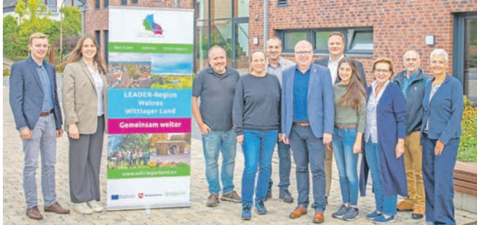
Beschließt Stichtage, Budgets und Projektförderungen: die Lokale Aktionsgruppe Wittlager Land mit Unterstützung des Regionalmanagements (links).

Die Gemeinden Bad Essen, Bohmte und Ostercappeln blicken auf viele Jahre der erfolgreichen Kooperation als Wittlager Land zurück. Im Mai 2023 schlug die Region ein neues Kapitel auf: als LEADER-Region Wittlager Land. Über die Dauer von fünf Jahren kann die Region mit einem festen Budget Projekte fördern und damit die Region in zentralen Bereichen weiterentwickeln. Im ersten LEADER-Jahr wurden bereits 8 Projekte von der Lokalen Aktionsgruppe (LAG), dem Entscheidungsgremium der Region, beschlossen.