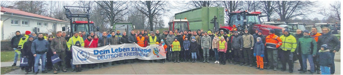
Jetzt geht es los: Auf dem Kirchplatz in Bad Essen gibt es von der Kaffeemühle das „offizielle“ Startzeichen für die eingeteilte Truppe.