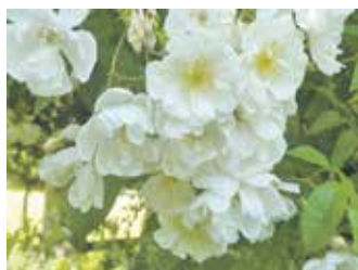
Kletterrose 'Bobbie James'

Wer weiter fahren will, hat reichhaltig Gelegenheit, sich in den zahlreichen Rosarien im In- und