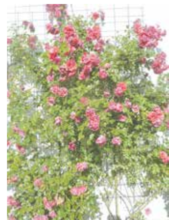
Kletterrose 'Rosarium Uetersen'