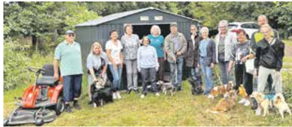
Der Vorstand und einige Mitglieder der HuWieBo – Hundewiese Bohmte e. V. präsentieren gemeinsam mit ihren Hunden den neuen Aufsitzmäher und den frisch gebauten Unterstand.

05. Juli 2026. Mit viel Rückenwind aus Mitgliedsbeiträgen und zahlreichen Spenden konnte sich der HuWieBo Bohmte – Hundewiese Bohmte – e. V. einen lang gehegten Wunsch erfüllen: einen eigenen Aufsitzmäher. Damit die neue Unterstützung für die Pflege der Hundewiese auch gut geschützt ist, wurde außerdem ein passender Unterstand in Form einer Hütte gebaut – ermöglicht durch die großzügige Unterstützung der Gemeinde Bohmte. Am vergangenen Sonntag wurden Mäher und Hütte im Rahmen eines fröhlichen Grillfestes gemeinsam eingeweiht. Mit dabei war auch Ortsbürger-