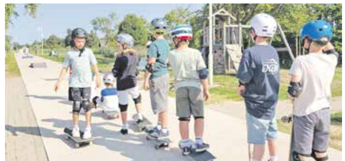
Üben mit kleiner Rampe

Termin: 10.–11. August 2026, jeweils 10.00–16.00 Uhr (inkl. Mittagessen)