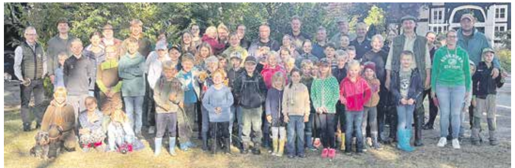
Kinder nach der Frühpirsch mit Jägern und Helfern

Somit wurde den Kindern auch in diesem Jahr die heimische Natur mit ihren vielfältigen Pflanzen und Tieren durch Mitglieder des Hegerings Bohmte nähergebracht und der erste Ferientag für alle Teilnehmer zu einem unvergesslichen Erlebnis.