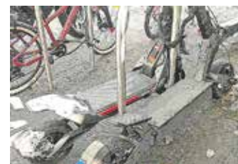
In dieser Region 2025 alleine 18 Unfälle mit E-Scootern, womöglich noch eine Dunkelziffer – Prävention ist dringend geboten.

Die „Polizei – Dein Freund und Helfer“: Hier greift dieser Satz, denn die Polizeiinspektion Osnabrück bietet auch auf Nachfrage Präventions-schulungen an, etwa die Sensibilisierung für typische Unfallursachen, die Verkehrsregeln, die Nutzung von E-Scootern erst ab dem 14. Lebensjahr (Strafmündigkeitsalter?), nur eine Person auf dem E-Scooter, kein Mitfahrer. Der Hinweis auf sogenannte Ablenkungsgefahren wie Smartphone-Nutzung oder Kopfhörer während der Fahrt. Wichtig für die Eltern etwa als Halter des E-Scooters, dass unzulässige technische Veränderungen (Tuning) im Unfallgeschehen auch zusätzlich rechtliche Folgen haben können.