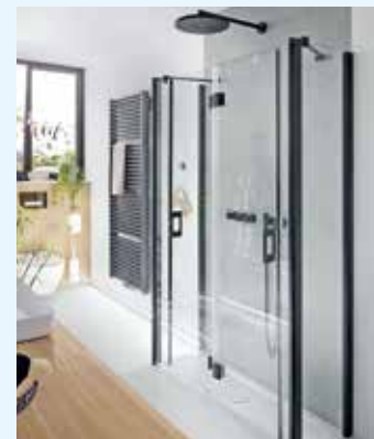
Die Dusche Liga als Pendel-Falt U-Form ist ein echtes Platzwunder. Sie lässt sich auf weniger als 40 cm an die Wand falten.