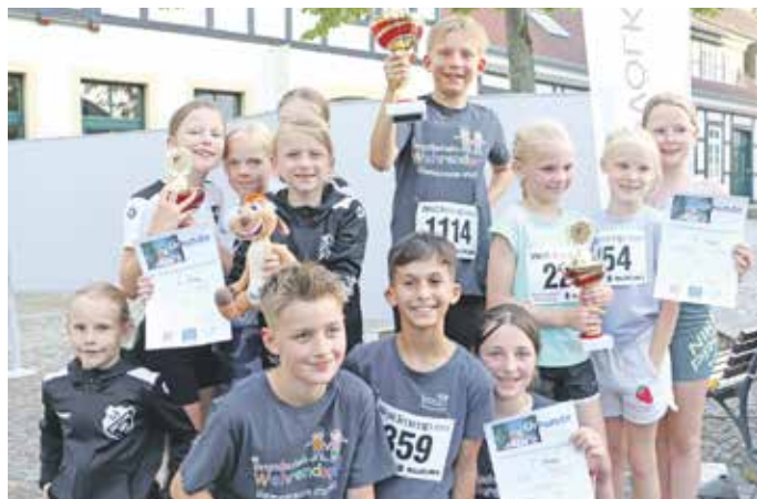
Siegerehrung Kinderstaffel Grundschule Wehrendorf

Hinweis: Alle Ergebnisse vom Abendlauf 2026 können im Internet unter www.laufen-os.de abgerufen werden. Außerdem ist es unter dieser Adresse auch möglich, alle Teilnahmeurkunden selbst zu drucken .