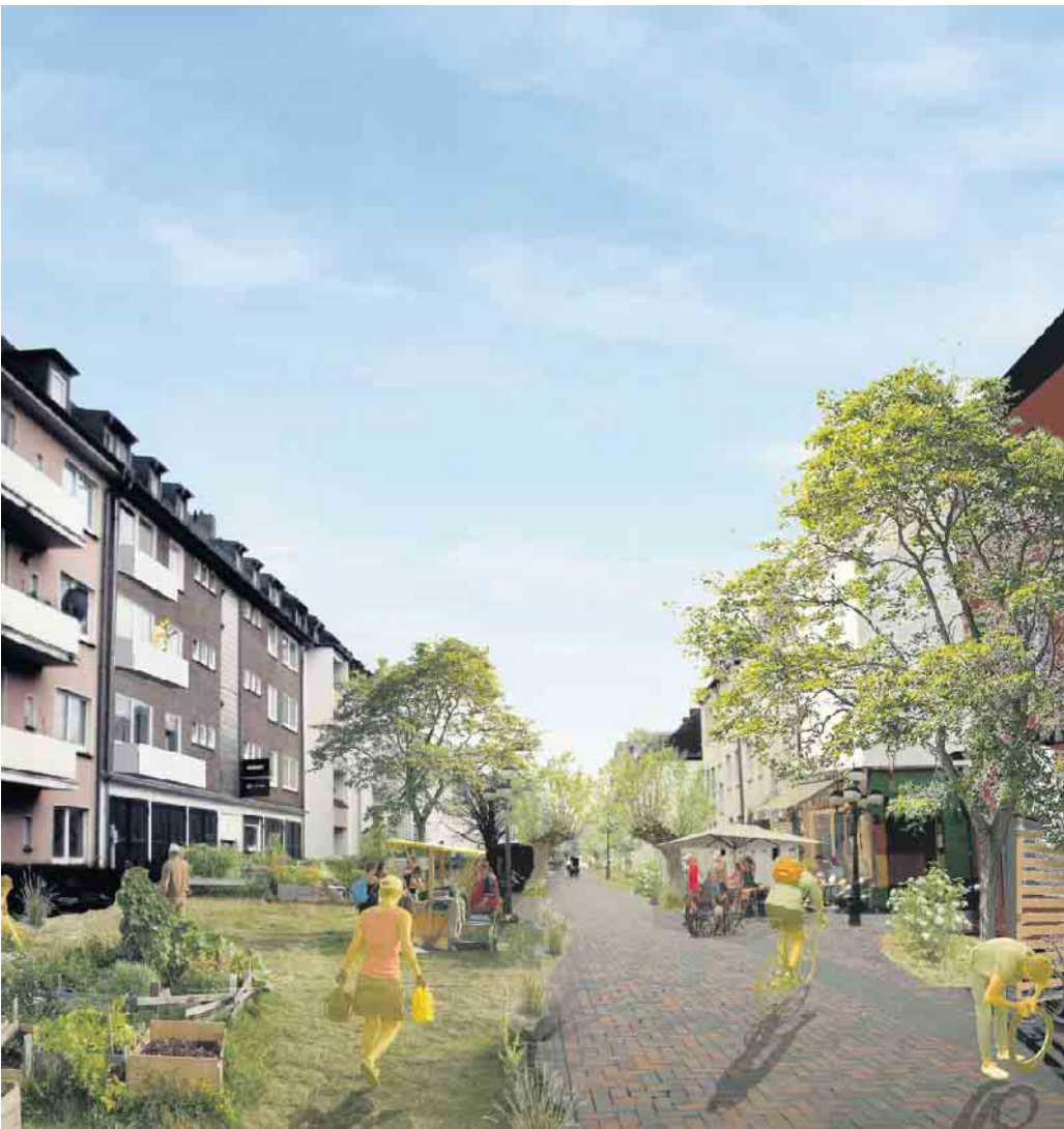
Zukunftsvision „Stadt von morgen“; Bildnachweis: Stadtverwaltung Euskirchen - FB 9, Planung

Die Kreisstadt Euskirchen lädt am 20. Februar 2025 ab 18:30 Uhr zusammen mit NRW.Energy4Climate zu einer Zukunftswerkstatt ins Alte Casino ein! Gemeinsam können dort Zukunftsbilder für den Umwelt- und Klimaschutz in Euskirchen entwickelt werden, die selbstständig und mit Unterstützung der Stadt von engagierten Bürgerinnen und Bürgern realisierbar sind.