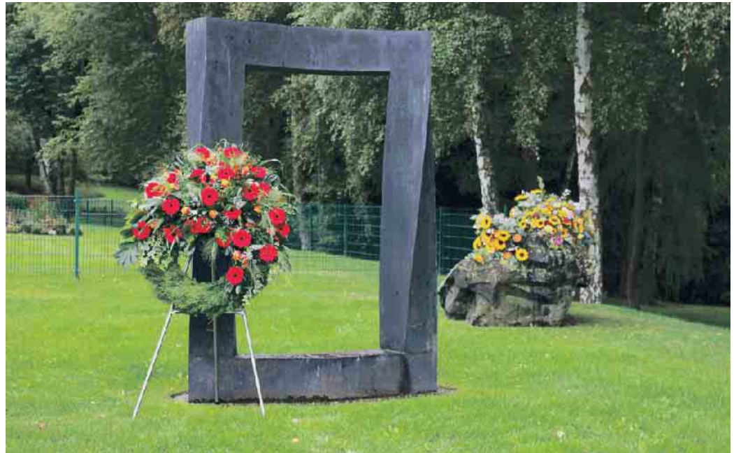
Tor zwischen den Welten.

Im größten Krematorium Deutschlands, dem Rhein-Taunus-Krematorium, ist man tagtäglich mit Abschied und Trauer konfrontiert. Judith Könsgen, Geschäftsführerin des Krematoriums erlebt oft, wie liebevoll ein Sarg zum Abschied bemalt wurde und wie individuell Trauerfeiern gestaltet werden. Sie ermutigt Angehörige,