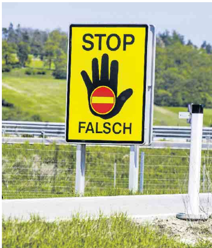
Viele Autobahnauffahrten sind deutlich gekennzeichnet. Dennoch kommt es immer vor, dass Autofahrer aus Versehen falsch auffahren.

für den Fall der Fälle: Geschwindigkeit drosseln, Warnblinkanlage einschalten, genug Abstand zum Auto vor einem halten, nicht überholen und wenn möglich einen Parkplatz ansteuern, bis die Gefahr vorüber ist. Wer selbst zum Falschfahrer wird, sollte in keinem Fall wenden, sondern das Licht und die Warnblinkanlage aktivieren, sofort das Auto am nächsten Fahrbahnrand abstellen, möglichst dicht neben der Schutzplanke, das Fahrzeug verlassen und die Polizei rufen. (DJD)