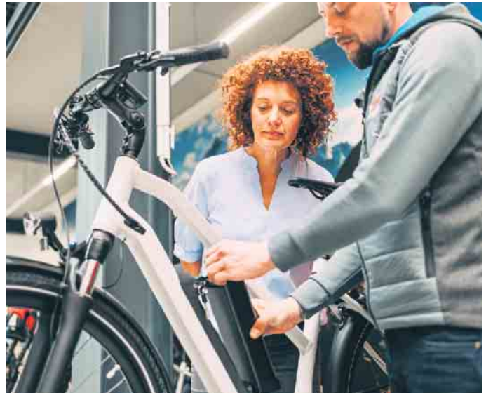
Vor der Winterpause sollte das E-Bike gründlich gewartet werden. Tipp: Den Akku abnehmen und separat an einem trockenen Ort ohne große Temperaturschwankungen lagern.