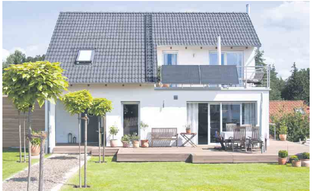
Balkonkraftwerke sind aber auch für Hauseigentümer interessant, die sich eine Photovoltaik-Anlage auf dem Dach nicht leisten können oder wollen.

Mini-Solaranlagen überschritten, laut Bundesnetzagentur bedeutet dies eine Verdoppelung seit Mitte 2023. Im zweiten Quartal beispielsweise werden voraussichtlich deutlich mehr als 100.000 Balkonkraftwerke neu in Betrieb gehen. Für den Boom ist auch die Entbürokratisierung verantwortlich: Seit dem 16. Mai