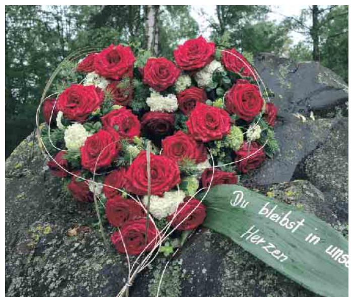
Gedenken Blumenherz.