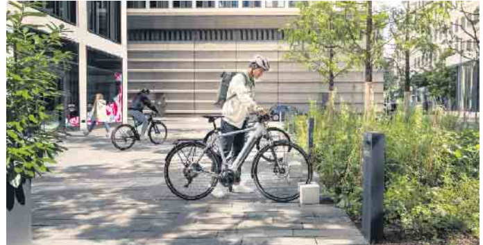
Sorgenfreier unterwegs: Mit einem digitalen Diebstahlschutz wird das Abstellen von E-Bikes noch sicherer.

Für ein sorgenfreieres Abstellen sorgt zusätzlich die Möglichkeit, jederzeit den Standort und den Sicherheitsstatus des E-Bikes zu überprüfen. Zusätzlich dient ein Sicherheitsfeature zum Deaktivieren der Motorunterstützung. Ob es aktiv und damit die Motorunterstützung deaktiviert