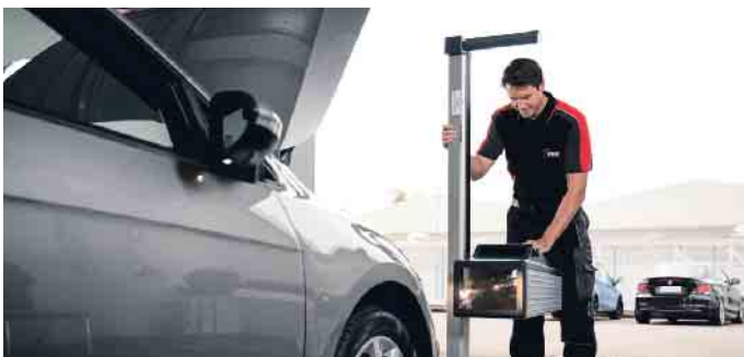
Die funktionierende Beleuchtung am Auto ist für alle Verkehrsteilnehmer lebenswichtig.

Bei einer Hauptuntersuchung wird die nicht zulässige Nachrüstung von Leuchtmitteln als „Erheblicher Mangel“ eingestuft werden, sodass die HU-Plakette dann nicht erteilt werden darf.