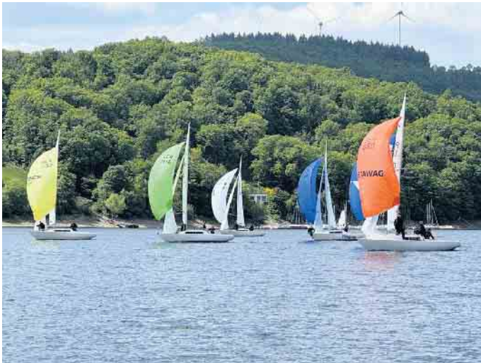
H-Boote unter Spinnaker.

Diese Regatta ist eine Ranglistenregatta mit dem Faktor 1,15. Die zehn teilnehmenden Schiffe sind der Bootsklasse der H-Boote