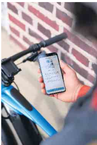
Abschreckende Wirkung: Zusätzlicher digitaler Diebstahlschutz macht das E-Bike unattraktiver für Diebe.

ist, signalisieren kurze Töne, Lichter und Symbole auf der Bedieneinheit LED Remote, dem Display oder Smartphone. Unter www.bosch-ebike.com/de/produkte/ebike-protect gibt es weitere Tipps für einen wirksamen Diebstahlschutz fürs E-Bike. (DJD)