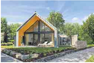
Ein auskragendes Dach schließt die Terrasse in das Gesamtbild des Gebäudes ein und schützt sie vor Witterungseinflüssen.

Frühzeitige Planung spart Aufwand und zahlt sich langfristig aus