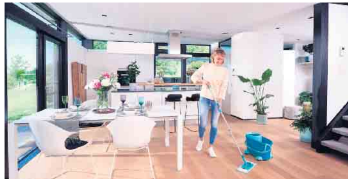
Verschmutzungen finden keinen Halt auf der glatten Holzoberfläche.