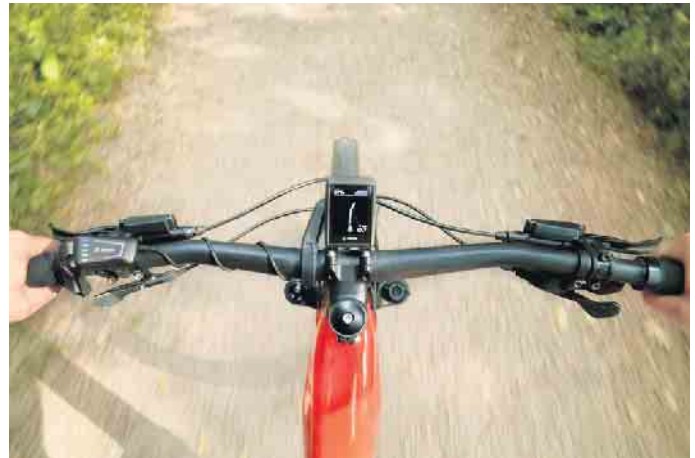
Am Display erkennen die E-Biker unter anderem, ob sie gerade über oder unter ihrer persönlichen Leistung und Trittfrequenz fahren.

sportlich bewegen und ihre Fitness verbessern möchten. Denn wer mit zusätzlicher elektrischer Unterstützung radelt, bringt mehr Bewegung in den Alltag - nicht nur bei Besorgun-