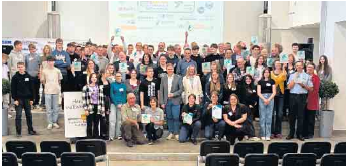
Große Freude bei der Schulgemeinschaft und Firmen/Institutionen.

Erfolgreiche Bewerbung der Realschule um das Prädikatssiegel für Unterstützung bei der Berufswahlorientierung