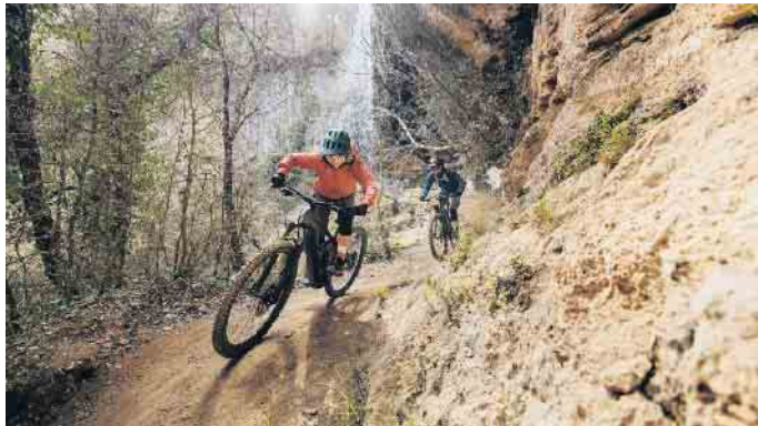
Das E-Bike ist das passende Trainingsgerät für alle, die gezielt ihre Fitness verbessern möchten.

So lässt sich das E-Bike als digitaler Trainer und Sportgerät nutzen