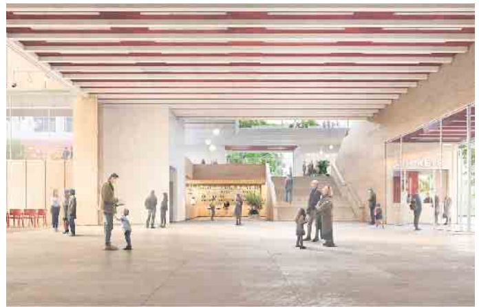
Diese Visualisierung zeigt die Innenansicht des Entwurfs für das neue City-Forum. Grafik: RIEHLE KOETH GmbH+Co. KG mit LEVIN MONSIGNY LANDSCHAFTSARCHITEKTEN GmbH

Alle 20 Wettbewerbsarbeiten werden im August, vom 9. bis zum 28. August, in der Stadtverwaltung in Euskirchen öffentlich, zu den Öffnungszeiten der Stadtverwaltung, ausgestellt.