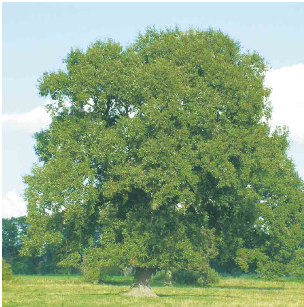
Auch große alte Baumriesen schätzen eine natürliche Vitalkur, um mit Umweltstress durch Luftverschmutzung oder steigende Temperaturen besser zurechtzukommen.

Vitale Kraft spendet die Behandlung aber nicht nur älteren Pflanzen, als Anwachshilfe bei Neuanpflanzungen oder Umpflanzungen leistet sie ebenfalls gute Dienste. Sie gibt Gehölzen optimale Startbedingungen und trägt so dazu bei, dass sich auch folgende Generationen an kräftigen, gesunden Bäumen erfreuen und von ihrem volkswirtschaftlichen Wert profitieren können. Und den taxiert der NABU für die 100-jährige Eiche auf mehr als 250.000 Euro - zum Beispiel für die Erhaltung der Bodenfruchtbarkeit, die Stabilisierung des Wasserhaushalts oder Schutzfunktionen gegen Wind, Lärm, Hitze oder Erosion. Die Bäume tun also einiges für uns Menschen - Zeit, dass wir ihnen etwas zurückgeben. (djd)