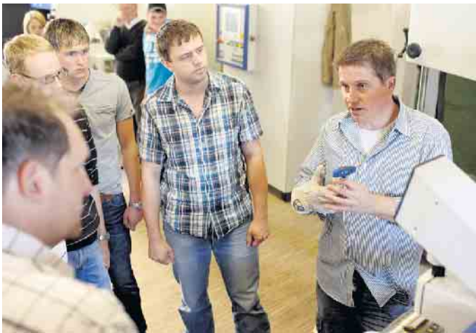
Nachhaltig die berufliche Zukunft gestalten: Rund um das Naturmaterial Holz bieten sich im Fachhandel viele Ausbildungschancen.

Eine Ausbildung im Holzfachhandel bietet attraktive Perspektiven