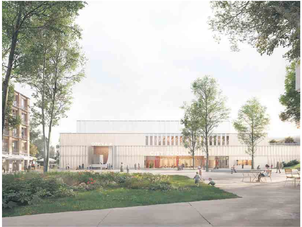
So stellt sich die erstplatzierte Arbeitsgemeinschaft das neue City-Forum von Euskirchen vor. Grafik: RIEHLE KOETH GmbH+Co. KG mit LEVIN MONSIGNY LANDSCHAFTSARCHITEKTEN GmbH

ben uns für einen Planungswettbewerb entschieden und erhoffen uns dadurch mehrere Dinge: Eine besondere Architektur für unsere neue Stadthalle und einen repräsentativen Platz zwischen dem neuen Rathaus und dem City-Forum sowie ein ansprechender Übergang zum Bahnhofsbereich. Damit das neue City-Forum und der Platz bestmöglich miteinander funktionieren, haben wir eine Zusammenarbeit von Architektur- und Landschaftsarchitekturbüros gewünscht.“ Eine hochkarätig besetzte Jury aus Fachleuten aus den Disziplinen Architektur und Landschaftsarchitektur sowie politischen Vertreterinnen und Vertretern der Stadt Euskirchen hat in der finalen Preisgerichtssitzung Ende Juni die Preisträgerinnen und Preisträger