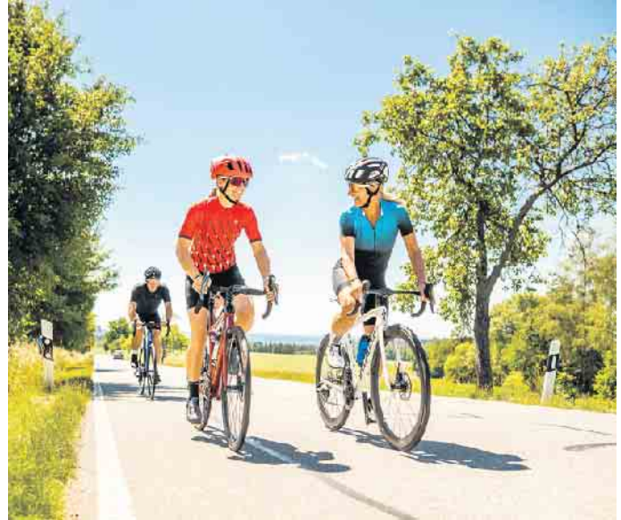
Alles Typsache: Für sportliches Fahren mit hoher Geschwindigkeit ist ein Rennrad das Richtige.

nachrüsten lassen: GPS-Tracker, Streckenmesser oder elektronischer Diebstahlschutz - Angebote gibt es etwa unter www.bike24.de . „Fahrräder und Zubehör werden immer smarter. Viele Funktionen lassen sich mit Apps auf der Uhr oder dem Handy verknüpfen“, so Martin-Birner. Seine Empfehlung für kaufwillige Fahrradfans: „Mit Blick auf die Nachhaltigkeit sollte man sich überlegen, ob das alte Rad nicht schon das richtige Fahrrad ist und mit passendem Zubehör wieder fit gemacht werden kann. Soll es doch ein neues sein, kann man an unseren Service-Points in Dresden und Berlin ein professionelles Bike Sizing mit Körpervermessung nutzen.“ Denn für das perfekte Radgefühl muss nicht nur der Typ, sondern auch die Größe stimmen. (DJD)