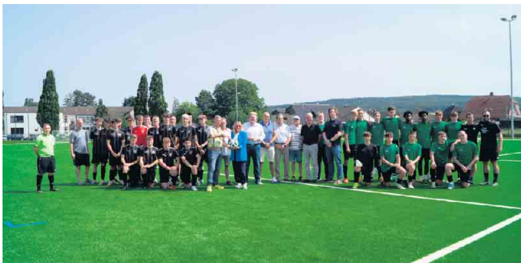
B-Jugend Mannschaften SV Nöthen-Pesch-Harzheim (in Schwarz) und SG Kirchheim-Arloff-Flamersheim (in grün) mit den Verantwortlichen der Veranstaltung in der Mitte