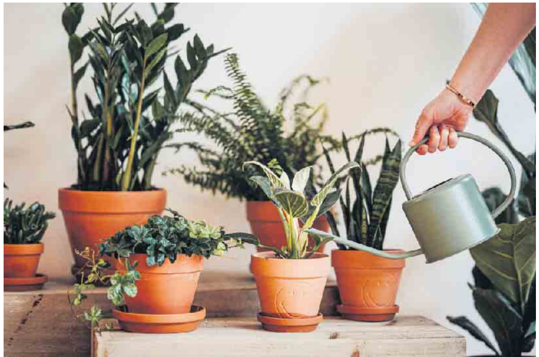
Von Zeit zu Zeit wässern und alle paar Monate an den passenden Nährstoffmix denken: Mehr Pflege brauchen pflegeleichte Zimmerpflanzen nicht.

Ob für die Küche, das Homeoffice oder den Flur: Robuste und pflegeleichte Vertreter aus der Pflanzenwelt verschönern unterschiedlichste Bereiche in der Wohnung, ohne dabei viel Arbeit zu verursachen. Die Glücksfeder zum Beispiel wird ihrem Namen gerecht, denn sie macht auch Pflanzenfreunde mit wenig Erfahrung glücklich: Sie braucht nur wenig Wasser und gedeiht überall bei Zimmertemperatur. Während es das Einblatt eher schattig, mit stets leicht feuchter Pflanzenerde mag, bevorzugt der Bogenhanf eher helle und sonnige Plätzchen. Zu den pflegeleichten Pflanzen, die quasi eine Wachstumsgarantie aufweisen, gehören ebenso Klassiker wie die kräftig rankende Efeutute oder der Gummibaum. Wichtig ist in jedem Fall eine gute, lockere Erde, damit die Wurzeln dauerhaft Luft bekommen. Gleichzeitig sollte die Erde genügend Wasser speichern oder nach Austrocknung das Wasser gut aufnehmen können. Praktisch sind Produkte wie die Floragard Aktiv Grünpflanzen- und Palmenerde, die Langzeitdünger enthalten, sodass für bis zu drei Monate nicht nachgedüngt werden muss.