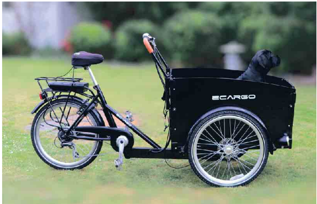
Grundsätzlich ist das Lastenrad eine sichere Methode, nicht nur Güter, sondern durchaus auch Kinder oder Tiere zu befördern.

Welche Bestimmungen sieht die Straßenverkehrsordnung vor? Ein Cargo-Bike mit Elektroantrieb bis 25 Stundenkilometer wird wie ein Fahrrad behandelt und gehört daher auf den Radweg, sofern dessen Nutzung vorgeschrieben ist. Alle E-Modelle, die schneller fahren können, müssen auf der Straße fahren. Eine Ausnahme zum verpflichtenden Fahrradweg ist nur vorgesehen, wenn das Rad zu breit ist oder die Qualität des Weges nicht zumutbar. Außerdem dürfen Lastenradfahrer auf dem Gehweg fahren, wenn sie unter Achtjährige begleiten. Wie nehmen mich andere Verkehrsteilnehmer wahr? Hier gilt es die Sichtbarkeit zu überprüfen; Reflektoren an Rad und Kleidung oder Fahnen zum Beispiel sorgen für Aufmerksamkeit. Aber es geht auch um das eigene vorausschauende Fahren: Da sich der Lastenkorb gewöhnlich in der Front befindet, schiebt dieser sich in den Verkehr, bevor der Radler den richtigen Einblick hat. Gleichzeitig ist der Korb so niedrig, dass andere Verkehrsteilnehmer das Gefährt erst spät wahrnehmen. Was darf transportiert werden und mit welchem Gewicht? Sachgüter, Tiere und Kinder sind als ‚Last‘ erlaubt; bei bestimmten Modellen auch Erwachsene. Wichtig: Das maximale Gesamtgewicht errechnet sich aus dem Eigengewicht des Rades sowie des Fahrers und aus dem Gewicht der Fracht und darf nicht überschritten werden. Es unterscheidet sich von Modell zu Modell; Auskunft gibt das CE-Zeichen auf dem Rad-Rahmen. (mid/ak-o)