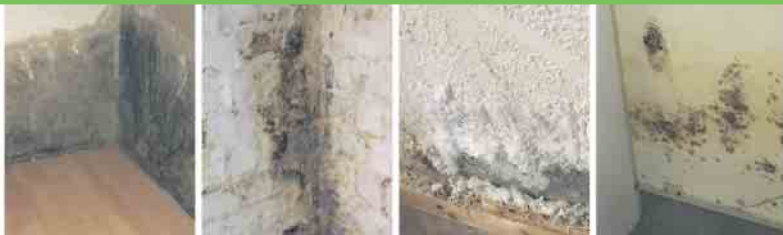
Defekte Horizontalsperre Querdurchfeuchtung Ausblühungen Schimmelbefall