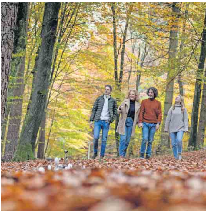
Wenn Angehörige das Baumgrab im Wald besuchen, geht es meistens nicht besonders förmlich zu.

Die Gleichheit in der Grabgestaltung führt aber nicht dazu, dass man keine Individualität erlebt - im Gegenteil. Jedes Baumgrab ist von Natur aus anders. Und auch die Beisetzungen und Gedenkmöglichkeiten können ganz persönlich geprägt werden. (DJD)