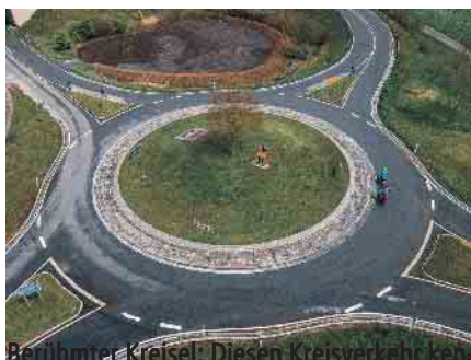
Berühmter Kreisel: Diesen Kreisverkehr kennen TV-Zuschauer aus den Eberhofer-Krimis.

In einem zweistreifigen Kreisverkehr sollte man sich rechts halten, wenn man bei der nächsten oder übernächsten Ausfahrt wieder ausfahren will. Wer die innere Kreisspur wählt, muss beim Verlassen den Vorrang des Außenfahrenden beachten und notfalls eine Extrarunde drehen.