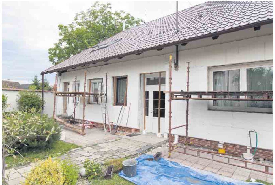
Für die Planung und Ausführung von Modernisierungen empfiehlt es sich, unabhängigen sachverständigen Rat einzuholen.

Unabhängige Bauherrenberater vom Bauherren-Schutzbund e.V. können Hausbesitzer dabei umfassend unterstützen. In einer Hausbegehung lässt sich der Modernisierungsbedarf ermitteln. Auf dieser Basis kann der sachverständige Berater einen Sanierungsfahrplan erstellen und künftige Modernisierungen sinnvoll koordinieren. Bei knappem Budget kann eine Priorisierung der Maßnahmen erfolgen, die am schnellsten einen hohen Nutzen bringen, sowie eine langfristige Planung für Arbeiten, die noch in die Zukunft verschoben werden können. Unter www.bsb-ev.de gibt