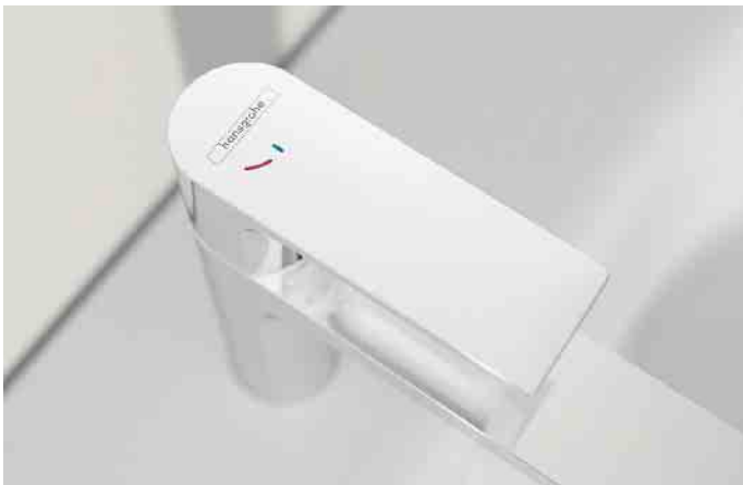
Wasserspar-Kartuschen in Einhebelmischern bewirken einen Widerstand im Hebelweg, der verhindert, dass der Hebel gleich bis zum Anschlag öffnet und mehr Wasser fließt als nötig.

bessere Hygiene und Reinigungsfreundlichkeit der Armatur. In den Fachausstellungen des Großhandels und beim SHK-Fachhandwerk sind viele weitere Ideen rund ums Energiesparen im