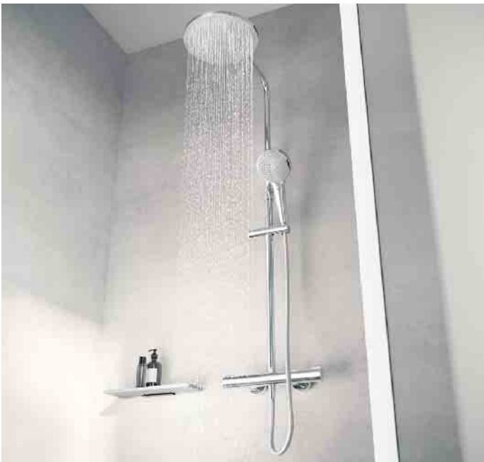
Thermostatarmaturen für Duschen helfen Energie zu sparen: An ihnen werden Höchst- und Durchschnittstemperatur des Wassers festgelegt, die dank des eingebauten Messfühlers konstant gehalten werden.