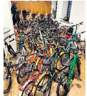
43 mal Freude!

Nicht vergessen möchten wir die evangelische Kirchengemeinde Eitorf, die auch dieses Mal wieder ihre Räumlichkeiten zur Verfügung gestellt hat und somit eine reibungslose Organisation ermöglichte.