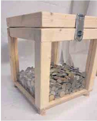
Abb. Coins - Sammelbox

Lokale Firma unterstützt soziale und kulturelle Einrichtungen vor Ort