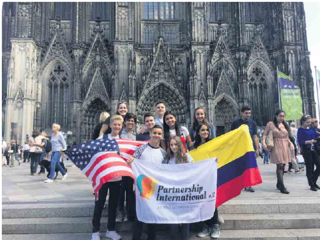
Alle Jugendlichen, die ihren Schüleraustausch in Deutschland verbringen, erhalten ein Vorbereitungsseminar in Deutschland, auf dem sie auf ihren Aufenthalt vorbereitet werden.

„In der Vergangenheit haben bereits Seniorinnen und Senioren, Regenbogenfamilien, Single-Mütter und -Väter sowie Paare mit und ohne Kindern, aus allen Ecken