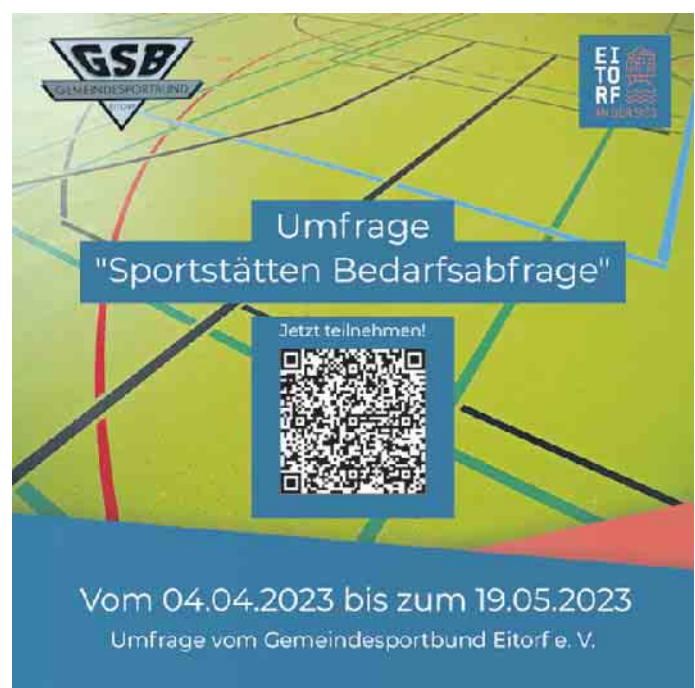
Die Umfrage zum Sport und den Sportstätten in Eitorf