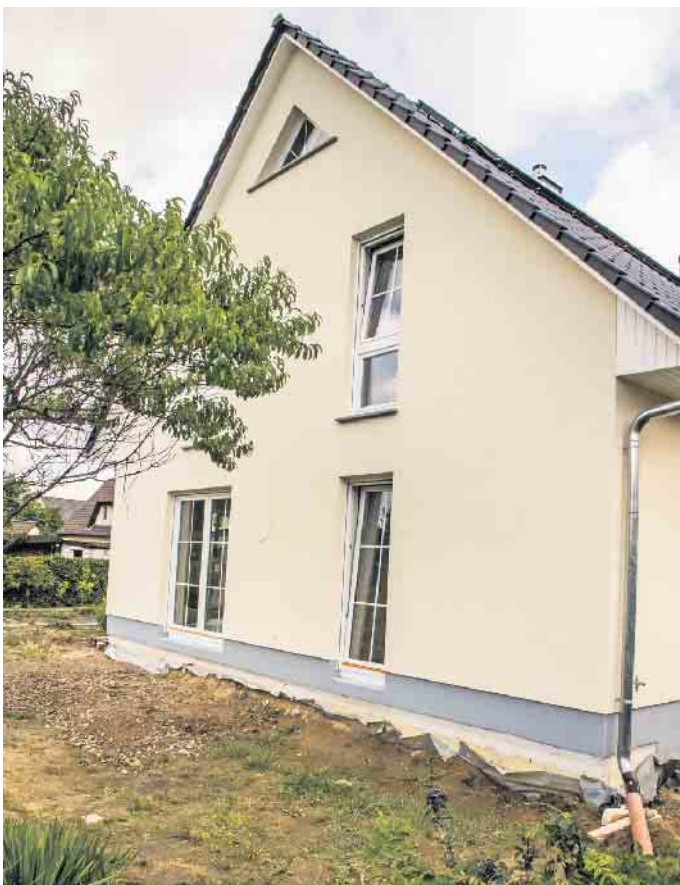
Das aktuelle BSB-Bauherrenbarometer zeigt: Die Möglichkeiten, Wohneigentum zu bauen oder zu erwerben, werden von den deutschen Verbrauchern überwiegend pessimistisch eingeschätzt.

der Traum von den eigenen vier Wänden auch in Zukunft für Familien mit durchschnittlichem Einkommen erreichbar bleibt. Bauherren, die auf der Suche nach einem gangbaren Weg ins Wohneigentum sind, finden auf der Website des Vereins unter www.bsb-ev.de eine Vielzahl von Hintergrundinfos zum Bauen und Kaufen. Sie können sich zudem unabhängig bei der Planung und Umsetzung ihrer Immobilienpläne beraten lassen. (djd)