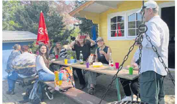
Ausflug nach Eckenhagen

Seit vielen Jahren darf der AWO Ortsverein die Räumlichkeiten des Sozialpsychiatrischen Zentrums (SPZ) des Kreisverbandes unentgeltlich für Vorstandssitzungen oder ähnliches nutzen. Als kleines Dankeschön für dieses Entge-