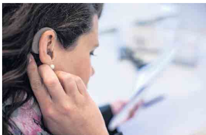
Hörbeeinträchtigungen können das Arbeitsleben erschweren - doch dafür gibt es Lösungen.

„Eine der wichtigsten Voraussetzungen, damit Menschen mit Behinderung ihre Stärken auf dem