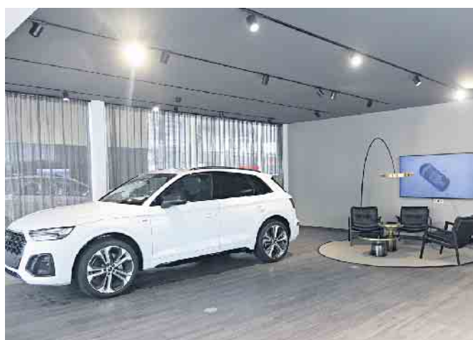
Der Übergabebereich für das neue AUDI Fahrzeug