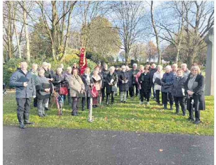
Der Eitorfer Gesangverein untermalte die Gedenkfeier zum Volkstrauertag 2023.

Kranz am Ehrenmal auf dem Eitorfer Friedhof nieder. Unser Chor der anlässlich seines diesjährigen 150-jährigen Vereinsjubiläum in diesem Jahr die musikalische Gestaltung übernommen hatte, sang erstmalig unter Leitung von Karsten Rentzsch die Stücke: Näher mein Gott zu mir (Franzdorfer), O Herr, gib Frieden (Klaus Siefert) und Das Morgenrot (Robert Pracht). Ein Zeichen des Friedens kann es auch sein, dass wir am 2. Dezember unsere ukrainischen Sangesbrüder der Don Kosaken zu uns nach Eitorf eingeladen haben. Denn nichts verbindet in diesen Zeiten mehr, als der Gesang. Wir erlauben uns auf diesem Wege darauf hinzuweisen, dass nur noch Restkarten für das Konzert erhältlich sind und nach jetzigem Stand voraussichtlich keine Abendkasse angeboten