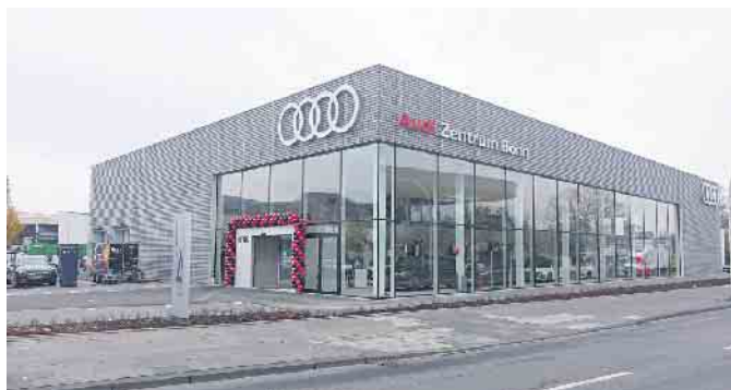
Straßenansicht des neuen AUDI Zentrums an der Bornheimer Str. 222 in Bonn

Das Traditionsunternehmen Fleischhauer-Franz hat am 17. November sein neues, dreigeschossiges AUDI Zentrum am Standort Bonn in der Bornheimer Str. 222 eröffnet.