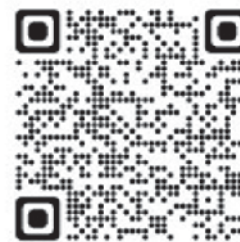
QR-Code Wahl Stellv. Schiedsperson

über das Serviceportal der Gemeinde Eitorf ( www.serviceportal.eitorf.de ) unter Schiedsamt heruntergeladen werden.