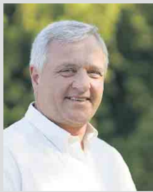
Bürgermeister Rainer Viehof