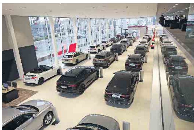
Die großzügige Ausstellungsfläche im Bonner AUDI Zentrum rückt die neuen AUDI Modelle ins rechte Licht.