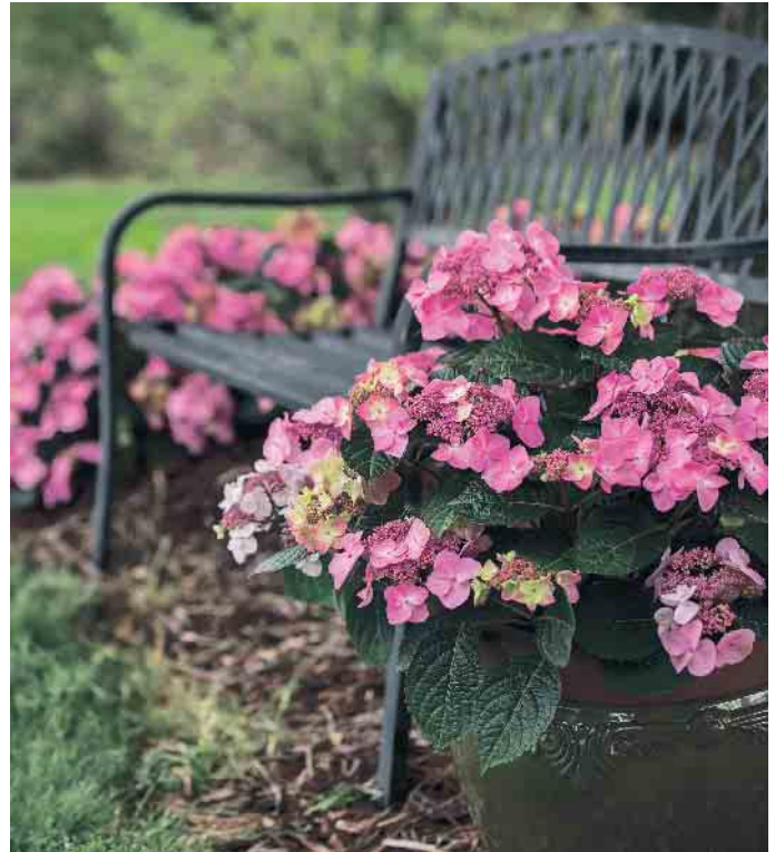
Die neue Tellerhortensie „Pop Star“ macht auch im Kübel eine gute Figur.

Hortensien fühlen sich im Halbschatten am wohlsten und bevorzugen einen leicht sauren, lehmig-humosen Boden, der die Feuchtigkeit gut hält. Das Pflanzloch zweibis dreimal so groß wie den Ballen ausheben, der nur feucht und bodeneben eingesetzt werden darf. Durch das Lockern der Ränder und der Sohle des Pflanzloches wird Staunässe verhindert und gleichzeitig können die flachen Wurzeln leichter in den Boden einwachsen. Anschließend das Pflanzloch mit Erde auffüllen, um die Pflanze herum leicht antreten und einen etwa 10 Zentimeter hohen Gießrand anhäufeln. (akz-o)