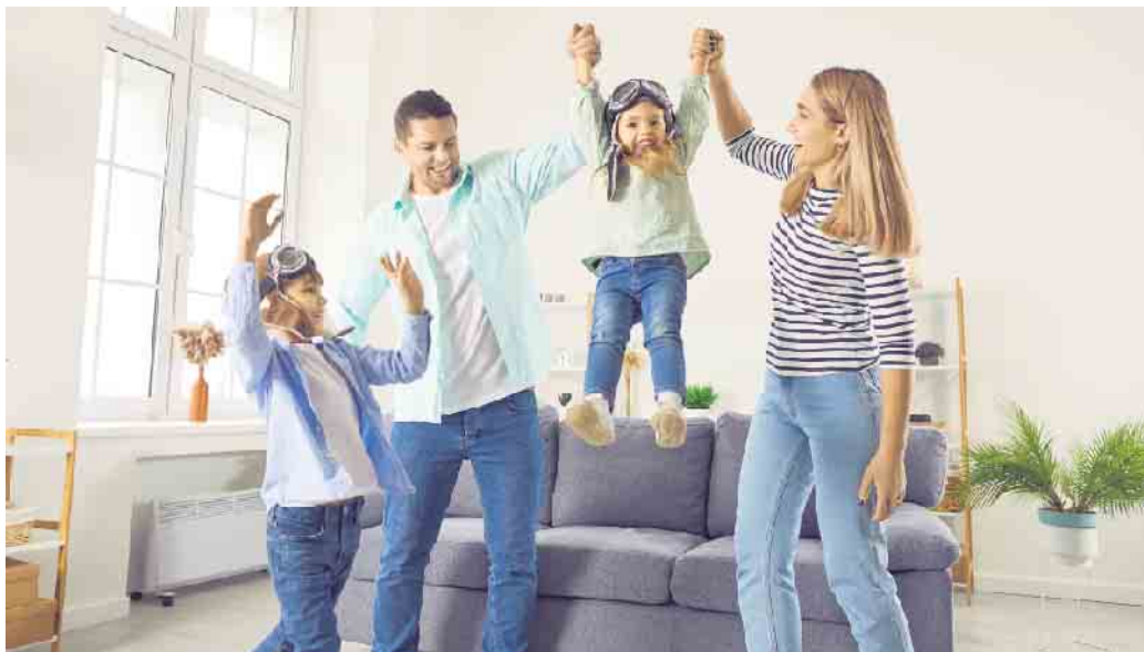
Mehr Lebensluft mit gesunder Raumluft: Lüftungsanlagen führen Schadstoffe zuverlässig ab und halten dank Filtertechnik Pollen und Feinstaub draußen.

Bei der Initiative „Gute Luft“ unter www.wohnungs-lueftung.de gibt es mehr Informationen zu den verschiedensten Lüftungslösungen für nahezu jedes Wohngebäude. Sie eignen sich für den Neu-