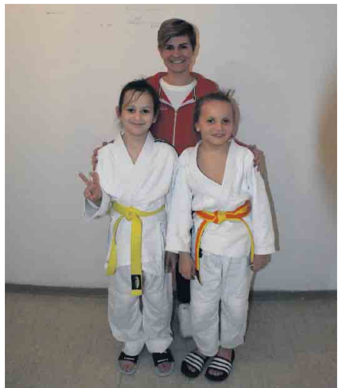
Jungs U 11

Herzlichen Glückwunsch zu den tollen Leistungen!