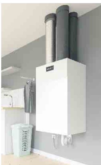
Lüftungsanlagen können sowohl im Neubau als auch nachträglich installiert werden. Für Anlagen mit Wärmerückgewinnung gibt es eine staatliche Förderung.

Im Vergleich zum manuellen Lüften sind Lüftungsanlagen mit Wärmerückgewinnung zudem energieeffizient und senken die Heizkosten. (DJD)