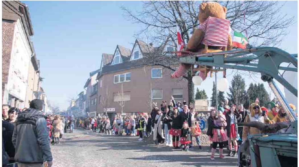
Nur sehr langsam und mit viel Vorsicht bahnten sich die Großwagen ihren Weg durch die belebten Straßen.

wagen, die eigentlich nur durch ihren Geräuschpegel auffallen. Das auch Großwagen aufwändig gestaltet sein können, zeigten zum Beispiel die „Fleischlosen“, die sich mit Matrosenkostümen schon auf „Elsdorf am See“ einstimmten und wieder fleißig Kohlköpfe verteilten oder der über und über mit bunten Blumen bemalte Wagen der fleißigen Bienchen. Den Abschluss des Zuges bildeten wie immer die Wagen der Gesellschaft und des Dreigestirns mit Gefolge, begleitet vom Musik- und Tanzkops der KG Fidelio. Die Elsdorfer standen an vielen Stellen dichtgedrängt am Straßenrand und jubelten begeistert. Viele der Jecken erzielten reiche Kammelle-Ausbeute. (mos)