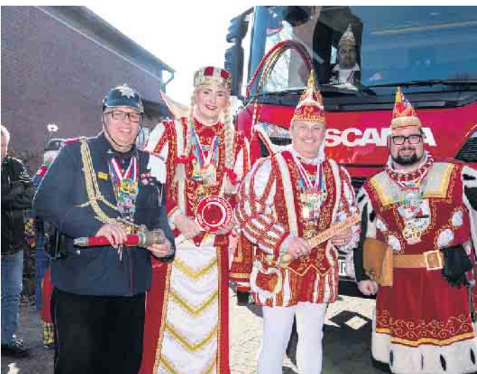
Das Dreigestirn beim Zug in Neu-Etzweiler