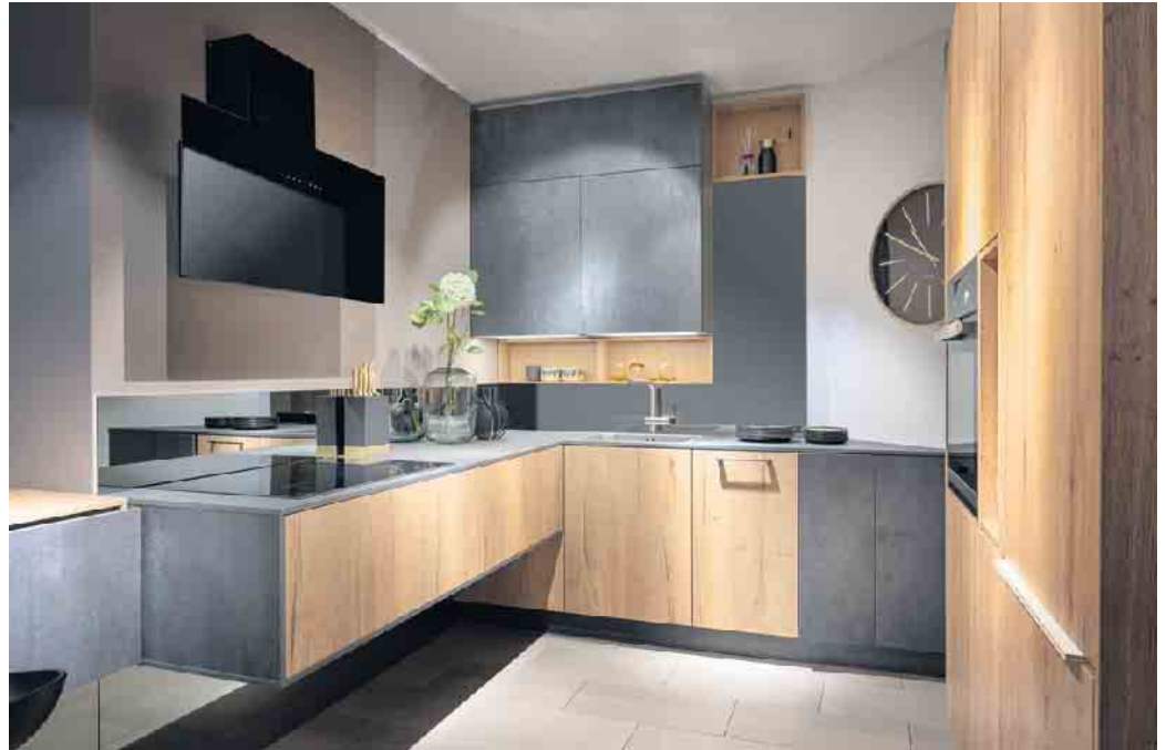
Viel Raum zum Verstauen bietet diese kleinere Lifestyle-Küche in trendiger Spachtelbeton-Optik kombiniert mit Alteiche (Dekor). Durch die raffinierte Planung entsteht eine Atmosphäre von Weite und Großzügigkeit.

Am Anfang steht das exakte Aufmaß. Dabei haben die Küchenspezialisten gerade bei kleinen Grundrissen alle Optionen im Blick, die Wände, Nischen/Ecken und die Decke bieten. Denn wo es an Grundfläche fehlt, wird in die Höhe geplant - mit Hilfe von Hoch-, Hängeschränken und Regalsystemen. Damit man später an seine verstauten Inhalte in luftiger Höhe auch bequem herankommt, gibt es zum Beispiel innovative Auszugssysteme. Damit zieht man das Staugut elegant auf die gewünschte Höhe zu sich heran. Oder Teleskopregale, die per Fernbedienung aus