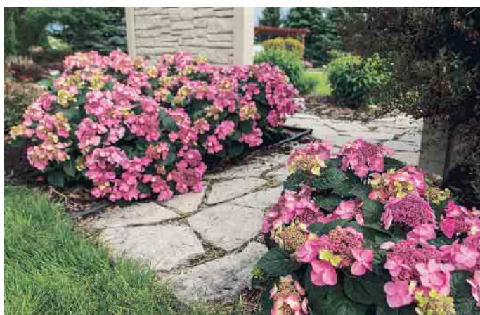
Hortensien gehören zu den Gartenklassikern: Sie sind zeitlos, modern und gleichzeitig anmutig-nostalgisch.