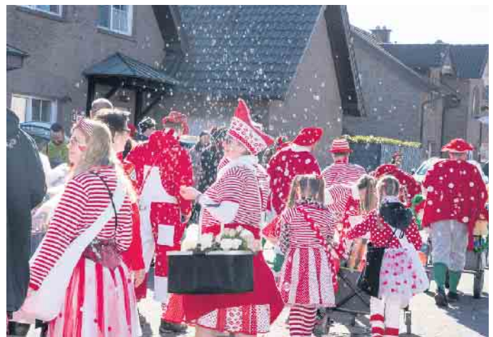
Impressionen vom Karnevalszug in Neu-Etzweiler am Rosenmontag