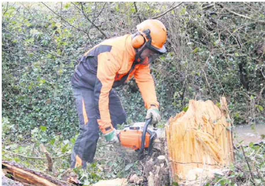
Mitarbeiter des Erftverbandes bei Gehölzarbeiten. Foto: Erftverband. Foto: Erftverband

Obwohl der Großteil der Arbeiten bewusst in den Zeitraum zwischen dem 1. Oktober und dem 28. Februar gelegt wird, lassen sich bestimmte Maßnahmen nicht auf den Winter beschränken. Dazu zählen etwa starke Rückschnitte, Kroneneinkürzungen oder - falls erforderlich - Baumfällungen. Die Dringlichkeit richtet sich stets nach dem Standort, dem Gefahrenpotenzial sowie dem