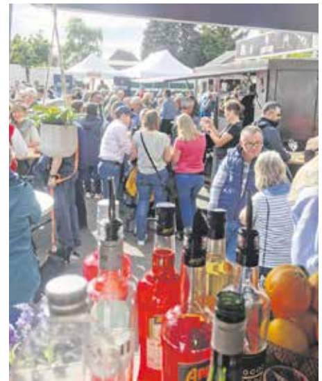
Der beliebte Elsdorfer Feierabend-Markt sorgt für Marktplatz-Atmosphäre mitten in der Stadt.

einem eigenen Food-Truck am Markt teilnehmen möchten, können sich unter kultur@elsdorf.de oder 02274 709 - 133 an die Stadt Elsdorf wenden.