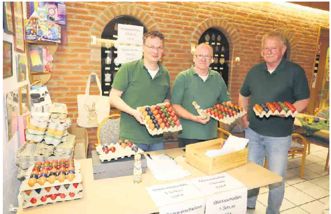
Tradition seit Jahren: Ostereierschießen in Nörvenich gestartet - genügend Eier vorhanden