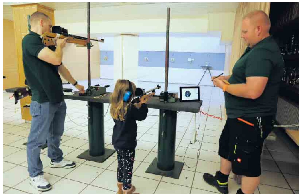
Um es gleich vorneweg zu sagen: Beim Ostereierschießen wurde nicht AUF Ostereier geschossen, sondern UM

Glückschießen wartete mit tollen Sachpreisen auf die Gewinner, darunter Eierlikör vom Heidefelder Hof in Oberbolheim. Apropos Eier: Mitte März hatte