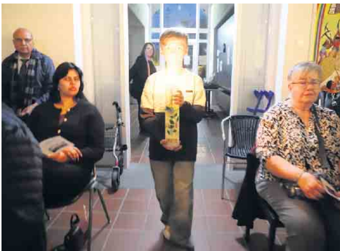
Nach dem Hereintragen der Osterkerze steigerte sich die Festlichkeit