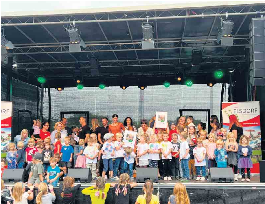
Im Vorjahr gewann die Kita „Haus der kleinen und großen Leute“ den westenergie-Klimaschutzpreis mit einem kindgerechten Projekt zu nachhaltigen Lebensmitteln.

Stadt Elsdorf und westenergie zeichnen erneut Engagement zum Klimaschutz aus