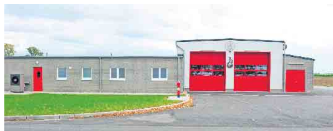
Zum ersten Mal im neuen Feuerwehr-Gerätehaus in Grouven feiert die Grouvener Wehr

ANZEIGEN · PROSPEKTEVERTEILUNG DRUCKE · WEB-AUFTRITTE · FILM