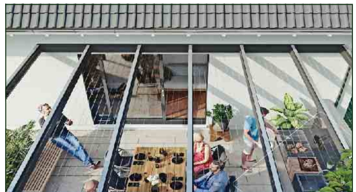
STEGPLATTEN FÜR TERRASSENDÄCHER UND WINTERGÄRTEN

Fassadenfarben setzen markante Akzente und bieten oft weitere Funktionen, wie den Schutz vor dem Ausbleichen oder Aufheizen der Fassade durch die Sonne.