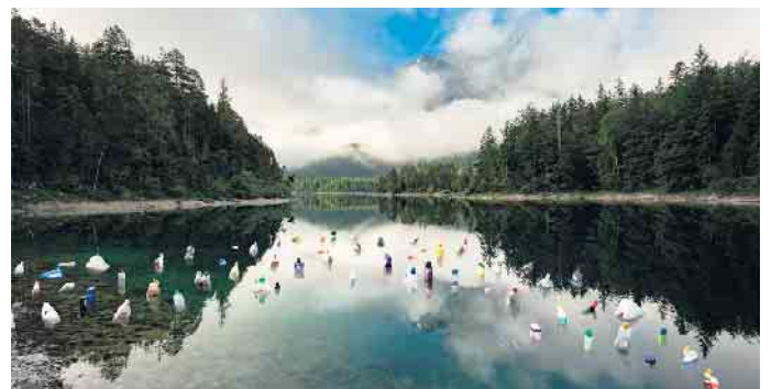
Lake Bottles.

tieren. Der Künstler nutzt dazu das Beispiel Plastikmüll, in dem er damit Fotoinstallationen auf den Balearen, in der Eifel und auf Island entwickelt hat. Für diese Reihe wurde ihm 2019 der Staatspreis NRW Medien verliehen. www.dirk-kruell.de