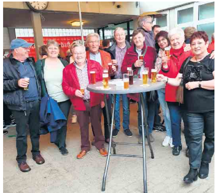
Freunde und Gäste feierten mit Freude