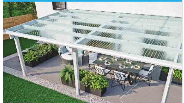
LICHTPLATTEN AUS PC + PMMA + PVC