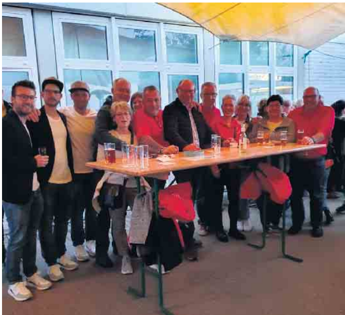
In gemütlicher Runde.

Die Dorfgemeinschaft Esch bedankt bei allen Besucher und Gästen für ein schönes Maifest und bei allen Spender für die eingegangenen Spenden. Dorfgemeinschaft Esch e.V.