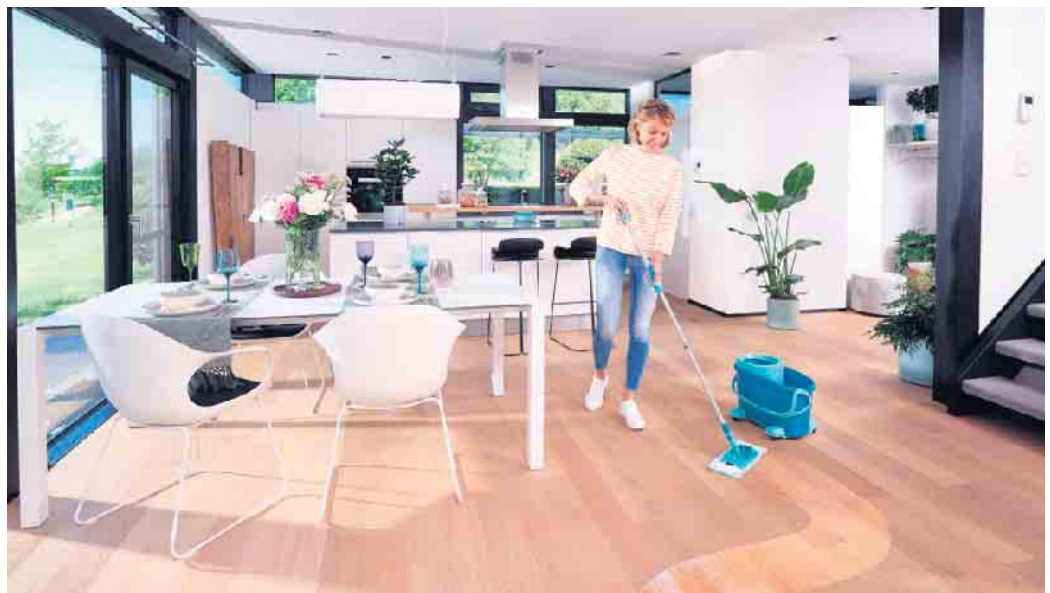
Verschmutzungen finden keinen Halt auf der glatten Holzoberfläche.

Der Verband der Deutschen Parkettindustrie e.V. (vdp) wurde 1950 in Wiesbaden gegründet. Seit 2006 befindet sich die Geschäftsstelle in Bad Honnef. Zurzeit sind 17 Parkett-Hersteller im vdp organisiert, die mehr als 90 Prozent der deutschen Parkettproduktion repräsentieren. Auf seiner Webseite www.parkett.de informiert der vdp Fachleute und Endverbraucher über alles Wissenswerte rund um das Parkett.