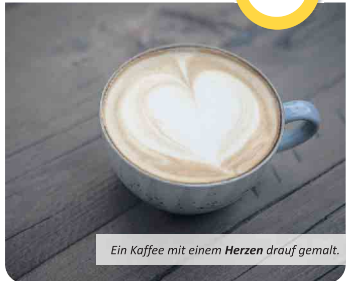
Ein Kaffee mit einem Herzen drauf gemalt.