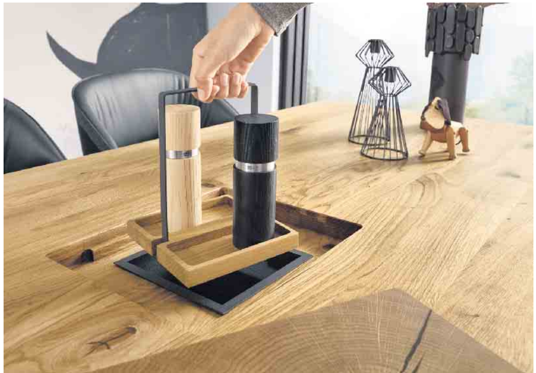
Die Wuchsbedingungen, das Klima, die Nährstoffversorgung sowie die Umwelteinflüsse haben maßgeblich Einfluss auf das Aussehen der Hölzer. IPM/Wimmer Wohnkollektionen

Die Wuchsbedingungen eines Baumes spiegeln sich auch in den Jahresringen wider. Wie der Name schon sagt, wächst ein Baum von Jahr zu Jahr - und je nach Witterungsbedingungen fallen die Jahresringe dann größer oder kleiner aus. Je breiter ein Jahrring ist, desto sonniger und nährstoffreicher war das Wetter im jeweiligen Jahr. „Da die Natur nie eine