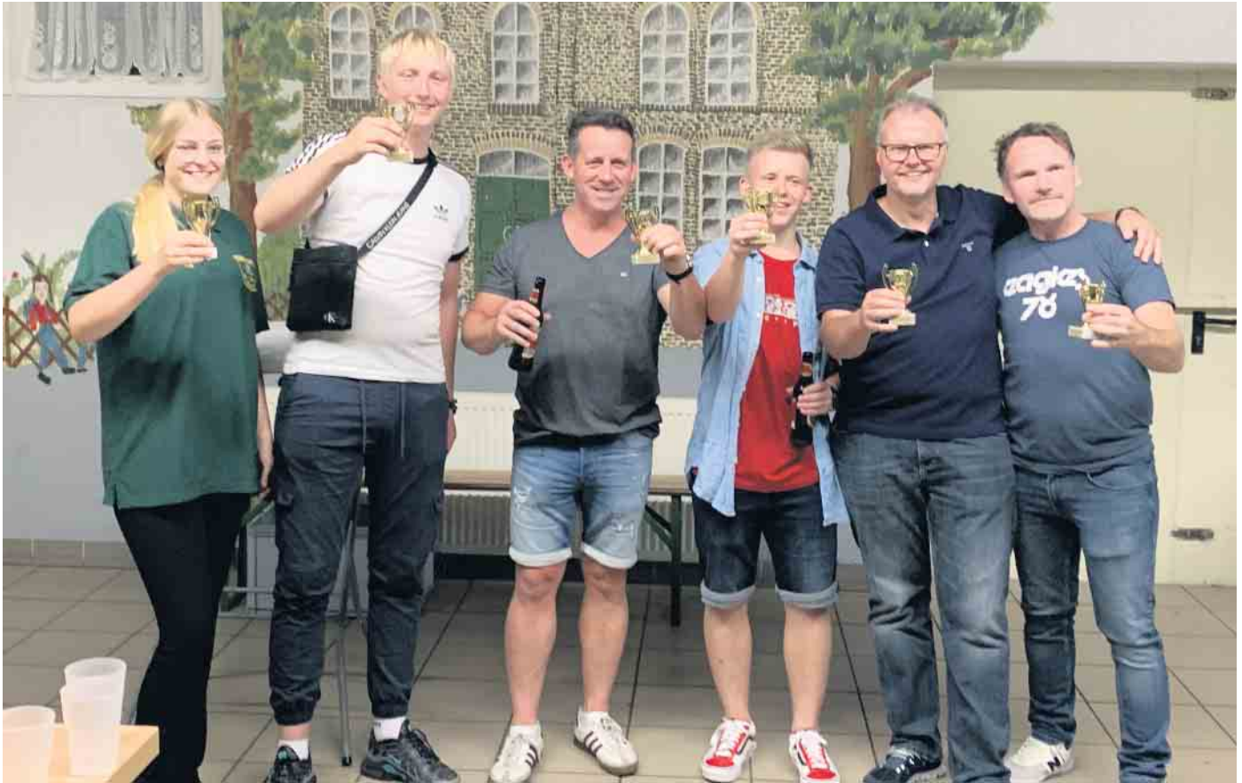
Bierpong-Meister Newcomer (rechts) vor Team Duck-Sauce (links) und Effzeh Süd