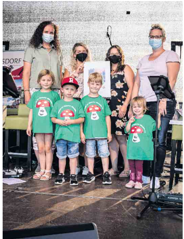
Die Elsdorfer „Glückspilze“ gehörten 2021 zu den drei Preisträgern.

Der Preis wird in den Städten und Gemeinden jährlich ausgelobt und ist je nach Größe der Kommune mit bis zu 5.000 Euro dotiert. Welche Projekte gefördert werden, entscheidet eine Jury mit Vertretern aus der Kommune und von