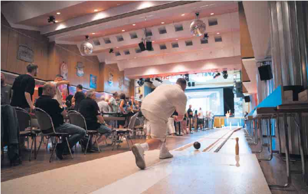
Vor großer Kulisse wurden die Finals in der Elsdorfer Festhalle ausgetragen.

KC „Voll dropp“ holt den Titel als Stadtmeister - Finale wurde vor 300 Zuschauern in der Festhalle ausgespielt