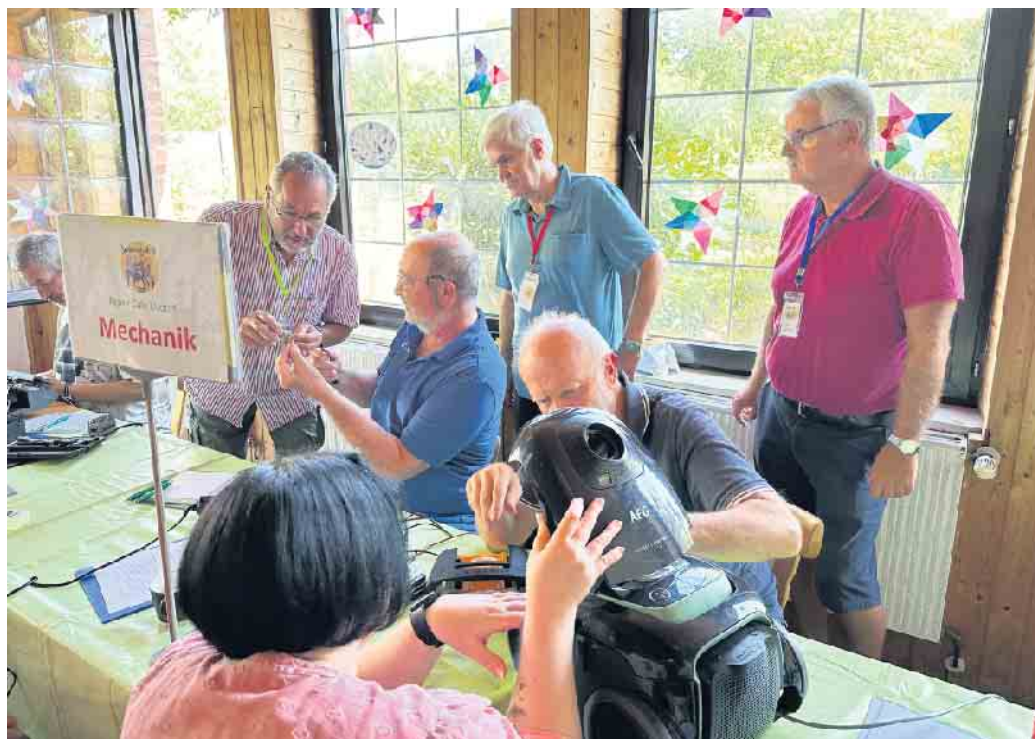
Das Elsdorfer Repair-Café erfreut sich großer Beliebtheit und ist nur eines der vielfältigen Projekte des Seniorenbeirats.

Darüber hinaus ist der Beirat in zahlreichen Netzwerken aktiv,