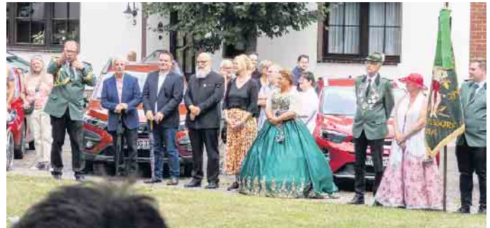
Abschluss des Festzuges

Die Feierlichkeiten am Sonntag begannen jedoch zunächst mit dem traditionellen Wecken und anschließendem gemeinsamen Frühstück. Der Festzug mit den Bruderschaften, Ortsvereinen aus Tollhausen und Esch sowie Vertretern der Politik lockte viele Zuschauer. Für die musikalische Begleitung sorgten dabei gleich drei Musikvereine - Blau-Weiß Quadrath-Ichendorf, TC Einigkeit Berrendorf-Wüllenrath, Spiel-