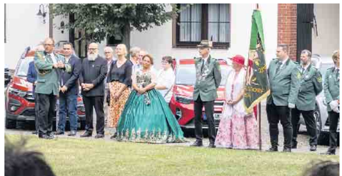
Abschluss des Festzuges

freunde Angelsdorf. Im Anschluss an den Festzug lockte die Cafeteria mit vielen selbstgebackenen Kuchen und der Musikverein Blau-Weiß Quadrath-Ichendorf unterhielt die vielen Gäste mit einem Platzkonzert.