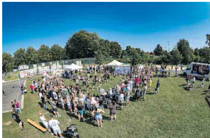
Am 15. August wird der Sport- & Bewegungspark zum Open-Air-Kino.

Organisiert wird der Kino-Tag von der offenen Jugendarbeit (Brause) sowie der Kulturabteilung der Stadt Elsdorf. Vor Ort steht ein Imbisswagen mit Getränkeverkauf bereit. Sitzplätze und Tische sind in begrenzter Anzahl vorhanden. Daher können eigene Sitzgelegenheiten / Decken gerne mitgebracht werden.