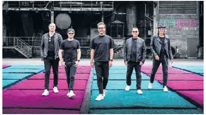
Die Räuber spielen am 30. August um 16:30 Uhr auf der westenergie-Bühne an der Festhalle.

Pumptrack-Bahn sowie eine 23-Meter-lange und 4-Meter-Hohe Kletterwand erweitert, welche das vielfältige Angebot ergänzen. Mitten im Park bietet die „ELSDORF-Bühne“ viele weitere Showauftritte u.a. mit Kindertanzgruppen aus ei-nigen Karnevalsgesellschaften. Kulinarisch wird zum Stadtfest ebenfalls ein breit gefächertes Angebot geboten. Unweit der Hauptbühne auf dem Festhallen-Parkplatz erstreckt sich die Food-Area. Von klassisch Currywurst, Pommes, Bratwurst (auch vegan), Krakauer über Paella, Döner, Piz-za, Burger, Cevapcici, Crepes bis hin zu indisch-sri-lankischer Kü-che -das Angebot lässt fast keine Wünsche offen. Neben Kölsch, Cola, Wasser und Co. wartet auf alle Besucher auch eine Cocktail- & Wein-Bar. Erneut dabei ist die beliebte „2good“-Bar mit spannenden Cocktail-Krea-tionen und Shots in der Be-achlounge. Zwischen Sand und Lie-gestühlen präsentiert sich auch