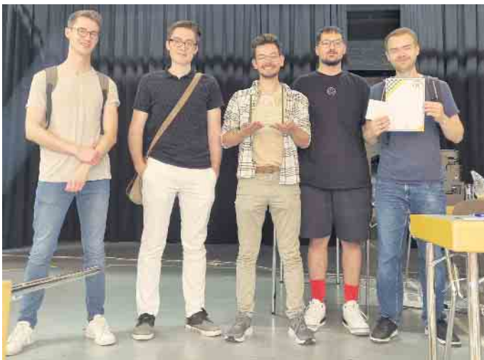
Siegermannschaft des Brötchenturniers.

In diesem Jahr richtete der Schachverein Erftstadt wieder sein traditionelles Brötchenturnier aus, das 40. insgesamt seit 1981. Wegen der Corona-Pandemie wurde dieses Turnier in den Jahren von 2020 bis 2022 abgesagt. Im Vorfeld gab es viele Nachfragen, ob es nun endlich weitergeht. Es ging weiter.