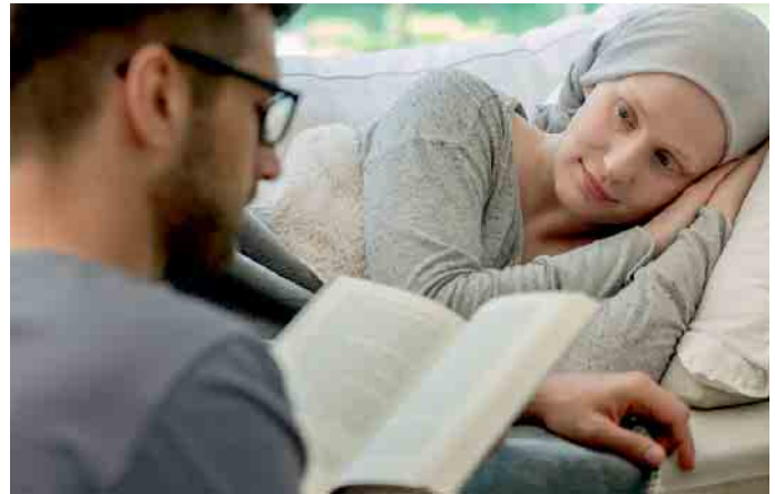
Bei der Hospizarbeit geht es darum, sterbenskranken Menschen Zuwendung zu schenken - beispielsweise, indem man ihnen vorliest.

Die Begriffe „Hospiz“ und „Palliativversorgung“ haben die meisten Menschen zwar schon einmal gehört. Doch was sich genau dahinter verbirgt, wissen viele nicht. Dabei möchten wir alle bei schwerer Krankheit und in der Zeit vor unserem Tod würdevoll begleitet und gut versorgt werden. Was gehört also alles zur Hospizarbeit und Palliativversorgung?