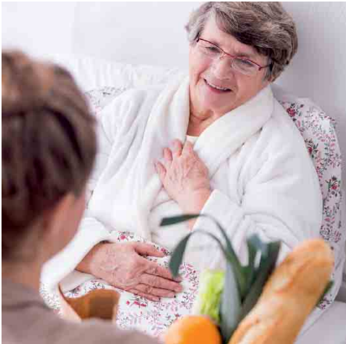
Hospizbegleiterinnen und -begleiter kümmern sich um sterbenskranke Menschen und entlasten die Angehörigen.