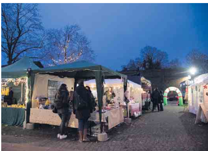
Lichterketten und Aussteller von Kunsthandwerk verliehen dem Weihnachtsmarkt Oberembt Ambiente