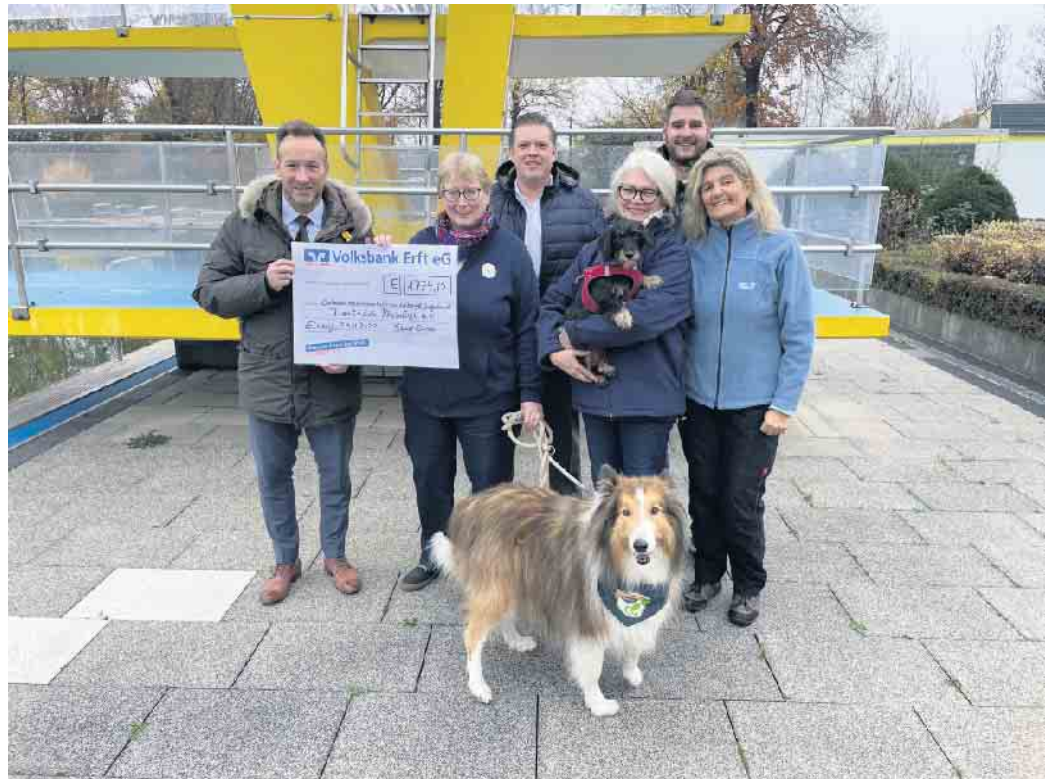
Auch Collie Jack war - wie bereits im vergangenen Jahr - mit von der Partie