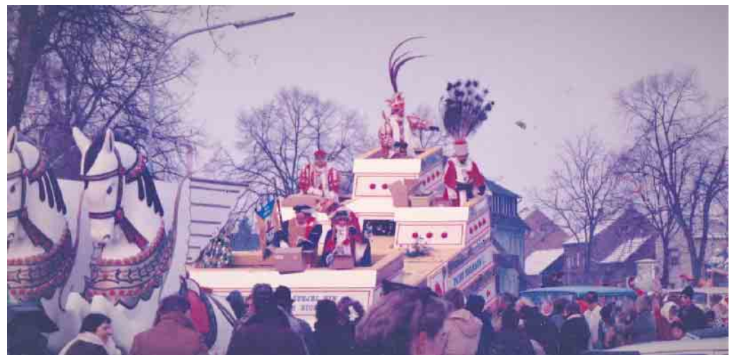
Nostalgiebild des „Eiszuges“ von 1986 bei -14 Grad.