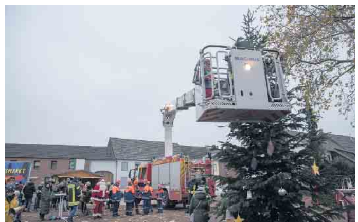
Auch die Kinder hatten keinerlei Scheu, in den Korb zu steigen und sich von der Feuerwehr bis an die Spitze des Baumes liften zu lassen.