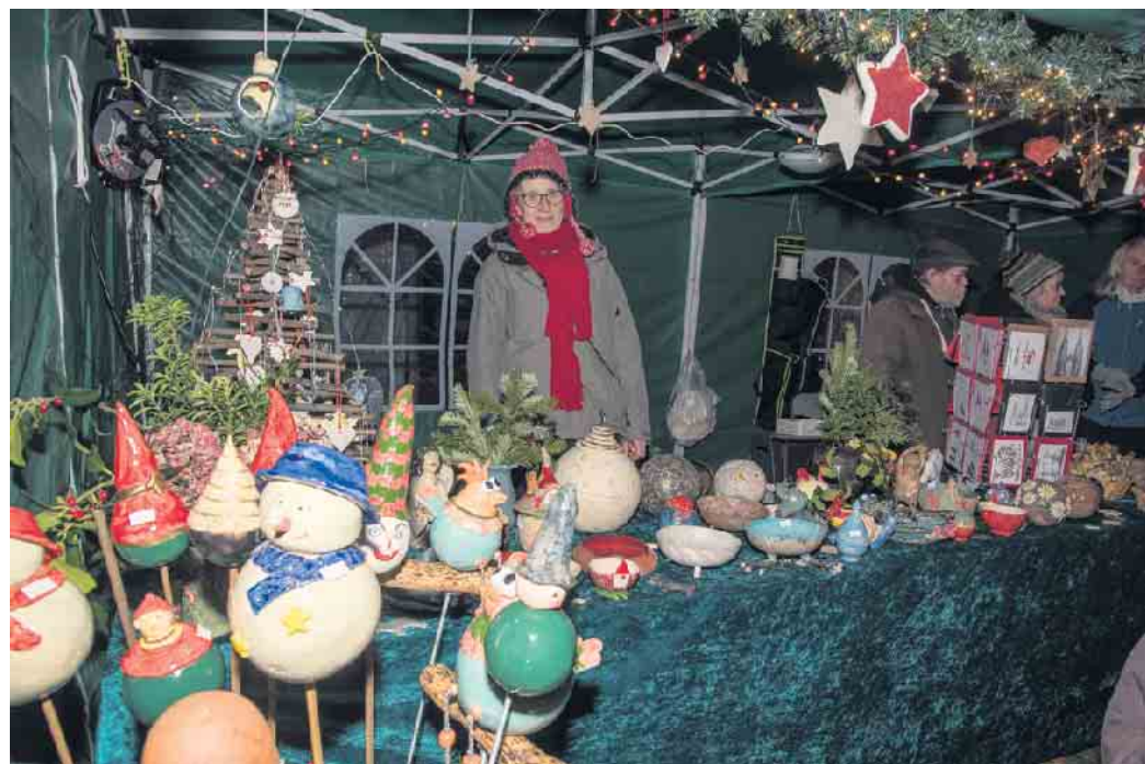
Zwei Töpferinnen aus Oberembt präsentierten ihre Werke