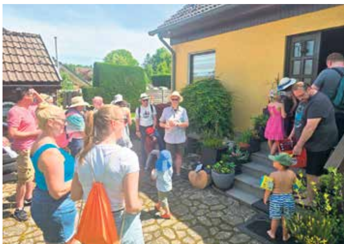
Pfingsteiersänger vor einem Haus.

erholt, sind im Ort die Pfingsteiersänger mit toll geschmückten Bolterwagen unterwegs. Sie kehren an jeder Türe ein und singen ihr Traditionslied „Wir treten hier vor dieses Haus dilundei,.... Eier müssen sein.“ Ihr Gesang wurde mit Eiern, Geldspenden und auch mit dem einen oder anderen Schnäpschen belohnt.