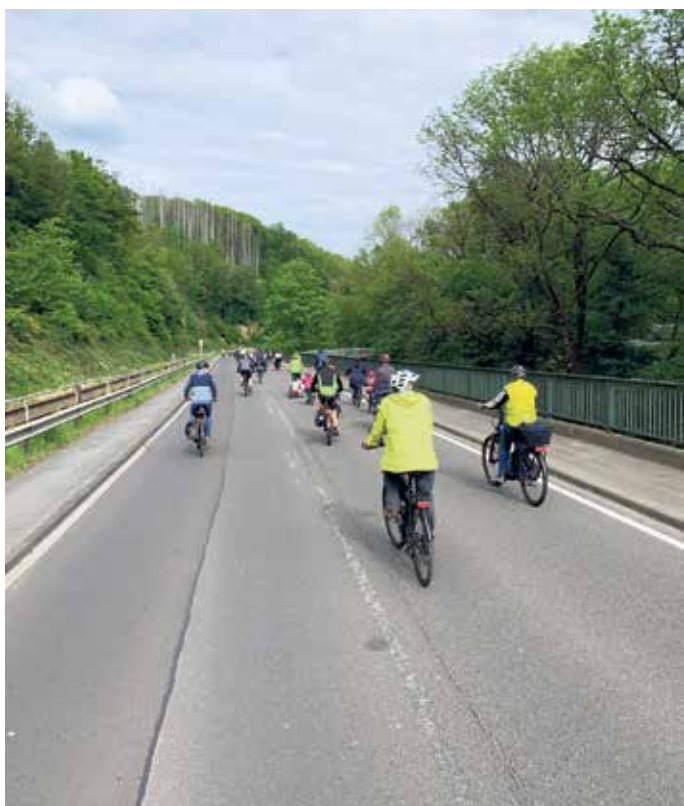
Fahrraddemo auf dem Weg nach Büchlerhausen