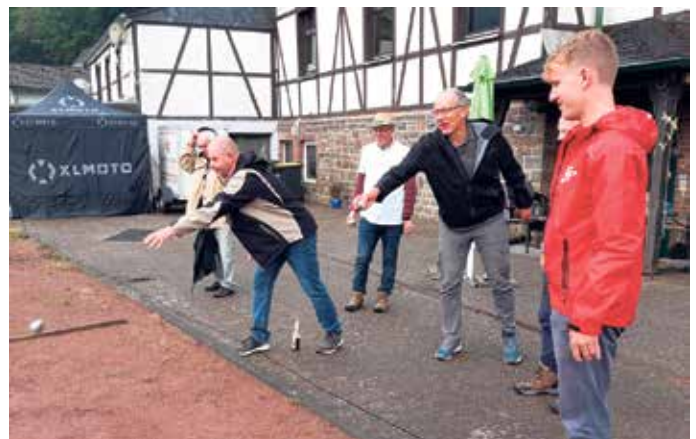
Neben Musik und Getränken gibt es an der Turnhalle viele Mitmachaktionen, wie eine Partie Boule.

Die Veranstalter freuen sich auf zahlreiche Besucherinnen und Besucher aus Bickenbach, Engelskirchen und der gesamten Region. Das Dorffest ist eine gute Gelegenheit, Nachbarn zu treffen und neue Kontakte zu knüpfen.