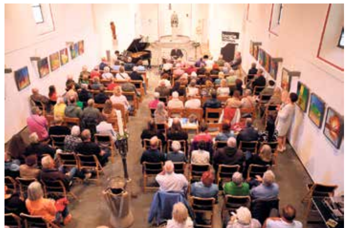
Kultur im voll besetzten Gotteshaus