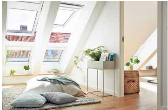
Glas schafft Licht, Raumbeziehungen und visuelle Offenheit.

Der Trend bei Glaselementen geht über reine Effizienz hinaus zu einer ganzheitlichen Betrachtung ihres Lebenszyklus: Wie wirkt ein Bauteil über Jahrzehnte? Wie lassen sie sich Ressourcen schonend wiederverwenden oder recyceln? Hochwertige Verglasungen punkten mit Energiekennwerten und Langlebigkeit, mit Reparaturfähigkeit sowie Recycling. Der Bundesverband Flachglas fördert diese Entwicklung gemeinsam mit der Gütegemeinschaft Flachglas, indem sie Verglasungen mit klar definierten Qualitäts- und Prüfstandards auszeichnen und so eine verlässliche Basis für nachhaltiges Bauen schaffen. Die Zukunft von Verglasungen zeigt sich im Zusammenspiel von technischer Leistungsfähigkeit, gestalterischer Vielfalt und nachhaltiger Verantwortung. Für Bauherren, Planer und Architekten ist Glas ein