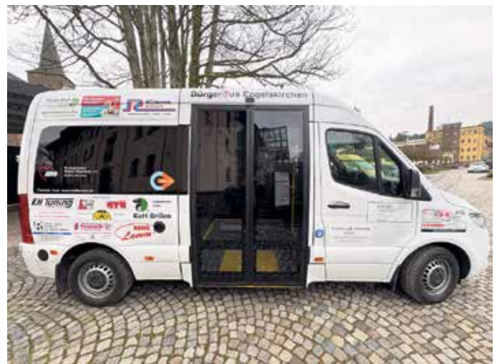
Der neue Bus

vollen Mitgliedern des Vorstandes bedankte sich der Vorsitzende ausdrücklich, was die Anwesenden mit großem Applaus unterstützten. Er bedankte sich aber auch bei allen 27 Fahrern und neun Disponenten, die ehrenamtlich Woche für Woche