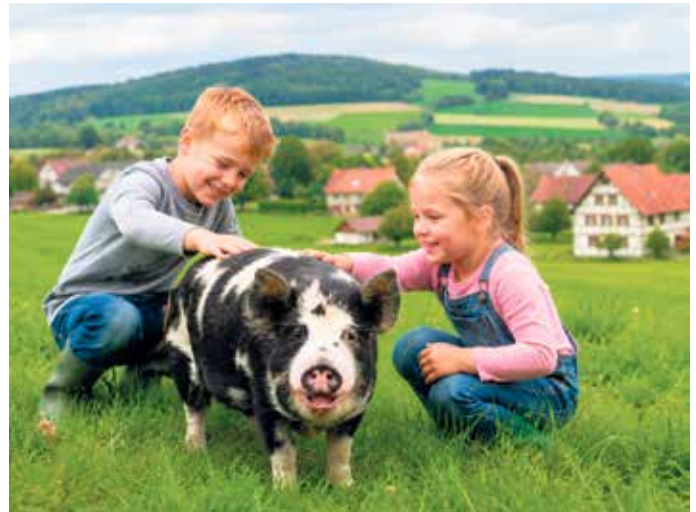
B90/Die Grünen Engelskirchen veranstalten am 31. Juli eine Ferienaktion auf dem Bauernhof „Schweinegut“ für Grundschul Kinder. Symbolfoto: KI-generiert

Ende: Aus der Arbeit der Parteien Bündnis90 / Die Grünen