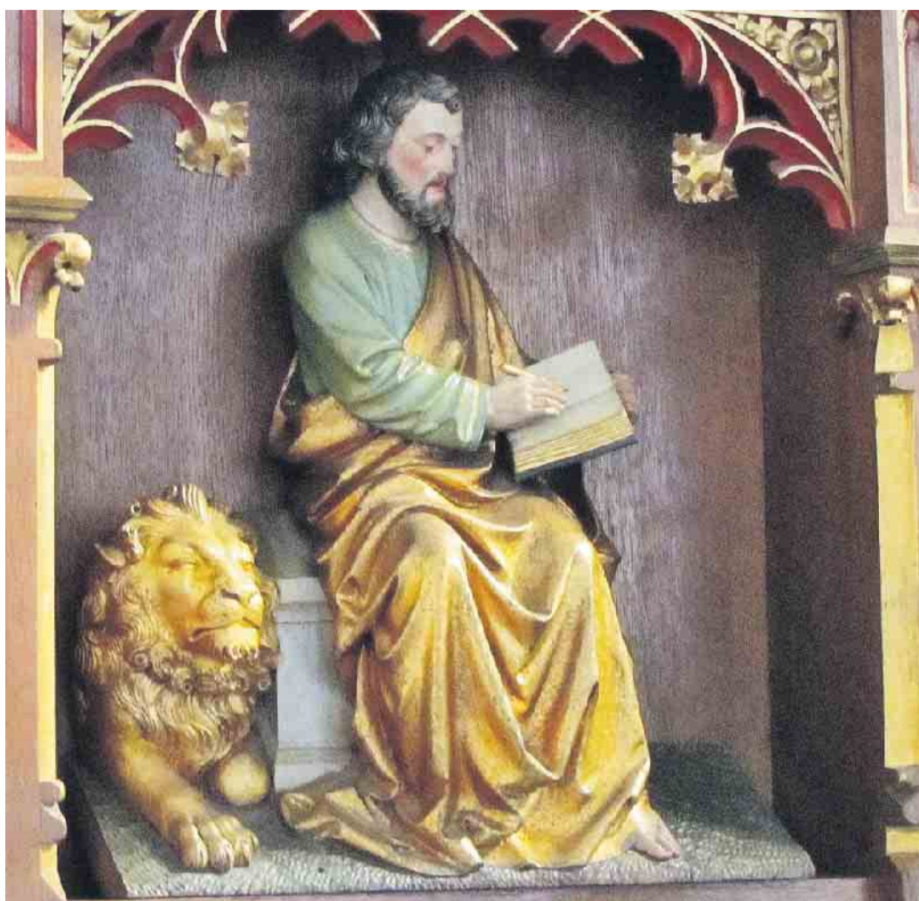
Markus, Darstellung in der Predella des Hochaltares von St. Anton in Amern, farbige Holzschnitzerei um 1900.

Schwalmtal (fje). Der Evangelist Markus (Fest am 25. April) schrieb wohl als erster ein Evangelium, also das Leben Jesu, auf. Der Überlieferung nach war er Schüler des Apostels Petrus und Begleiter von Paulus, später Bischof von