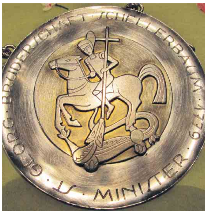
Heiliger Georg (Fest am 23. April), moderne Darstellung auf dem Ministersilber der St. Georg Bruderschaft Schellerbaum.

Dilkraht entfällt am Samstag, 22. April, der Vorabendgottesdienst um 18.30 Uhr, dafür ist um 19.15 Uhr eine einstimmende Feier zur Erstkommunion, zu der herzlich eingeladen wird. Auf eine vorherige Anmeldung zu den Gottesdiensten wird vorerst verzichtet. Das Tragen einer Schutzmaske ist jedem freigestellt. Die Kirchen sind außerhalb der Gottesdienste wie folgt geöffnet: St. Anton Amern