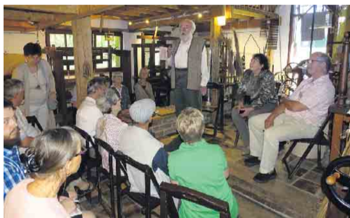
Eröffnung der Ausstellung 2018.