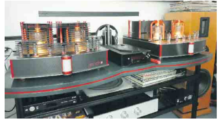
So sehen sie aus - die weltbesten Röhrenverstärker aus Brüggen