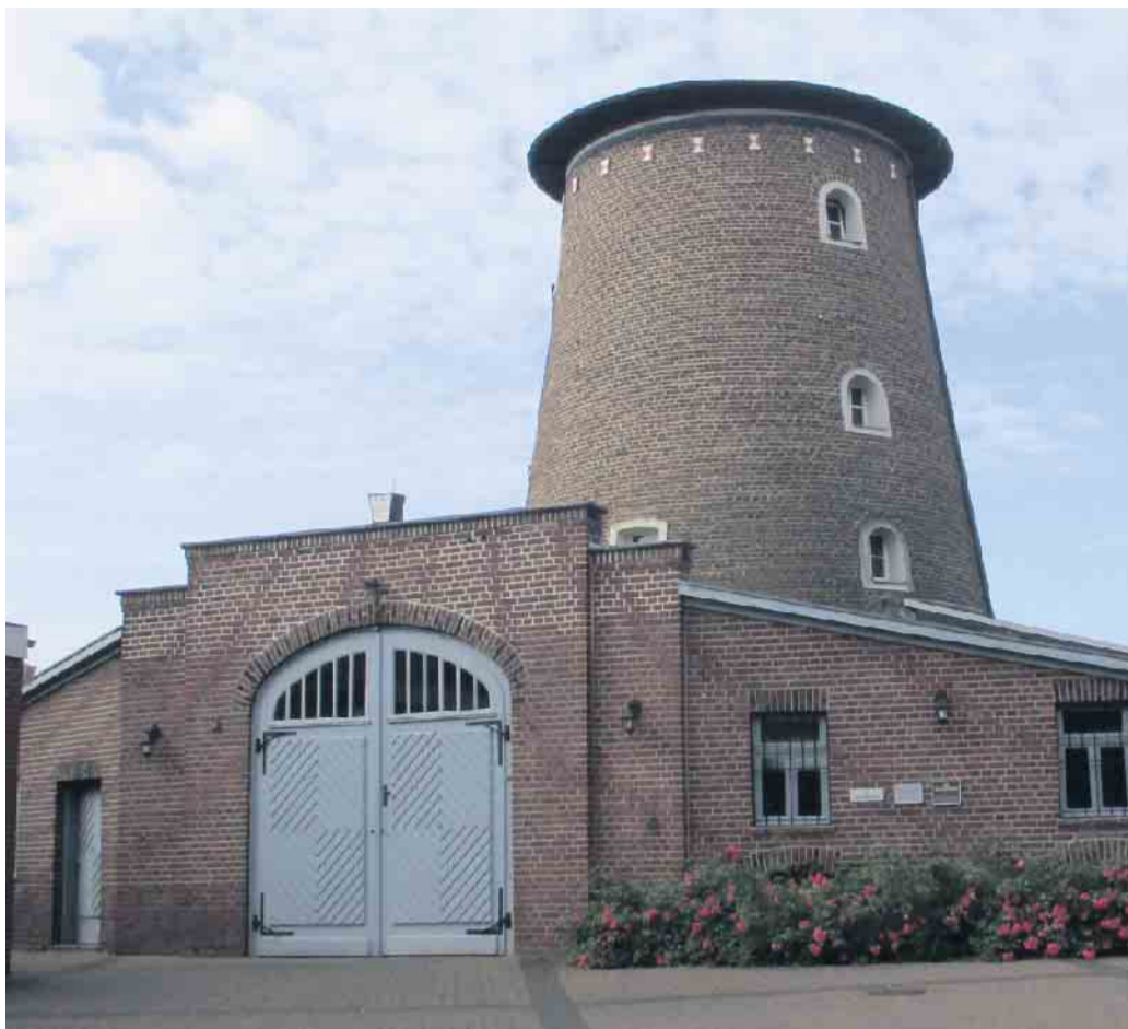
Zu den Orten der Kunstroute gehört auch die Brachter Mühle.

Von aufstrebenden Talenten bis hin zu etablierten Namen sind Künstlerinnen und Künstler aus Brüggem, den Niederlanden und aus den umliegenden Städten und Gemeinden am Niederrhein vertreten. Im Vierkanthof in Brüggem-Boerholz sind sechs niederländische Kunstschaffende aus Maastricht vertreten. Im Photo Loft 60 in Brüggem-