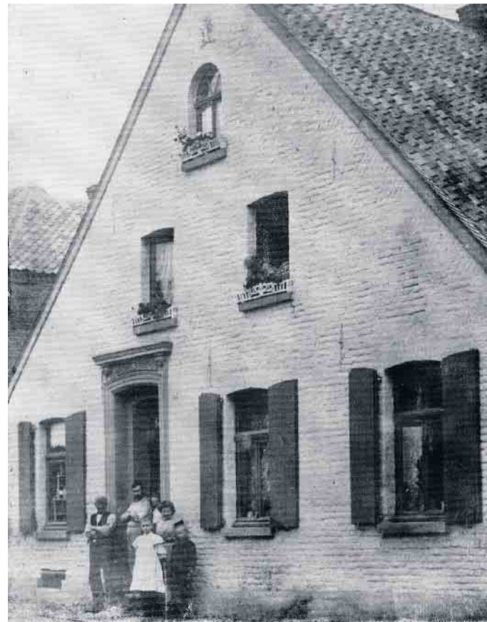
Bäckerei Compans um 1890, bis 1884 Krankenhaus der Gemeinde Hinsbeck.

dass die Bezeichnung „Marien-Hospital“ erhielt und im Volksmund das „Klösterchen“ genannt wurde. Das neue Krankenhaus, das 1861 bezogen werden konnte, bestand aus einem Wohnhaus und einem Anbau mit Waschküche, sowie, da man überwiegend Selbstversorger war, aus Schweine- und Kuhstall. Im Erdgeschoss des Wohnhauses befanden sich die Wohnräume für die inzwischen fünf Mauritzschwestern sowie eine Kapelle. Im Obergeschoss lagen insgesamt fünf Krankenzimmer, die mit bis zu 20 Kranken und Pflegebedürftigen belegt waren. Ein Platz im Haus war sehr begehrt, rund 50 Prozent der Patienten kamen aus den umliegenden Ortschaften. Geleitet wurde das Haus von 1869 bis 1888 von Schwester Tekla, geb. Theodora Mühlenhoff aus St. Moritz (vorherige Leiterinnen sind nicht bekannt). In den 1870er Jahren führte der Preußische Staat Mindestansprüche für Kran-