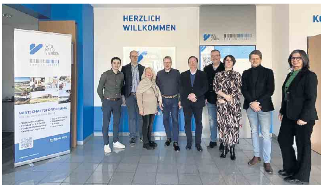
Der Business Club Maas Rhein traf sich in Viersen

schen und setzt sich für eine grenzüberschreitende Zusammenarbeit ein. Einmal im Monat wird ein Netzwerktreffen organisiert. Jetzt traf sich der Vorstand des Business Club Maas Rhein bei der Wirtschaftsförderungsgesellschaft Kreis Viersen in der Kreisstadt und