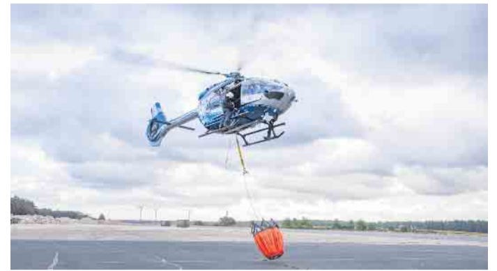
Die Polizei NRW unterstützt die Vegetationsbrandbekämpfung im Kreis Viersen mit Hubschraubern aus der Luft.