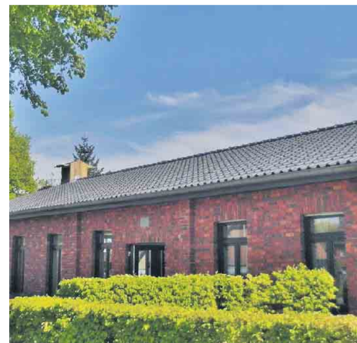
Im Vereinsheim Schier laufen die letzten Vorbereitungen zum Schützenfest im Juni.

Dann geht es am Sonntag, 30. April, weiter. Um 17 Uhr feiert man im