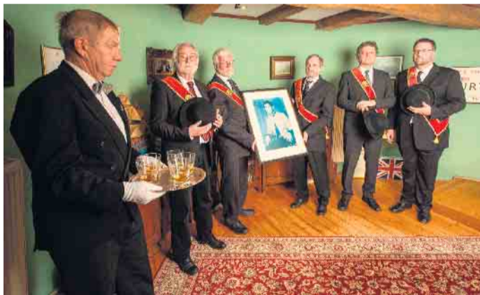
Die „Friends of British Royalty“ laden am Vorabend der Krönung von Charles III. zum Pubabend ein.