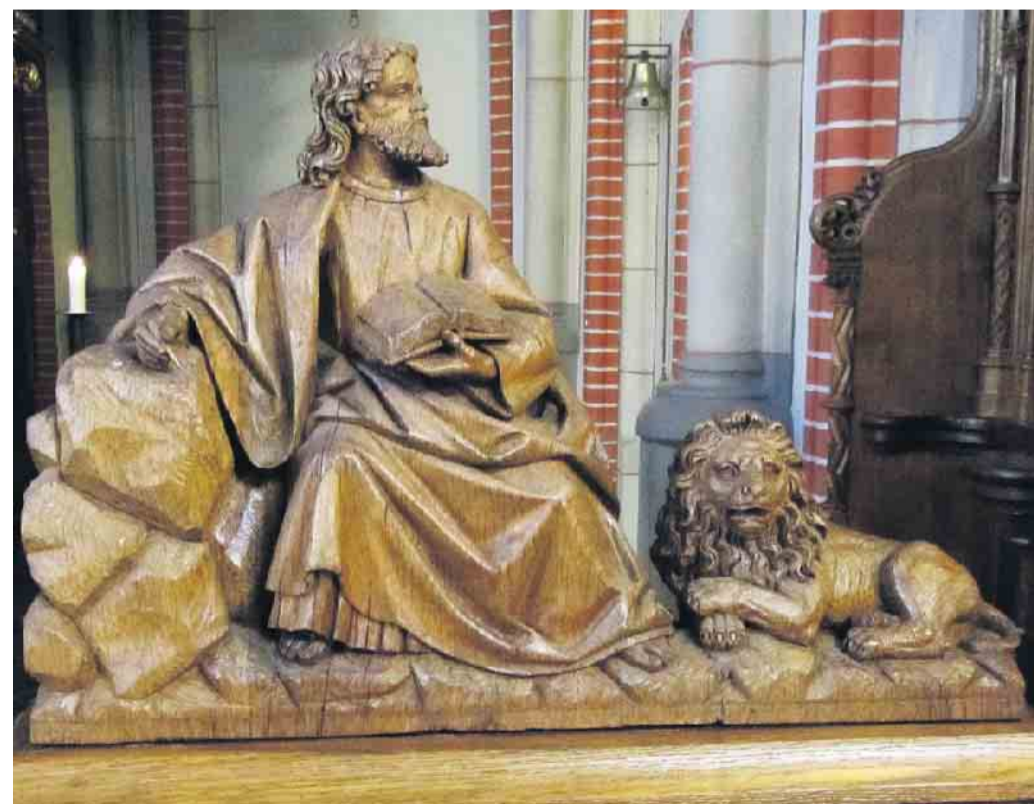
Evangelist Markus auf einer Wange des Chorgestühls in St. Michael Waldniel. Eichenholzschnitzerei um 1900.

Georg Amern. In St. Anton Amern finden wir ihn in der Predella des Hochaltares und in St. Michael auf einer seitlichen Wange des Chorgestühls. In St. Gertrud ist er außerdem als Stickerei auf dem Stab einer neugotischen Kasel dargestellt.