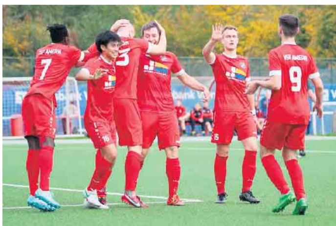
Das Gerüst des Kaders für die Saison 2023/24 steht.

Gesucht wird aktuell noch ein Innenverteidiger, ein Außenverteidiger und zwei Stürmer. „Bei über 50 Spielen, wenn man die Testspiele im Sommer und Winter hinzunimmt, muss man breit aufgestellt sein“, stellt der VSF-Coach klar, der gerne mit einem 23-Kader in die Saison gehen möchte. „Dann bin ich sehr zufrieden mit dem Kader. Ich bin sicher, dass wir die Positionen auch gut besetzt kriegen. Man kann davon ausgehen, dass es auch zwei oder drei Asiaten sein könnten“, erklärt Kehrberg, der auch fast auf das aktuell