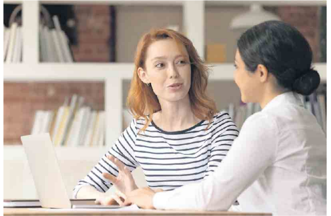
Mit dem Aktivierungs- und Vermittlungsgutschein kann man sich auf eigene Faust einen zugelassenen Maßnahmeträger suchen, der beim Neustart tatkräftig hilft.

einen sogenannten Aktivierungs- und Vermittlungsgutschein (AVGS) der Agentur für Arbeit oder des Jobcenters. Mit der Förderzusage kann man sich einen zugelassenen Träger suchen, der durch „Maßnahmen zur Aktivierung und beruflichen Wiedereingliederung“ beim Neustart tatkräftig hilft. Die Kosten dafür rechnet der Anbieter direkt mit der Agentur für Arbeit oder dem Jobcenter ab. Passende Angebote für Arbeitssuchende in ganz Deutschland findet man beispielsweise beim Institut für Berufliche Bildung (IBB), mehr Informationen dazu gibt es unter www.ibb.com/avgs . „Wir setzen vor allem auf individuell zugeschnittene Coachings und fachliche Weiterbildungen, bei Bedarf und mit Zustimmung der Arbeitsagentur auch online