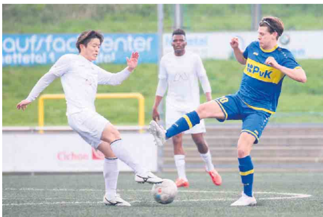
Nettetal verlässt die Abstiegsplätze.