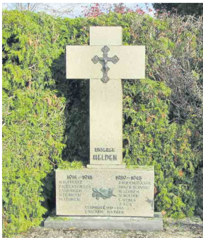
Die St. Georg Bruderschaft Schellerbaum lädt zur Maiandacht am Ehrenmal und zur Versammlung ein.

Am Dienstag, 2. Mai, gestaltet die St. Georg Bruderschaft um 18 Uhr ihre jährliche Maiandacht am Kreuz (Ehrenmal) in Schellerbaum.