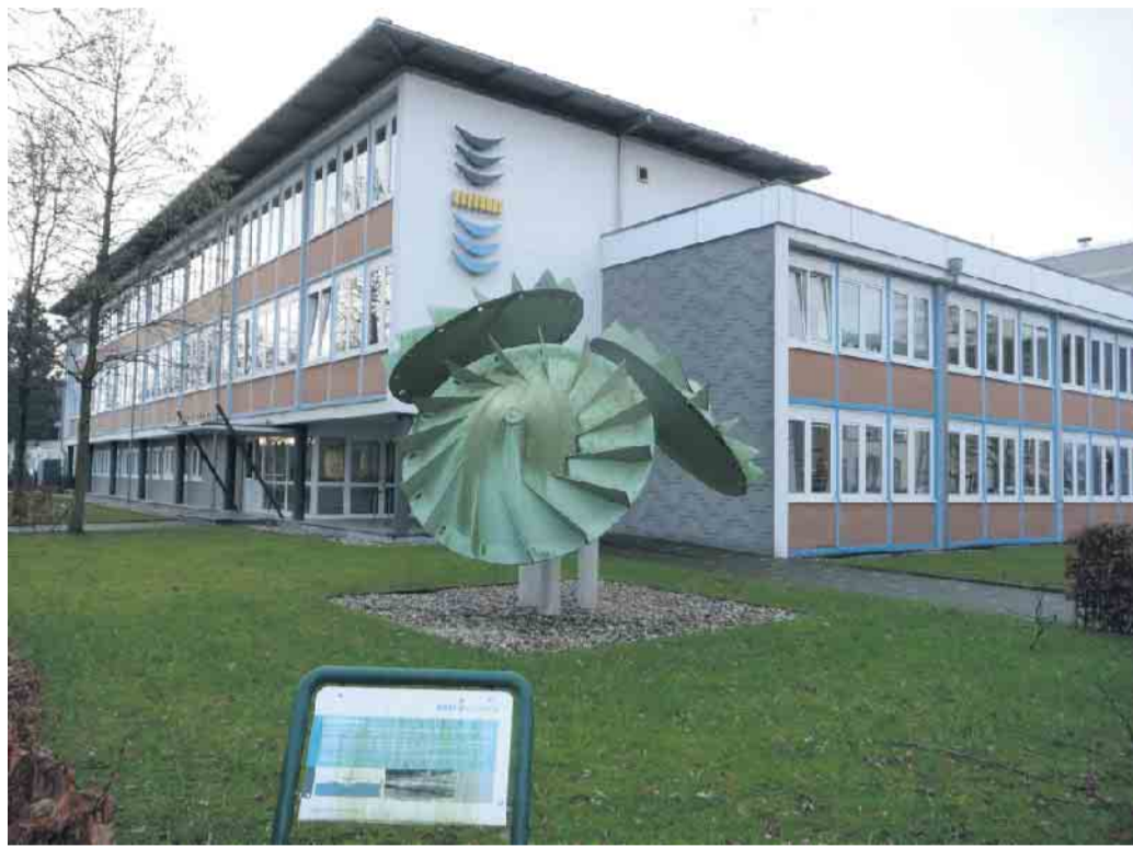
Zentrale des Niersverbandes in Viersen

Bereits vor zehn Jahren hat der Verband ein Energiemanagement für die Betriebsanlagen aufgebaut, das inzwischen auch zertifiziert ist. Durch Maßnahmen zur Energieeinsparung vor allem auf den Kläranlagen konnte der Verband viel Geld einsparen. Auch an Maßnahmen zur Ausweitung der Energiegewinnung aus regenerativen Energien wie Photovoltaik oder Anlagen zur Kraft-Wärme-Kopplung wird intensiv gearbeitet. So sollen Blockheizkraftwerke zum Beispiel auf der Kläranlage in Goch installiert werden. Damit können zusätzliche 1,1 Millionen Kilowattstunden eigener Strom erzeugt und somit die Energieerzeugung auf 43 Prozent gesteigert werden. Neben der Einsparung von Energie und der eigenen Produktion ist aber auch der Stromeinkauf eine wichtige Säule für die sichere Versorgung mit Energie: Um die Risiken hoher Kosten beim Stromeinkauf zu minimieren, erfolgt die Beschaffung als Trancheneinkauf über Auftragnehmer an der EEX-