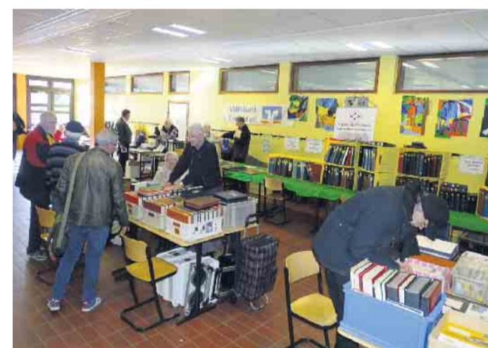
An zahlreichen Verkaufstischen wurden Postbelege gesammelt und verkauft.

Nettetal (hk). Ein erfreulicher Erfolg für die Briefmarkenfreunde Nettetal war am vergangenen Sonntag der „74. Niederrhein-Großtauschtag für Briefmarken, Münzen, Ansichtskarten und Heimatbelegen“ in der Gaststätte „Zur Mühle“ in Nettetal-Kaldenkirchen. Trotz starker Konkurrenz, in Venlo fand eine ähnliche Veranstaltung statt, waren alle 25 Ausstellungstische besetzt und stets umlagert. „Rund 100 Besucher sind