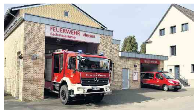
Gerätehaus Rahser der Feuerwehr Viersen mit den Fahrzeugen der Löschgruppe Rahser.

Außerdem kann das Gerätehaus von innen besichtigt werden. Leckeres vom Grill, Salate, Kaffee, Kuchen und Waffeln sowie kühle