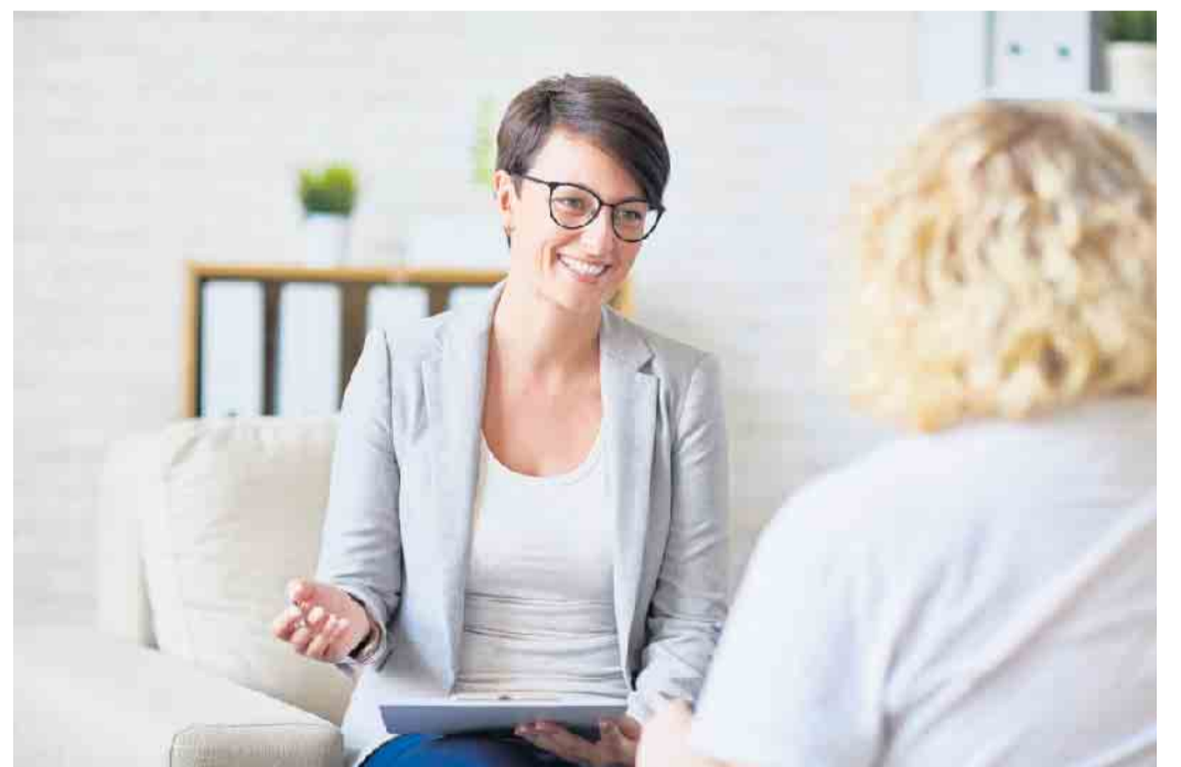
Nach dem Verlust des Arbeitsplatzes geht der Blick irgendwann auch wieder nach vorne. Nun sollte man sich die passende Unterstützung für den Neustart suchen.