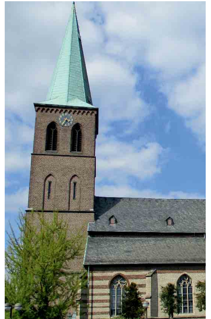
Die Kirche in Bracht ist auf den Titel Mariä Himmelfahrt geweiht

Zu Mariä Himmelfahrt werden vielerorts bunte Sträuße mit Blumen und Kräutern gesegnet.