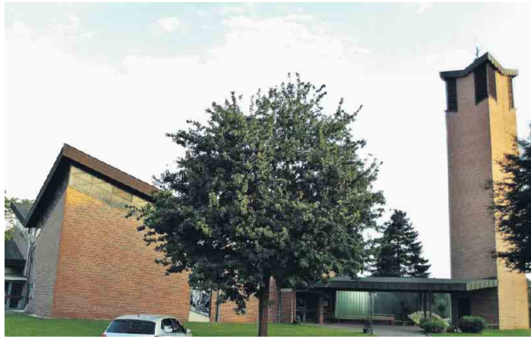
Die Kirche St. Mariä Himmelfahrt Waldnieler Heide feiert an diesem Sonntag ihr Patrozinium.

Schwalmtal (fje). In der Pfarrei St. Matthias Schwalmtal sind vom 12. bis 17. August die nachfolgend aufgeführten Präsenz-Gottesdienste mit Besuchern geplant. Bitte informieren Sie sich aber auch über die Aushänge oder die Homepage der Pfarrei unter www.sankt-matthias-schwalmtal.de .