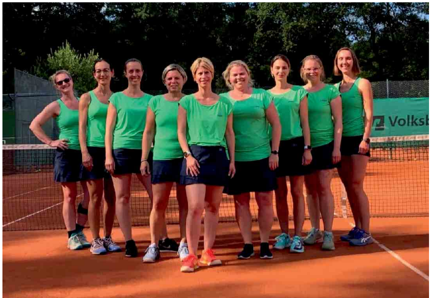
Aufstiegsmannschaften Damen 30