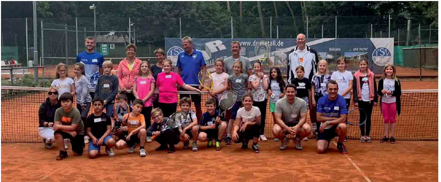
Schüler der KGS Kaldenkirchen/Leuth mit viel Spaß beim Schnuppertag des TSV Tennis.