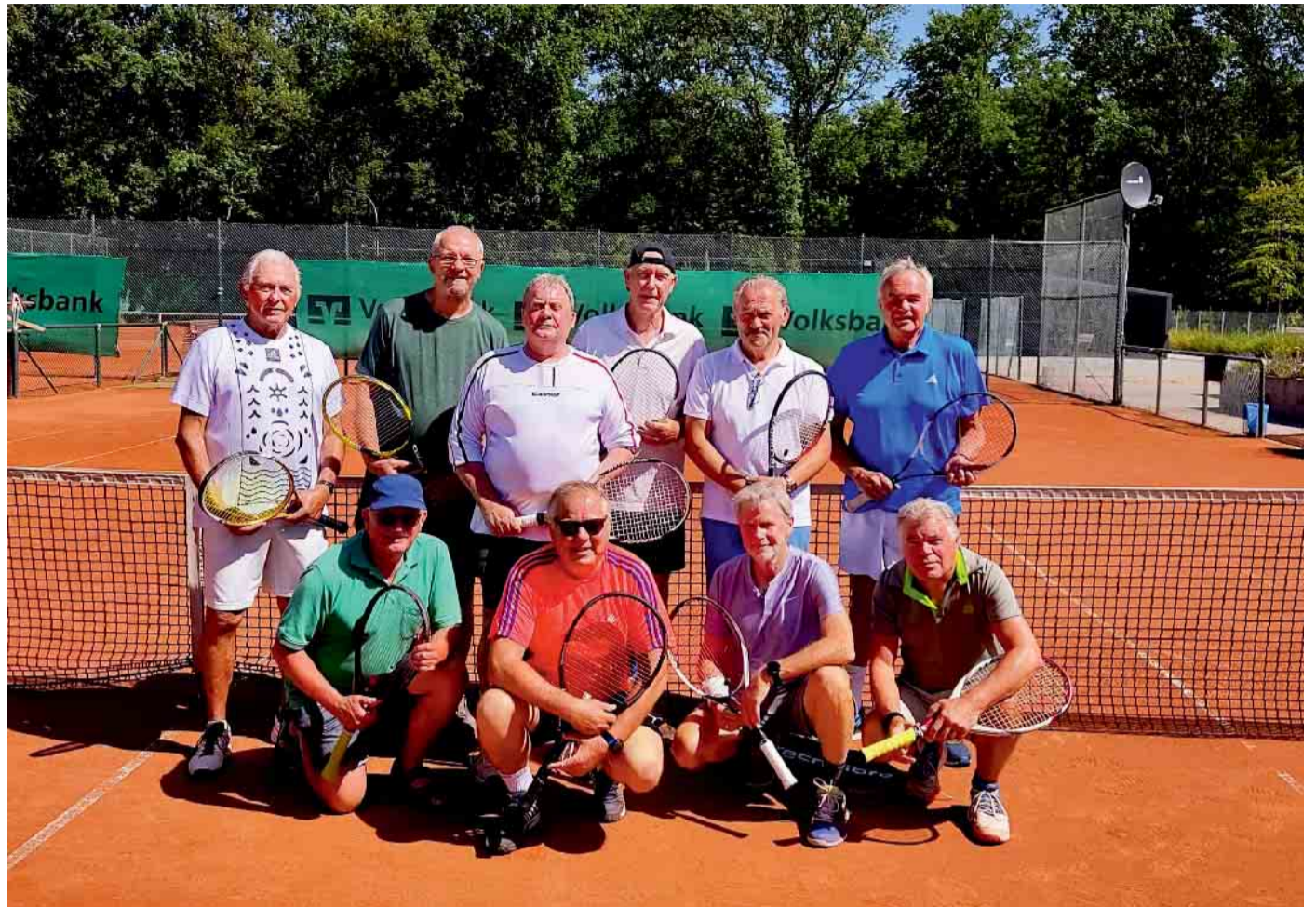
Aufstiegsmannschaften Herren 60