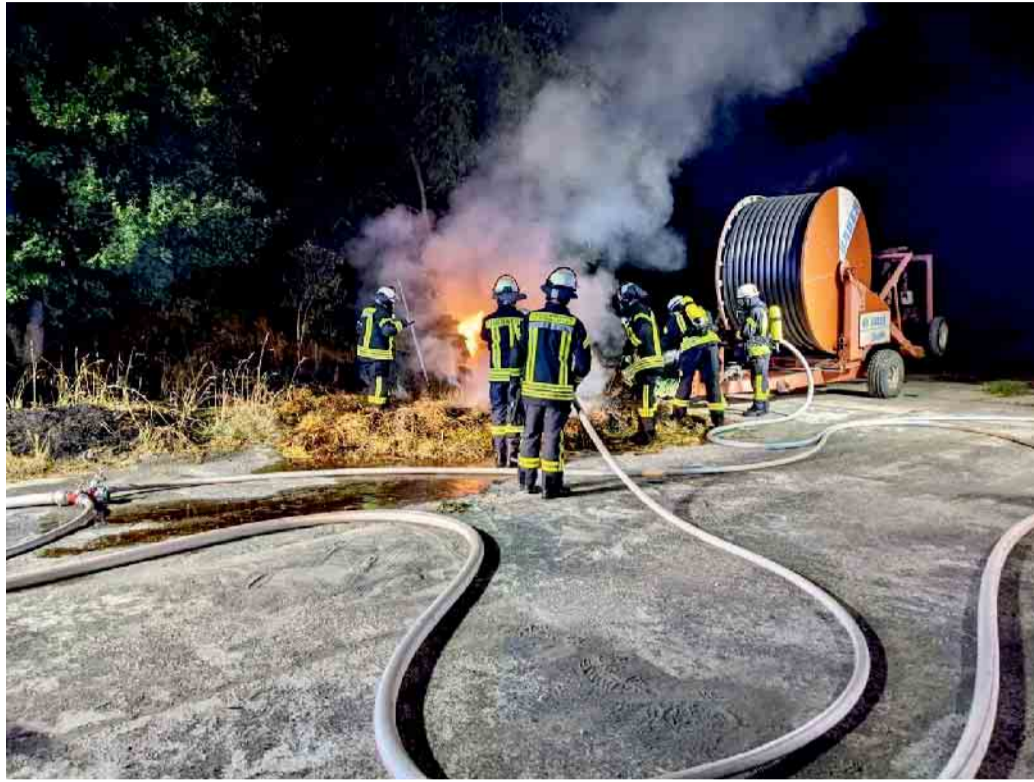
In Ungerath brannten Strohballen.

Parallel wurde der Kreisleitstelle Viersen eine unklare Rauchentwicklung in einem der Bundesautobahn 52 naheliegenden Waldgebiet gemeldet. Der Löschzug Waldniel rückte daraufhin sofort zu dem angegebenen Waldstück aus. Hier stellten die Einsatzkräfte einen Strohballenbrand in der Nähe eines landwirtschaftlichen Anwesens fest, der wohl auch für den Brandgeruch an der Dresdener Straße verantwortlich war. Die Feuerwehr löschte das Feuer mittels mehreren C-Rohre ab. Zeitgleich wurde das nähere Umfeld mit einer Wärmebildkamera erkundet. Danach wurden die brennenden Ballen mit Hilfe eines landwirtschaftlichen