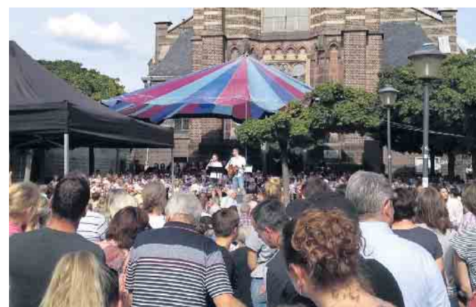
Nach dem Konzert auf dem Waldnieler Marktplatz gab es für die Schwalmthalzupfer eine Jugendfahrt nach Frankreich, jetzt freut man sich auf das Winterkonzert.

fahrt nach Frankreich, die in den Herbstferien stattfand. Die Schwalmthalzupfer bereiten jetzt das nächste große Ereignis vor: Es wird fleißig geprobt für das traditionelle Winterkonzert, das vom 16. bis 18. Dezember wieder in der Achim-Besgen-Halle in Waldniel aufgeführt werden soll.