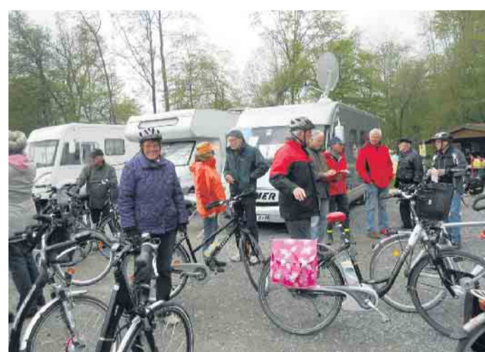
Reisemobilisten vereinbaren wie hier auch gerne gemeinsame Fahrradtouren am Niederrhein

sind vor allem die Faltpäne heiß begehrt, die der Arbeitskreis gemeinsam mit den Niederrhein Touristikern erstellt hat. Sie listen alle Camping- und Reisemobilstellplätze in der Region auf und informieren mit vielen wichtigen Hinweisen über die Sehenswürdigkeiten bis hin zum jeweiligen Fahrradverleih und den nächstgelegenen Einkaufsmöglichkeiten. „Die Treffen der AG Reisemobil und Camping sind wichtiger Bestandteil des Informationsaustauschs innerhalb der Branche. Nur so können die Bedürfnisse der unterschiedlichen Anbieter und Gemeinden kommuniziert und entsprechende Marketingmaß-