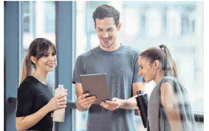
Fitnessstudios leisten einen wichtigen Beitrag zur Gesundheitsversorgung. Auch hier werden dringend Fachkräfte gesucht.

Doch um in der Bevölkerung Bewegungsmangel, Fehlernährung und Übergewicht reduzieren zu können, werden dringend