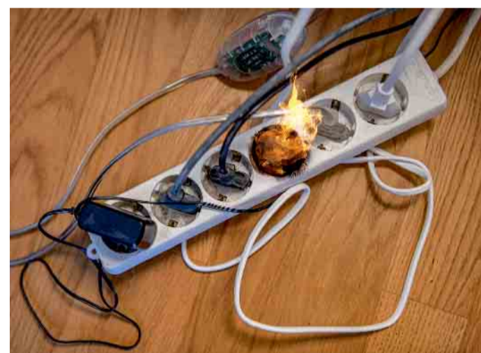
Brennende Steckerleiste durch Kurzschluss