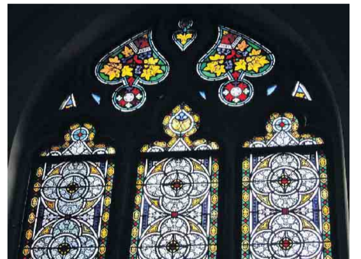
1872 geschaffenes Buntglasfenster von Peter van Treeck in der Kirche St. Gertrud Dilkrath.

Fensterbahnen jeweils auf eine Art helles Milchglas mit Schwarzlot gemalte florale Muster, die Ränder sind in kräftigen Farben gehalten. In den oberen Zwickeln finden sich ebenso intensivfarbige bunte Blumen, Ranken und