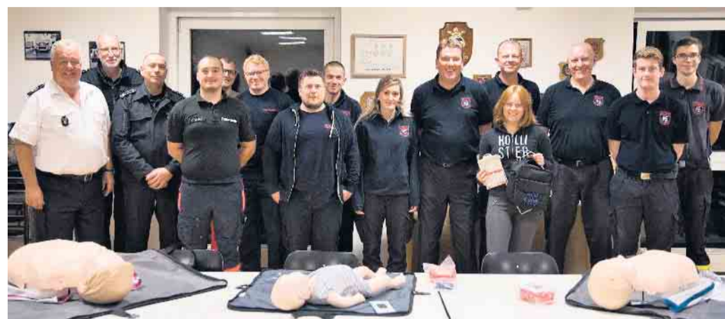
Die Schwalmthaler Teilnehmer am Programm zur Smartphone-basierten Ersthelfer-Alarmierung.

Schwalmthal (fjc). Seit dem 28. Oktober gibt es im Kreis Viersen die Mobile Retter App, eine Smartphone-basierte Ersthelfer-Alarmierung. So werden ab sofort im Kreis Viersen bei einem zeitkritischen Notfall, ergänzend zum Rettungsdienst, nachdem Absetzen eines Notrufs über die 112, medizinisch qualifizierte Ersthelfer*innen via GPS-Komponente ihrer Smartphones geortet und durch die Leitstelle automatisch parallel zum Rettungsdienst alarmiert. Als zeitkritischer Notfall wird ein Herz-Kreislauf-Stillstand definiert, wo allein durch die örtliche Nähe die Mobilten Retter sehr oft schneller als der Rettungsdienst am Notfallort sind und somit bis zu dessen Eintreffen bereits qualifizierte lebensrettende Maßnahmen einleiten können. So werden im Ernstfall wertvolle Minuten bis zum Eintreffen des Rettungsdienstes überbrückt und die Rettungskette verstärkt, ohne