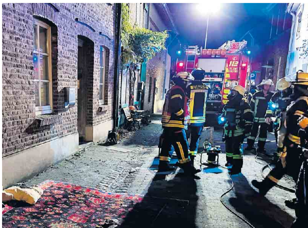
Auf der Niederstraße in Waldniel wurde die Feuerwehr zu einem Wohnungsbrand gerufen.

Fahrzeug- und Wohnungsbrand in Schwalmthal