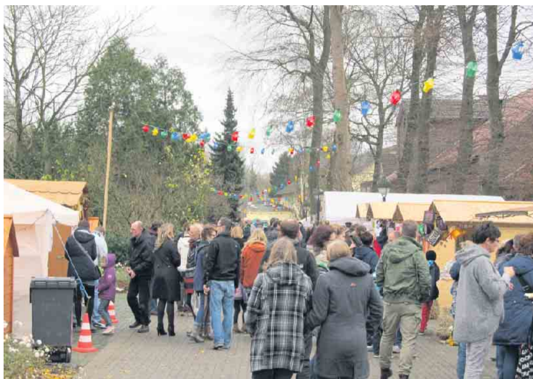
Am 13. November lädt das Bethanien Kinder- und Jugenddorf wieder zum alljährlichen Martinsmarkt ein.

Der traditionelle Martinsmarkt hält ein Programm für die ganze Familie bereit: An den Aktionsständen können Kinder Kerzenziehen, Schneekugeln basteln, Stockbrot rösten und spielen und toben. Erwachsene können sich bei einem heißen Punsch