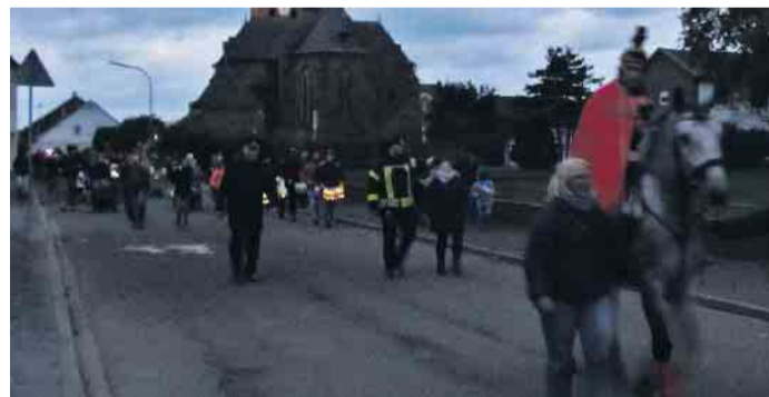
Die letzten Martinszüge gehen in diesen Tagen durch die Dörfer des Grenzlandes.

Schwalmtal/Brüggen (fjc). In diesen Tagen ziehen die letzten Martinszüge durch die Dörfer des Grenzlandes. An diesem Donnerstag, 10. November gehen in Schwalmatal um 17 Uhr die Kita-Kinder in Vogelsrath. Am Freitag, 11. November, starten um 17.15 Uhr der Martinsverein Eicken an der Kirche Waldnieler Heide und der Martinsverein Amern St. Georg auf der Waldnieler Straße. Am Samstag, 12. November, beschließt dann der Zug in Dilkrath den Reigen, Start ist um 17 Uhr auf der Nordstraße. In Brüggen zieht der Kindergarten St. Nikolaus am Donnerstag, 10. November