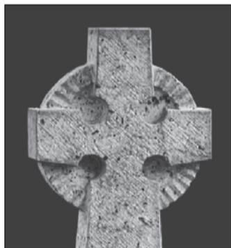
MANFRED MANGOLD Steinmetz und Bildhauer

M 13 Uhr - Andacht zum Abschluss des Ewigen Gebets