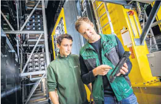
Die Ausbildung zur Fachkraft für Lagerlogistik in der Brauerei dauert drei Jahre, Voraussetzung ist ein Hauptschulabschluss.

Berufe: Fachkräfte für Lagerlogistik haben in Firmen eine bedeutsame Funktion