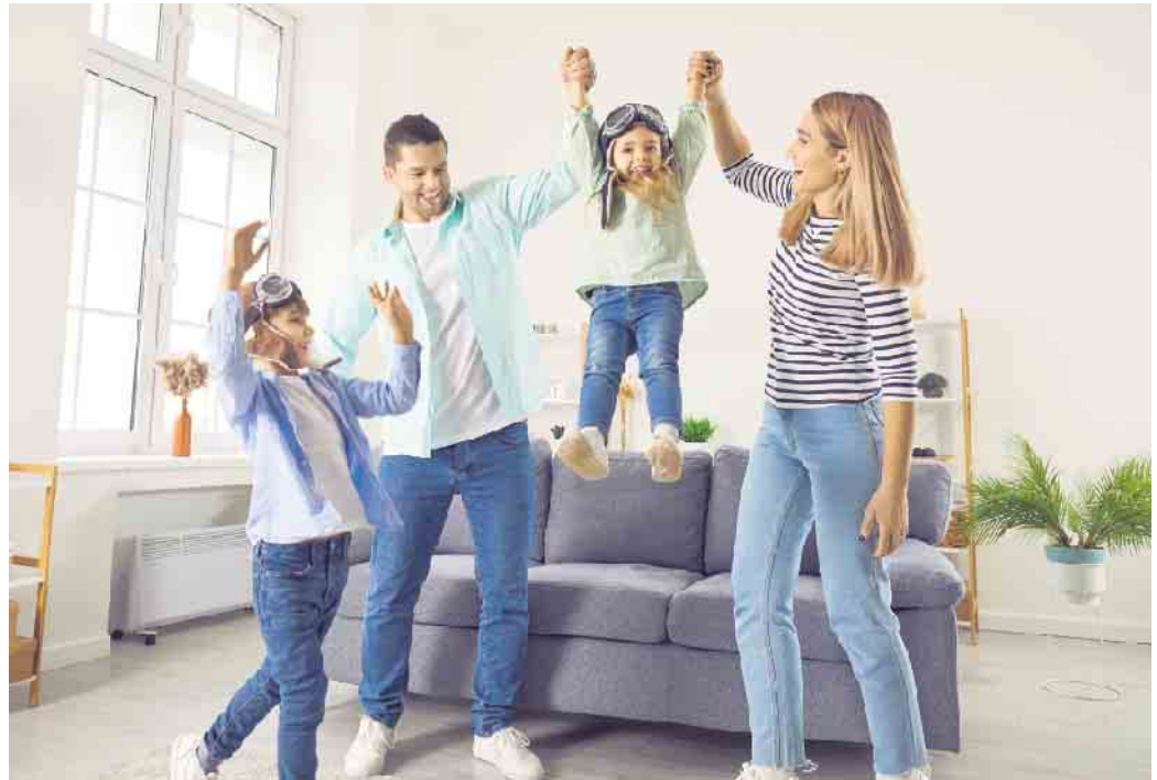
Lüftungsanlagen führen Schadstoffe zuverlässig ab und halten dank Filtertechnik Pollen und Feinstaub draußen.

Mit der manuellen Fensterlüftung lässt sich das Problem aber kaum beheben, denn auch von draußen kann beispielsweise mit Pollen oder Feinstaub belastete Luft ins Haus gelangen. Eine wirksame und zugleich auch noch energieeffiziente Lösung für gesunde Raumluft ist daher die kontrollierte Wohnungslüftung. Dabei führen Lüftungsanlagen die belastete Raumluft zuverlässig nach außen ab, leiten gefilterte Außenluft ins Haus und sorgen so für mehr „Lebensluft“. Bei der Initiative „Gute Luft“