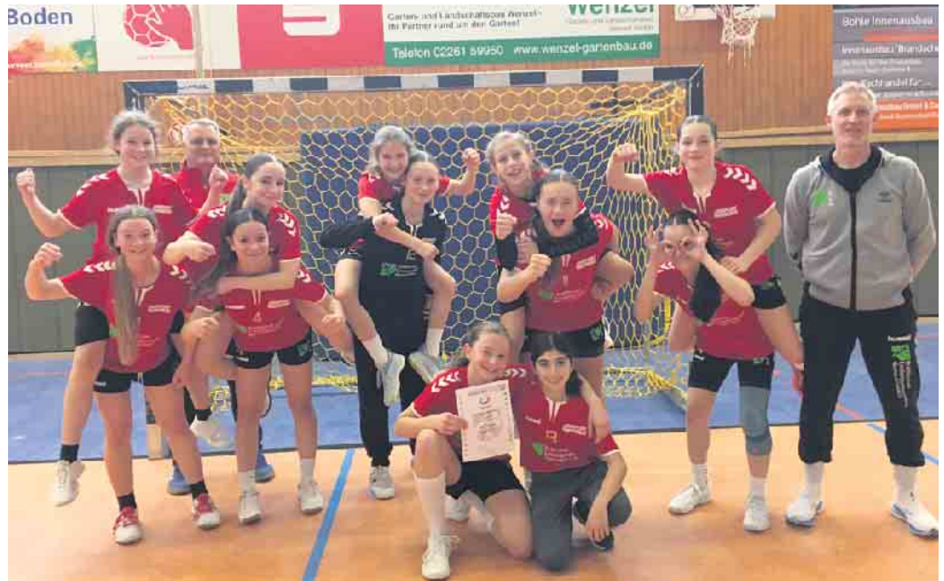
Team U14

Die Sieger dieses Turniers qualifizieren sich für das Bundesfinale in Berlin und spielen dort gegen die Landesmeister der anderen Bundesländer um die deutsche Schulmeisterschaft.