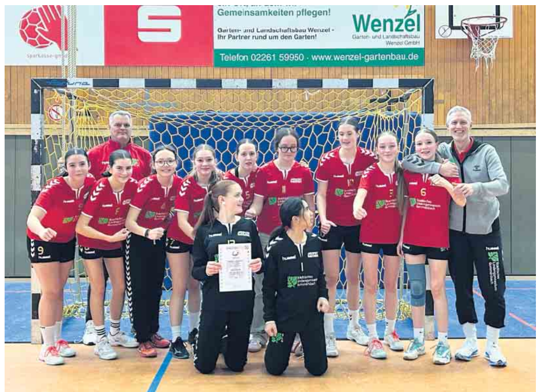
Team U14 - Quelle Lindengymnasium Gummersbach