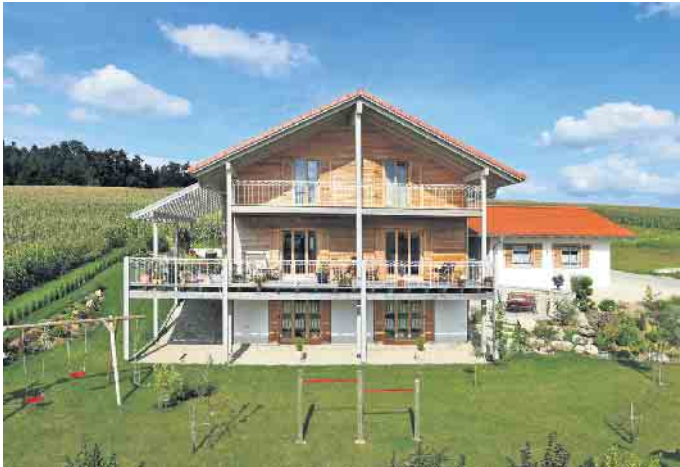
Dank individueller Hausplanung können sich alle Generationen dauerhaft unter einem Dach wohlfühlen.

groß geworden, aber für drei Generationen noch nicht groß genug ist. „Wichtig beim Mehrgenerationenwohnen ist auch, dass sich alle Parteien mal zurückziehen und gemütlich für sich sein können. Daher geht es nicht ohne individuelle Hausplanung, in die jede und jeder zukünftige Bewohner - von Oma und Opa bis zum Kleinkind und dem Haustier - einbezogen sein sollte“, so Tews.