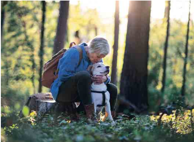
Der Körper braucht in allen Lebensphasen Bewegung, um gesund zu bleiben.