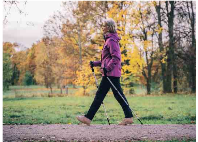
Bei Frauen über 45 empfiehlt sich moderates Ausdauertraining.

„Healthy Agerinnen“ wollen gesund und zufrieden altern und sich lange im eigenen Körper wohlfühlen.