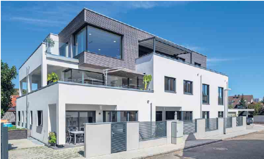
Mehrgenerationenhäuser in Holz-Fertigbauweise sind im Kommen.

Mehrgenerationenhäuser aus Holz sind ein zukunftssicheres Zuhause für die ganze Familie