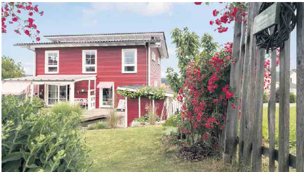
Wohlfühlwohnen gelingt in einem individuell geplanten Holz-Fertighaus sicher.

Wer es dabei besonders extravagant mag oder zuhause einfach genauso gemütlich wohnen möchte wie im letzten Traumurlaub, kann entweder auf die Erfahrung der Haushersteller mit regionaltypischer Architektur und Ausstattung zurückgreifen oder auch ganz eigene Wünsche in die Hausplanung einbringen. „Die Planung beginnt entweder mit einem vorhandenen