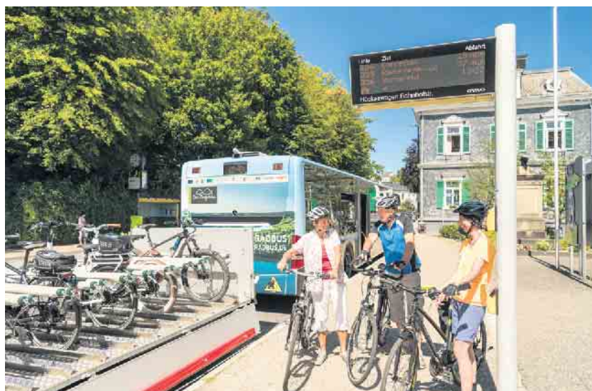
Ankunft mit dem Bergischen FahrradBus in Hückeswagen. Hier beginnt die Radtour auf dem Bergischen Panorama-Radweg nach Marienheide (Route 1).

Route 1: Radtour auf dem Bergischen Panorama-Radweg von Hückeswagen nach Marienheide (ca. 20 km). Von hier ist die Weiterfahrt über die Radroute Wasserquintett/Schlei-