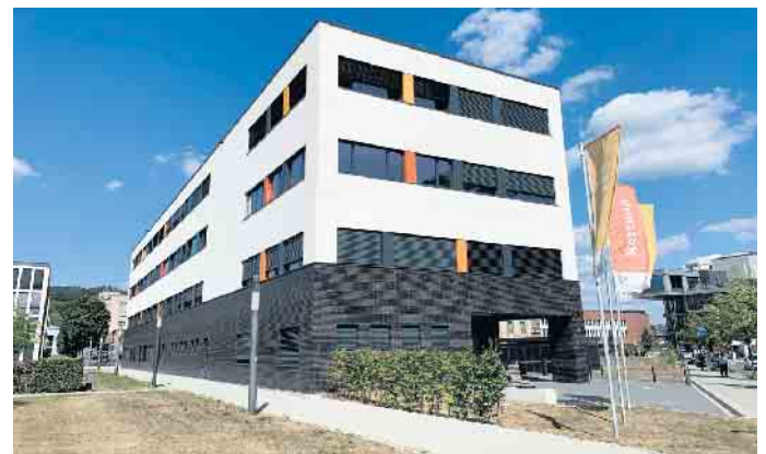
Die AGewiS bietet ein Netzwerktreffen für alle Interessierten zum Themenbereich „alternative Wohnformen“ an.

und alle Interessierten. Das Treffen findet statt, am Mittwoch, 10. Mai, zwischen 13 und 17 Uhr in den Räumlichkeiten der Akademie für Gesundheitswirtschaft und Senioren (AGewiS), Steinmüllerallee 28 in Gummersbach. Die Veranstaltung ist kostenlos. Um Anmeldung wird gebeten per E-Mail an regina.wesselmecking@obk.de oder telefonisch 02261 88-4382. Weitere Informationen auf www.agewis.de .