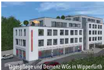
Tagespflege und Demenz-WGs in Wipperfürth