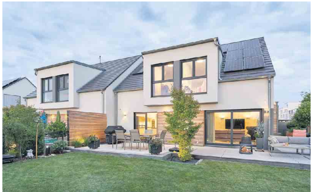
Doppelhaus in Fertigbauweise - das geht achsensymmetrisch oder auch grundverschieden.

Die Hersteller von Holz-Fertighäusern registrieren ein reges Interesse an Doppelhäusern und haben sich mit attraktiven Grundriss- und Architekturkonzepten darauf eingestellt. „Sie zeigen