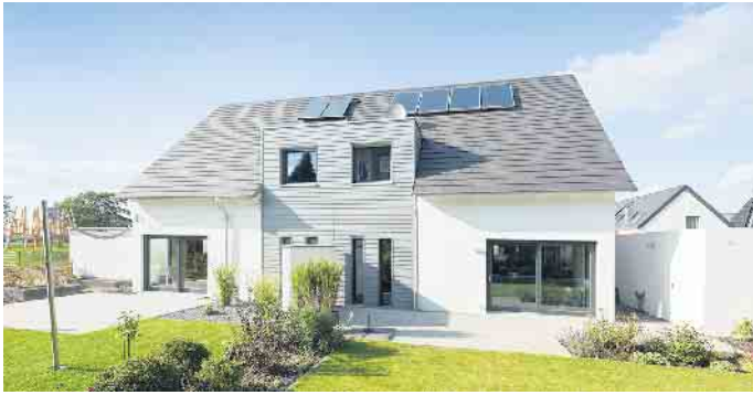
Fertighäuser sind besonders energieeffizient - als Doppelhaus umso mehr.

ren Grundstück ist ein Doppelhaus mitunter sogar die einzige Chance auf zwei unabhängige Eigenheime und damit auf eine kostengünstigere Alternative zum Einfamilienhaus. Ein weiterer Vorteil des Doppelhauses, der gerade jetzt eine große Rolle spielt, ist dessen Energieeffizienz: „Holz-Fertighäuser werden heute immer als besonders effiziente und klimafreundliche Energiesparhäuser mit meist eigener Energiegewin-