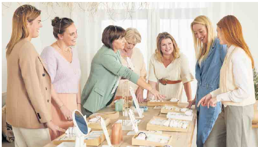
Gemeinsam mit Bekannten Schmuck auszuwählen und alles genau zu begutachten, macht Spaß und kann einen guten Verdienst einbringen.