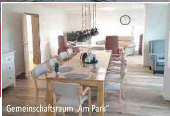
Gemeinschaftsraum „Am Park“