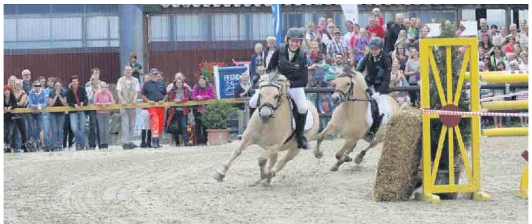
Highlight am Sonntag: Das bekannte Ponyrennen