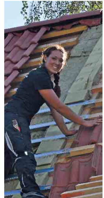
Dachdeckerinnen sind auf dem Vormarsch: schweres Tragen ist out, das übernehmen Lastenaufzüge.

Was aber auch wichtig ist: Dachdeckerhandwerk ist und bleibt Handwerk: das heißt, es wird angepackt, die Arbeit findet überwiegend draußen statt und oft hoch oben. Dafür gibt es tolle Aussichten, vielfältige Aufgaben und am Ende des Tages sehen Dachdecker und Dachdeckerinnen, was sie geschafft haben. Das macht stolz. Und wer heute eine Ausbildung im Handwerk startet, hat