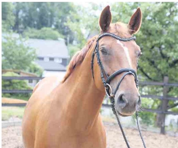
Wer in der freien Landschaft und im Wald auszureiten möchte, benötigt ein gültiges Reitkennzeichen für sein Pferd.

Reiten ist neben Wandern und Radfahren eine beliebte Freizeitbeschäftigung im Oberberg-