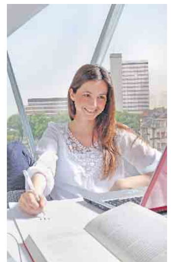
Effektiver Lärmschutz kann zu einer besseren Konzentration im Homeoffice beitragen.

Doch nicht nur für Wohnräume oder das Schlafzimmer sind Schallschutzfenster gefragt: Häufig werden die schallschluckenden Spezialfolien auch im Überkopfbereich genutzt. Auf diese Weise können zum Beispiel bei Wintergärten oder Glasvordächern nervige Geräusche von Regentropfen auf dem Glas stark abgemildert werden. (DJD)