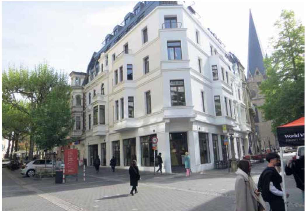
Das Museum in der Poststrasse

Es wird gezeigt, wie die geheime Hieroglyphenschrift geht. Im Museum sehen wir uns die originale Schrift