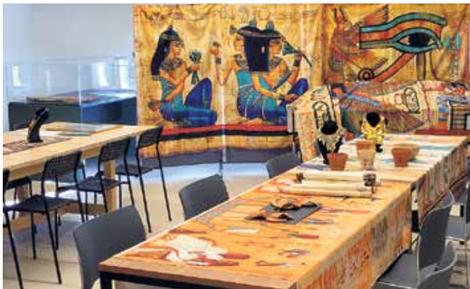
Workshopraum im Museum

Einen Nachmittag im Ägyptischen Museum mit einem Ägyptologen, der die Fragen beantwortet und persönlich durch die Ausstellung führt. Für nähere Informationen zu den Aktionen, Preise usw. Informationen unter FVEGYPTmuseum@gmx.de oder, während den Öffnungszeiten unter 0228739717 Organisiert und durchgeführt vom Förderverein des Ägyptischen Museums der Universität Bonn e.V., Poststr. 26, 53111 Bonn (P26)