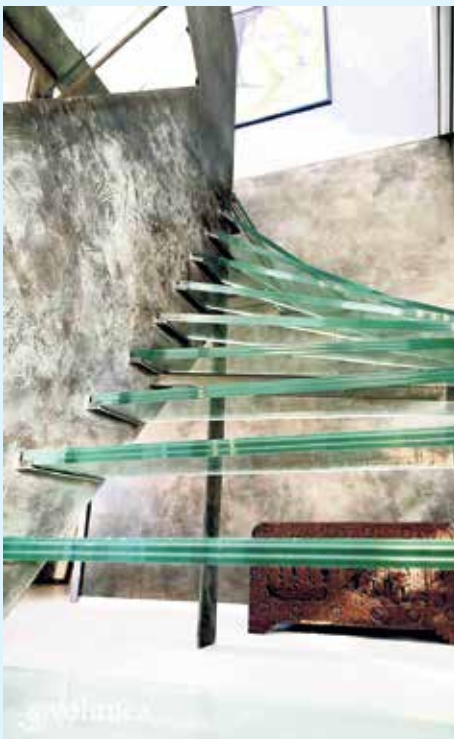
Wandbeschichtung Treppenhaus, Purmetalico Bronze mit schwarzer Patina von Volimea