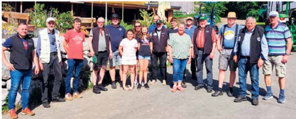
Die Teilnehmer der Traktortour machten am Dachsloch Halt und stellten sich dort gemeinsam für ein Gruppenfoto auf.

Die Oldtimerfreunde Hallenberg blicken damit auf eine rundum gelungene Frühjahrsausfahrt mit vielen schönen Fahrzeugen, guter Stimmung und zahlreichen begeisterten Teilnehmern und Zuschauern zurück.