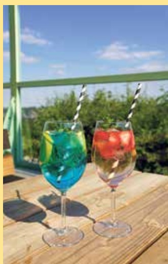
So lässt sich der Sommer genießen: Spritz-Variationen an Der Schanze