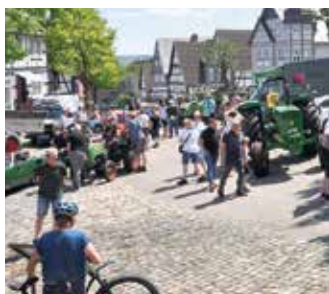
Frühjahrsausfahrt der Oldtimerfreunde Hallenberg e.V.