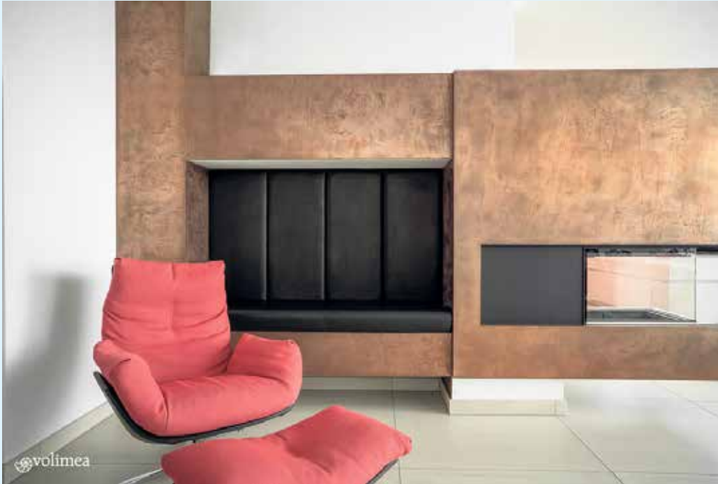
Kamin mit Prägung, Beschichtung Purmetalico-Kupfer von Volimea

Der Malerbetrieb Schnorbus aus Züschen verleiht jeder Oberfläche mit Echtmetall-Beschichtungen durch besondere Texturen,