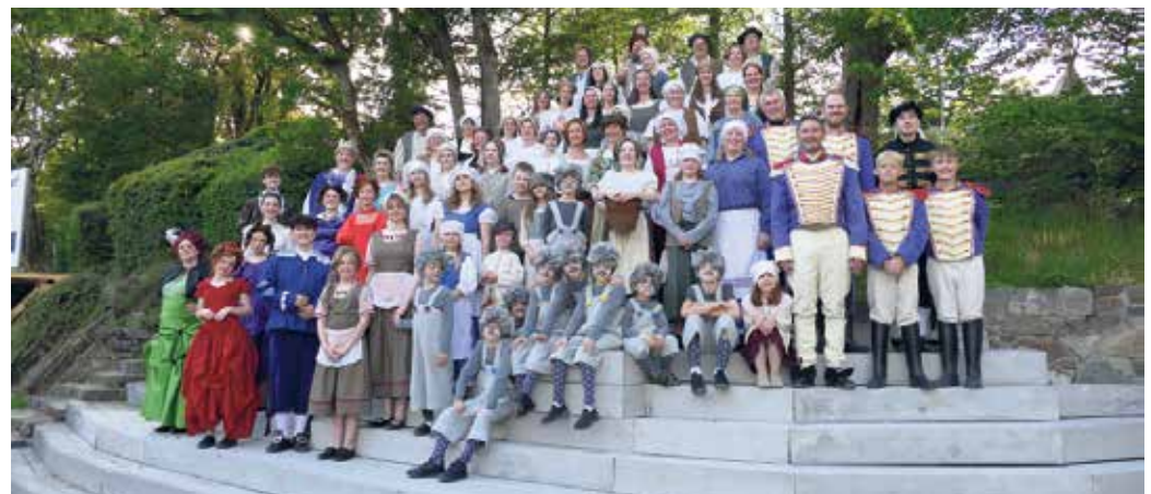
Ensemble des diesjährigen Familienstücks „Cinderella“.