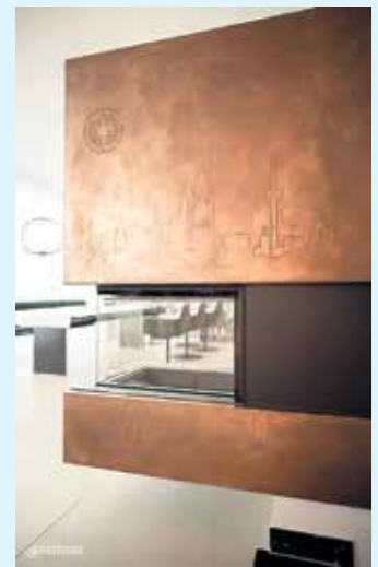
Kamin mit Prägung, Beschichtung Purmetalico-Kupfer von Volimea

Ihr Malerbetrieb Schnorbus berät Sie gerne zu Ihrer individuellen, Echtmetall-Wandgestaltung. [BL]