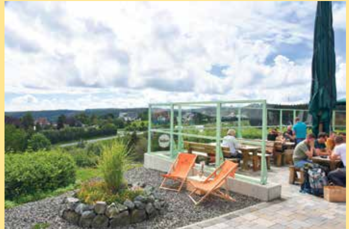
Terrasse mit Weitblick an der Gastronomie „Die Schanze“ in Winterberg

Die Schanze Herrlohweg 100 59955 Winterberg Tel.: +49 (0) 2981 425 9019 kontakt@die-schanze.de Schneewittchen-Haus Am Waltenberg 119 59955 Winterberg Tel.: +49 (0) 2981 425 9020 kontakt@schneewittchenhaus.de