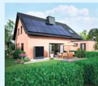
Modernes Einfamilienhaus mit Full-Black-Modulen

eine Privathaushalts, da die Module in den Morgen- und Abendstunden den Strom produzieren. Die modernen Full Black-Solarmodule mit durchgängig schwarzer Farbgebung fangen nicht nur reines Sonnenlicht, sondern auch UV-Strahlung zur Nutzung eines Privathaushaltes optimal ab und sind vergleichbar zu damals, vor etwa fünfzehn Jahren auch in der Anschaffung um die Hälfte günstiger geworden. In Hinblick auf die aktuelle Weltlage zudem die beste Lösung, sich weg von fossilen Brennstoffen zu bewegen und die benötigte Energie für sein Haus möglichst autark, ohne ständige Abhängigkeit der wirtschaftlichen Lage zu betreiben.- Ohne Frage eine zukunftsorientierte Entscheidung. Ein weiterer klarer Vorteil zu einer Anschaffung einer Solaranlage sind die hohen, staatlichen Förderungen der "BAFA-" oder der "KfW-Bank". Der Meisterbetrieb Menke berät Sie gerne individuell für sie zugeschnitten für eine Komplettlösung mit Wallbox, Solar und Wärmepumpe. [BL]