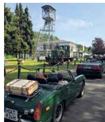
Die Auto-Tour beim Zwischenstopp am Besucherbergwerk Ramsbeck