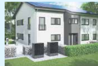
Modernes Mehrfamilienhaus mit Wärmepumpe, kombiniert mit Photovoltaik und Wallbox