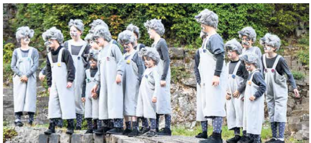
Die Mäuse eilen Cinderella zu Hilfe.