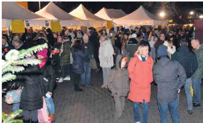
Zahlreiche Gäste besuchten den Weihnachtsmarkt des Gymnasiums am Oelberg

Das Gymnasium am Oelberg hatte zum Green Corner Weihnachtsmarkt eingeladen