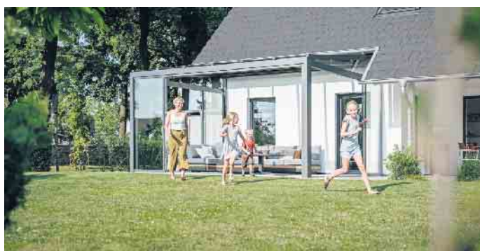
Mit einem Glashaus gehen Innen- und Außenbereich fließend ineinander über.

und eine direkte Kontaktmöglichkeit. Mit den großen Glasflächen wird mehr Sonnenlicht eingefangen, für mehr Licht und Wärme im Zuhause. Die beweglichen Verglasungen bieten noch mehr Komfort: Sie öffnen die Fassade großzügig und holen die Natur ins Haus. Innen- und Außenbereich gehen somit fließend ineinander über. (DJD)