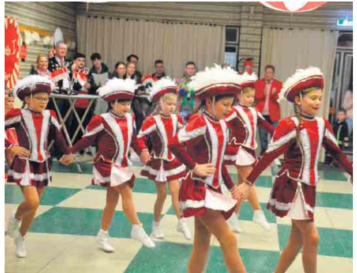
Die Tanzgruppen der GKKG schwingen ihre Beine zu Ehren der neuen Kinderprinzessin