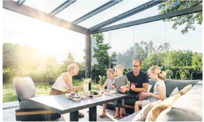
Bewegliche Verglasungen holen die Natur ins Haus.