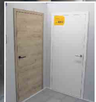
Abb. sind Beispiele! Produkte in Ausstellungen und Lager können abweichen!

KLEIN BAUSTOFFE Baumarkt Brennstoffe FUTTERMARKT