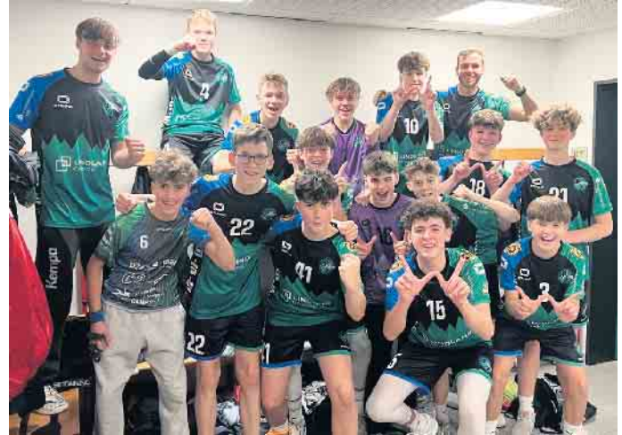
Die Jugend-Handballer feierten den Sieg gegen den VfL Gummersbach, mussten in den letzten beiden Spielen des vergangenen Jahres jedoch Niederlagen einstecken

Mit einem 5-Tore-Rückstand der HSG ging es in die Halbzeit. Der BHC behielt weiterhin die Oberhand. Und baute seinen Vorsprung aus. Die letzten zwanzig Minuten der zweiten Halbzeit liefen deutlich besser. Als wenn ein Ruck durch das gesamte Team gegangen wäre, war es jetzt ein Spiel auf Augenhöhe.