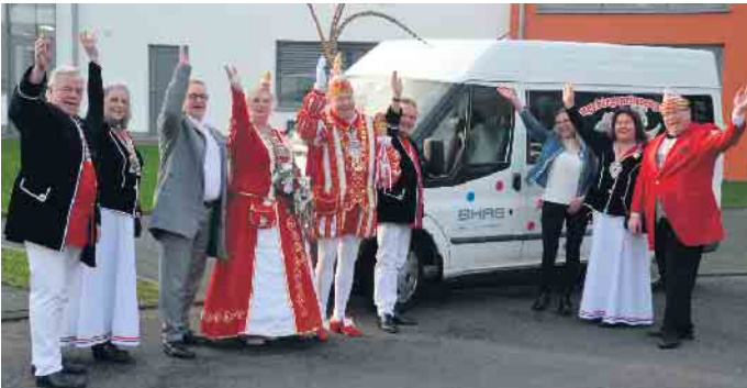
Die Fahrzeugübergabe wurde mit einem dreifachen Alaaf bedacht

Das Siebengebirgsprinzenpaar bedankt sich für die Unterstützung der Bad Honnef AG