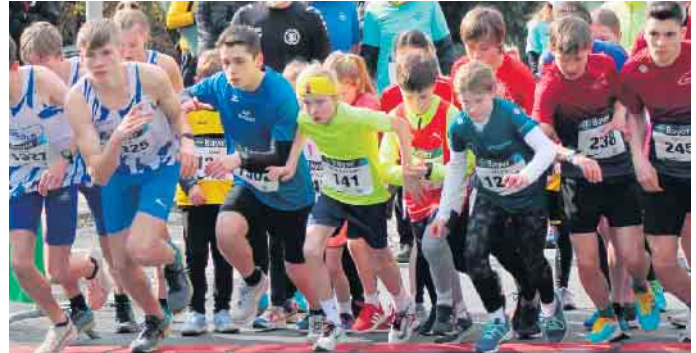
Verstärke unser Trainerteam