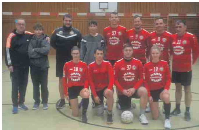
Der Faustball-Bundesligist MSV Buna-Schkopau aus Sachsen-Anhalt war zu Gast bei der SSG Königswinter