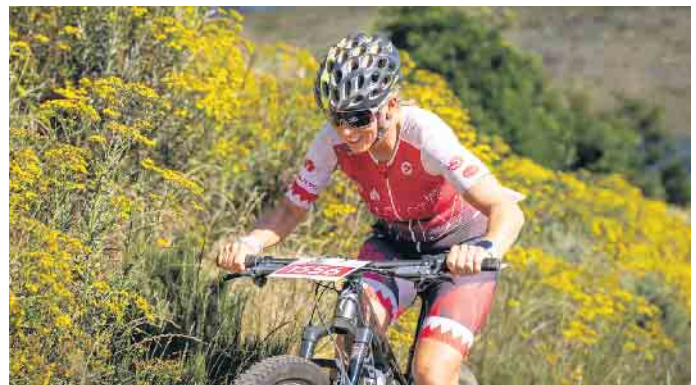
Steinberg dominiert mit dem Bike auf dem Trail

https://www.wvxtri.co.za/events/paul-cluver