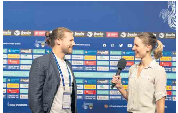
Reporter und Journalisten sind ganz nah dran an den wichtigen Leuten des Sportbusiness. Hier ist die richtige Kommunikation ausschlaggebend.

Mit dem Abschluss qualifizieren sich Vereinsmitarbeiter, Pressesprecher, Leistungssportler, Funktionäre und Mitarbeiter der Unternehmenskommunikation für anspruchsvolle Aufgaben in der internen und externen Sportkommunikation. Das Wissen vermitteln dabei Experten aus der