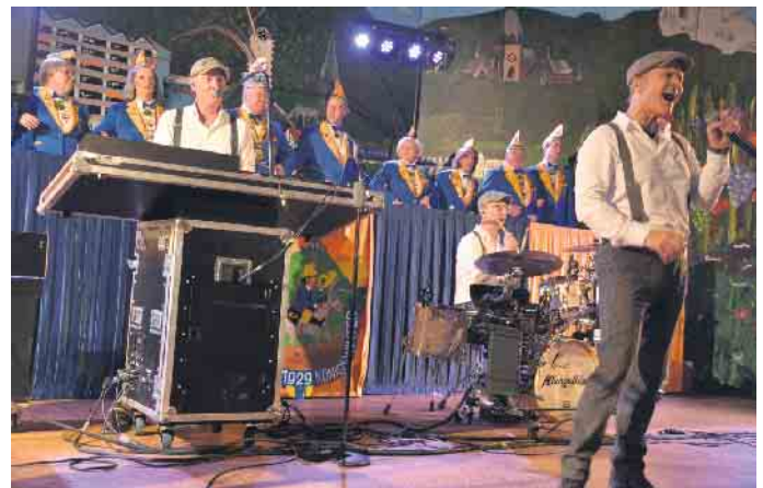
Zahlreiche Band, wie hier die Klüngelköpp, rockten die närrische Bühne

ben eine Ruf als herausragende Live-Band, stehen für druckvollen Sound und fühlen sich gleichermaßen bei eingängigen Ohrwürmern, Texten mit Tiefgang, Wortwitz und Ironie zuhause. Mit den Domstürmern konnte die Postalia einen Schlusspunkt unter eine kunterbunte und wieder einmal tol-