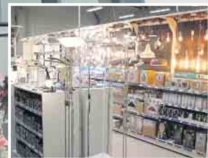
Abb. sind Beispiele! Produkte in Ausstellungen und Lager können abweichen!

KLEIN BAUSTOFFE Baumarkt Brennstoffe FUTTERMARKT