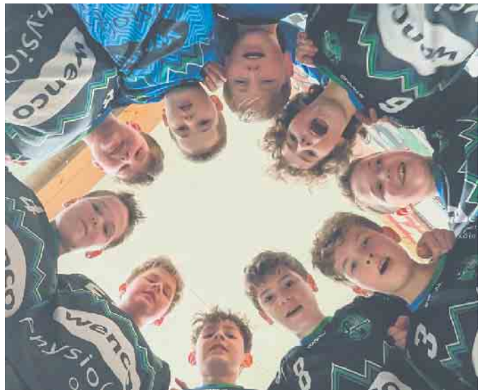
Der HSG-Nachwuchs schließt die Hinrunde auf dem 2. Platz der Liga ab.

zen. In der Pause „rappelte“ es etwas in der Kabine und die HSG-Kids kamen wach zurück vom Pausentee bzw. der extra Portion „süße Motivation“ in Form von Gummibärchen. Zudem wollte die Mannschaft nach einer demokratischer Abstimmung auf eine offensive 1:5-Deckung umstellen. Beides zeigte direkt Wirkung und die Siebengebirgler zogen mit einem Sechs-zu-Eins Lauf direkt davon. Davon konnte sich der TVP nicht mehr erholen und so hieß es am Ende einer intensiven Partie - mit einigen Zwei-Minuten-Strafen auf beiden Seiten - verdient nach einer 14:10-Führung zur Halbzeit, 33:17 für den HSG-Nachwuchs, der die Hinrunde mit 10:2 Punkten und dem besten Angriff der Liga auf Platz 2 abschließt.