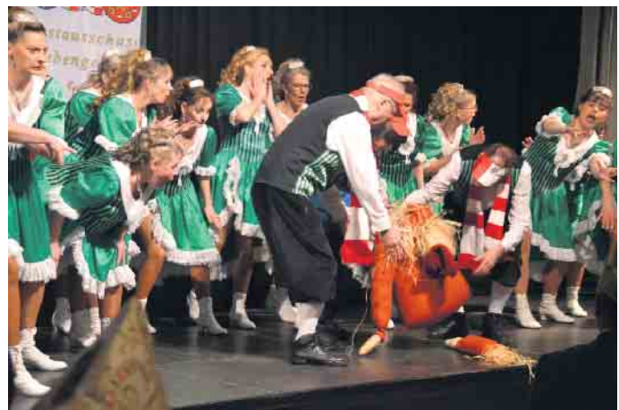
Mit ihrem musikalischen Sketch rund um den Nubbel begeisterten die Poppelsdorfer Schloßmadämche und Schloßjunfern