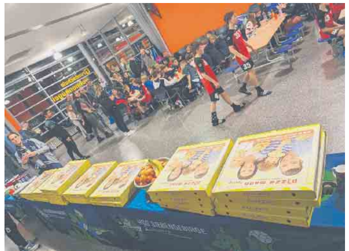
Das Runde muss ins Eckige: nach sehr vielen Torwürfen war es am Samstagabend Zeit für Pizza und Obst beim gemeinsamen Abendessen

Programm. Bei einem gemeinsamen Kinoabend im Foyer der „Sunshine Arena“ ließen die jungen Sportlerinnen und Sportler aus den Niederlanden und dem Siebengebirge den ersten Turniertag ausklingen. Am Sonntagmorgen ging es nach dem gemeinsamen Frühstück im Foyer mit spannenden Spielen weiter. Das zweite Team aus Brabant konnte sich gegen die D2 der HSG mit 16:12 durchsetzen. Im HSG-internen Duell der D2 gegen die D3 gab es ein leistungsgerechtes 14:14 Unentschieden. Und schließlich setzte sich das dritte Team der Grün-Blauen gegen Brabant 2 mit 21:16 durch. Im Finale der beiden stärksten Mannschaften des Wochenendes gelang der