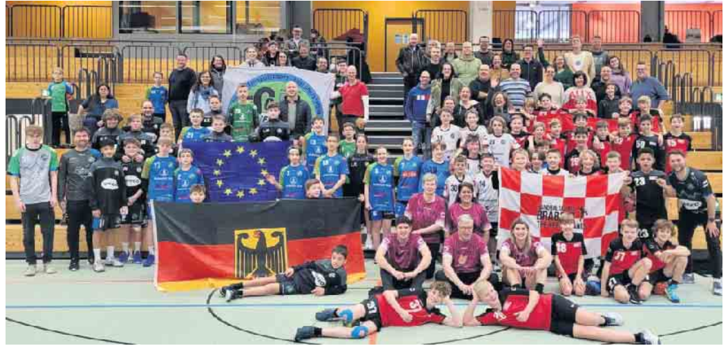
Handball verbindet: Spielerinnen und Spieler sowie Trainer-Teams und Eltern der HSG Siebengebirge und der Handbalschule Brabant beim Wiedersehen in Oberpleis.