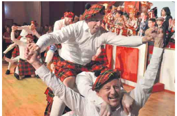
Ein toller Schluss-Act - die Männertanzgruppe aus dem Oberhau fetzte über die närrische Bühne