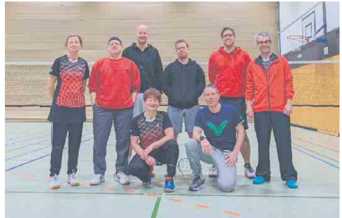
SVR-Spieler gegen SVR Vettelschoß

Nach dem ersten Saisonsieg in der Vorwoche gegen den BC