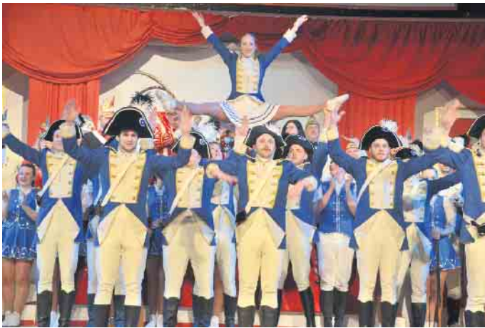
Auch die Narrenzunft der Kolpingfamilie aus Plees war zu Gast in Jillienberg

KG Klääv Botz feierten mit vielen befreundeten Gesellschaften in Jillienberg