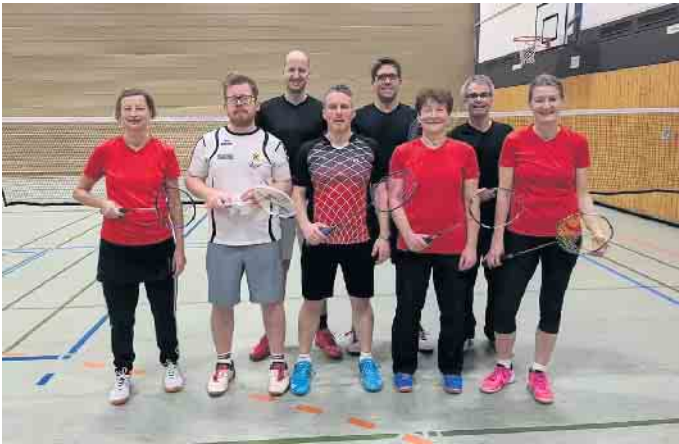
SVR-Spieler gegen BC Neuwied

Die beiden ersten Saisonspiele werden gewonnen