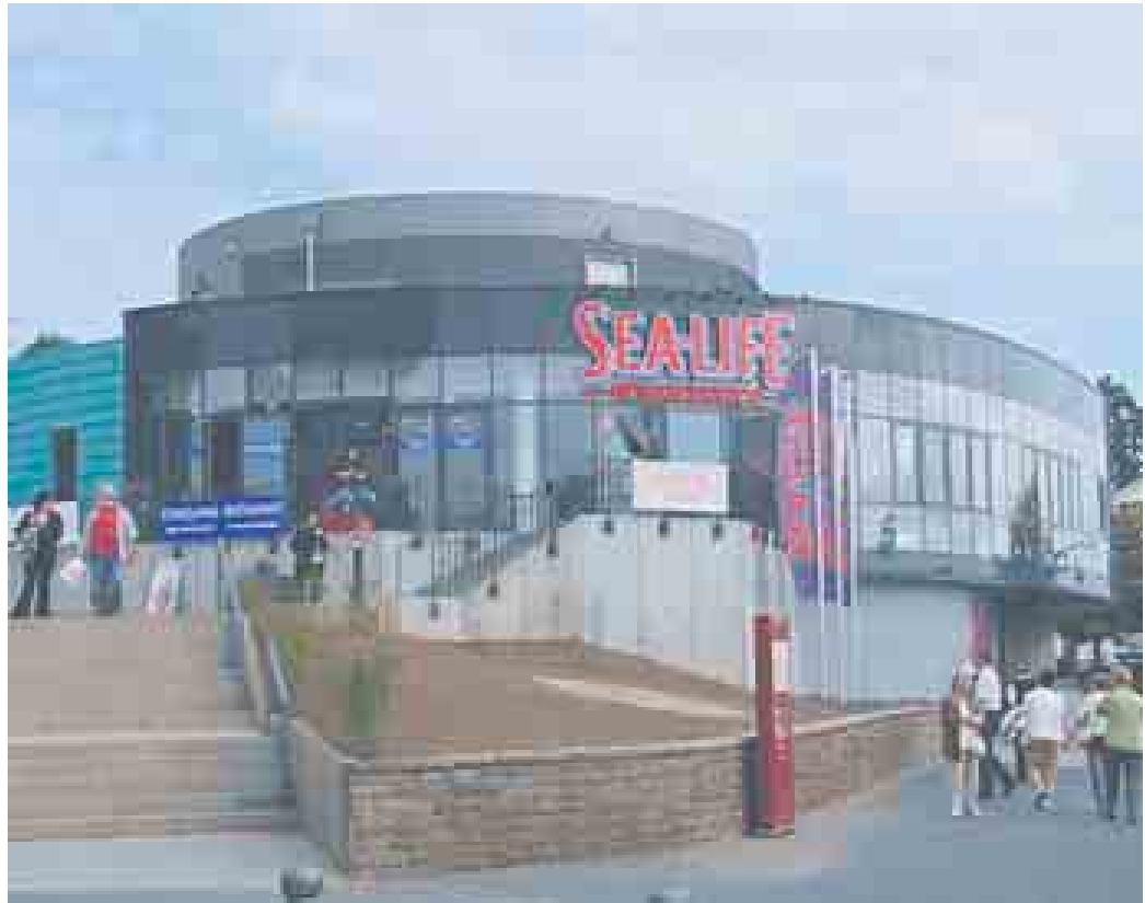
Die zukünftige Nutzung des Sea Life Komplexes in Königswinter steht momentan in der Diskussion

Investor dieses Jahr saniert und umgebaut werden soll. Damit ließen sich an dem Standort sicherlich hohe Besucherzahlen erreichen.“ Auch weitere Projekte in Deutschland, wie die Arena Sinsheim, das Klimahaus Bremerhaven oder das Konzeptpapier „International Crisis Center Ahr“, dass an Lösungen für Katastrophen und Krisen arbeiten soll, stellen den Klimawandel und den damit verbundenen Klimaschutz in den Fokus. „Wir werden die Nutzungsmöglichkeiten des ehemaligen Sea Life Geländes im Rahmen unseres Bürgerbeteiligungsprozesses begleiten“, so Bürgermeister Lutz Wagner, „Dieser jetzt hier vorliegende Beitrag wird in die Beratungen von Politik und Verwaltung eingehen. Wir möchten den Bürgerinnen und Bürger darüber hinaus die Möglichkeit eröffnen weitere Vorschläge zu machen und sich intensiv an den Überlegungen im Rahmen einer Folgenutzung des Geländes in Rhein- nabe zu beteiligen.“