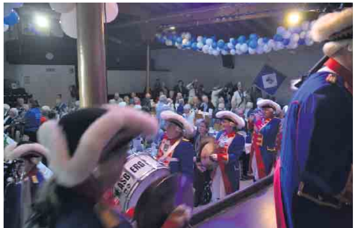
Mi dem Einmarsch des Tambourcorps Siebengebirge begann das Fest für die älteren Mitbürger*innen

Menschen eingeladen, die das Alter von 70 Lebensjahren bereits erreicht hatten. Ein buntes karnevalistisch geprägtes Programm erwartete die Gäste. Das Interesse, gemeinsam einige gesellige Stunden miteinander zu verbringen war groß und so füllten sich die Stuhlreihen im Franz-Unterstell-Saal schnell.