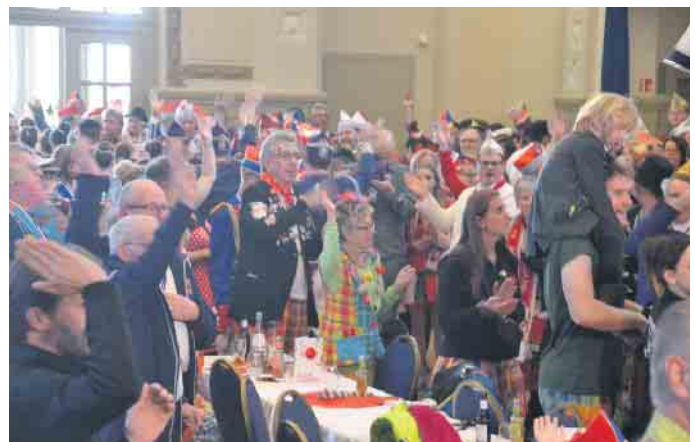
Zahlreiche Karnevalisten hatten den Weg in den Kursaal gefunden