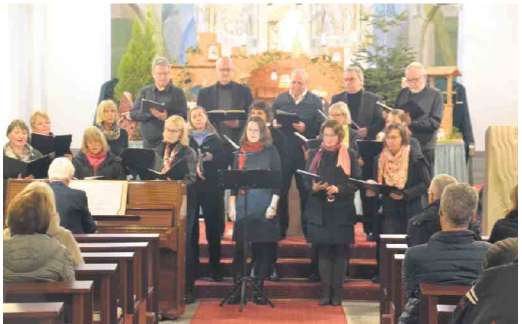
Der Chor Cantiamo begleitete den „Abschied von der Krippe“ mit einem Konzert