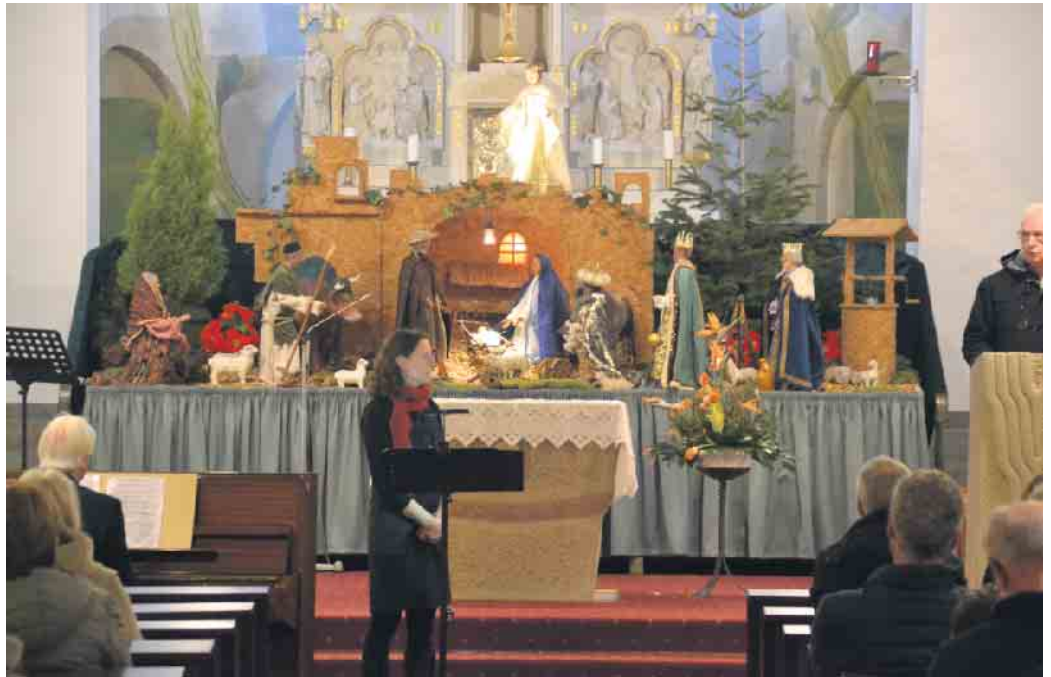
Die Krippe in Eudenbach dominierte in der Weihnachtszeit den Chorraum der Kirche, nun sagte man ihr adè