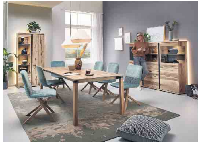
Zeitlos schöne Qualitätsmöbel bereiten ihren Besitzern lange Freude.

Es kommt vor, dass man sich an seiner Einrichtung „satt gesehen“ hat und „frischen Wind“ in die Wohnung holen möchte. Neue Möbel müssen dann nicht knallbunt oder anderweitig besonders auffällig sein, um Akzente zu setzen. Wichtig ist, dass die Einrichtung insgesamt harmonisiert und zum eigenen Typ passt. Entscheidungen für grelle Farben sollten wohl überlegt sein, da diese oft weniger zeitlos sind als beispielsweise natürliche Farben und Oberflächen. Auch für das Kinderzimmer gibt es Möbel, die zeitlos