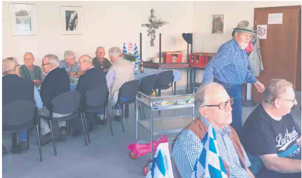
Manchmal gibt es auch etwas zu feiern.