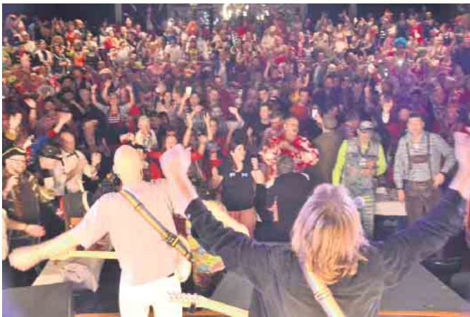
Eine tolle Stimmung bei der Kostümsitzung der „Großen Königswinterer“

GKKG startete mit der großen Kostümsitzung in die Karnevalssession