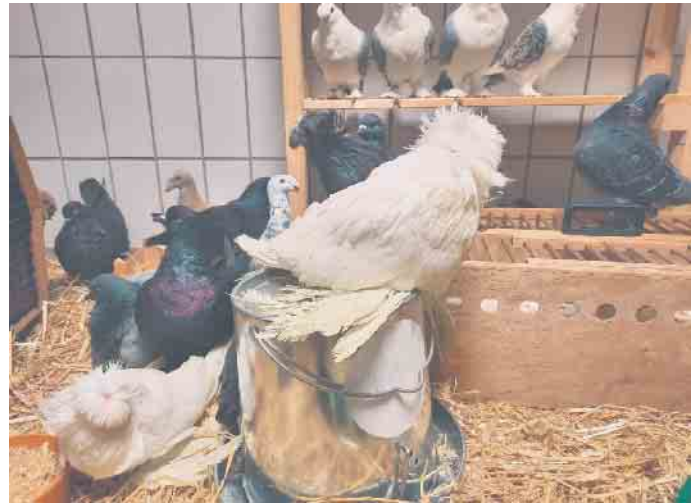
40 Tauben fanden beim Tierschutz Siebengebirge ein Übergangszuhause