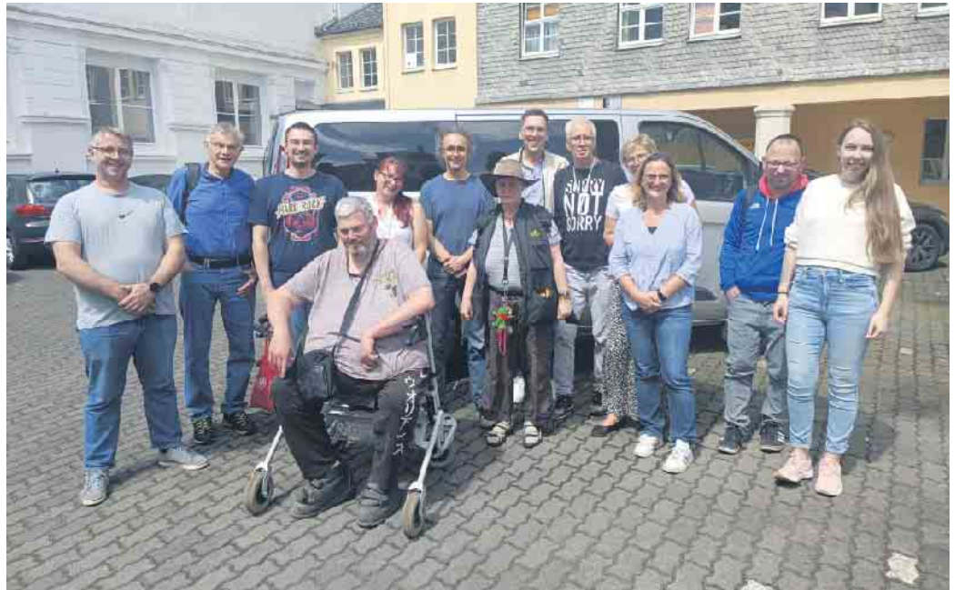
Das neue Shuttle-Projekt nach Hohenhonnet ist gestartet und wirbt um ehrenamtliche Unterstützer.

Das Shuttle ist zunächst nur freitags von 15 bis 17 Uhr im Einsatz. Es fährt flexibel, in Absprache mit den Fahrgästen,