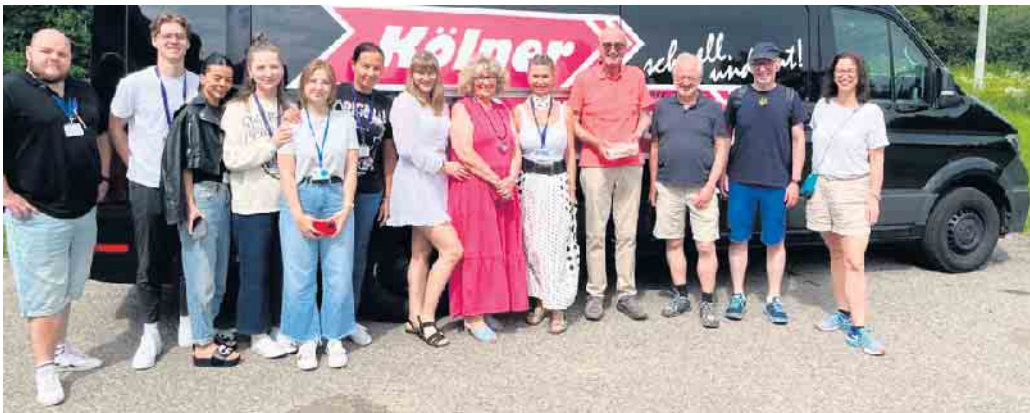
Mitarbeiter des Blue Dot in Michalovce, an der Grenze zur Ukraine; rechts im Bild das vierköpfige Team der HelpForceHonnef

Nach störungsfreier Fahrt in die Slowakei, wurden die Spenden für die Caritas Ukraine und für das Krankenhaus in Uzhorrod. bei der Caritas Slowakei in Secovce, dem wichtigsten Partner der HFH abgeliefert. Die Freude über die wertvolle Fracht war riesig; und vor allem Verbandsmaterial und Lebensmittel wurden dankbar angenommen und zunächst zwischengelagert. Die für das Krankenhaus bestimmten Spenden werden vom Krankenhaus in den nächsten Tagen abgeholt und über die Grenze gebracht. Dank Fortsetzung auf S. 6