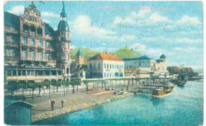
Eine Ansichtskarte aus dem Siebengebirgsmuseum zeigt Königswinter in früheren Jahren