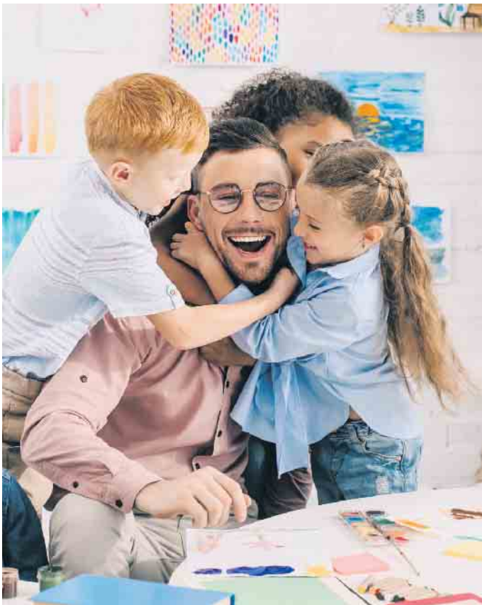
Erfüllend, aber auch herausfordernd: Wer Kinder liebt und die Erzieher in den Kitas entlasten möchte, könnte über eine Weiterbildung als Kita-Assistent nachdenken.