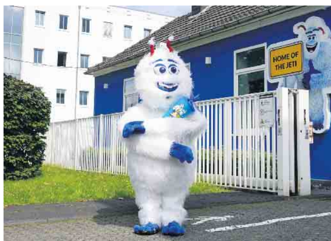
Auch der JETI freut sich auf seine Einschulung.