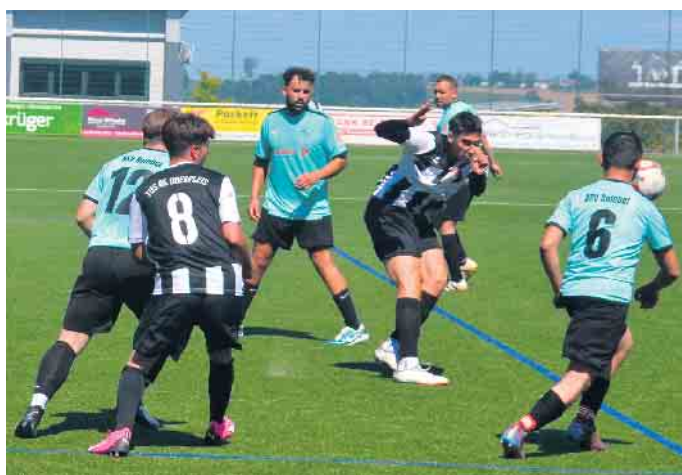
Roleber dominierte das Spiel gegen die Herren III des TuS 05 Oberpleis