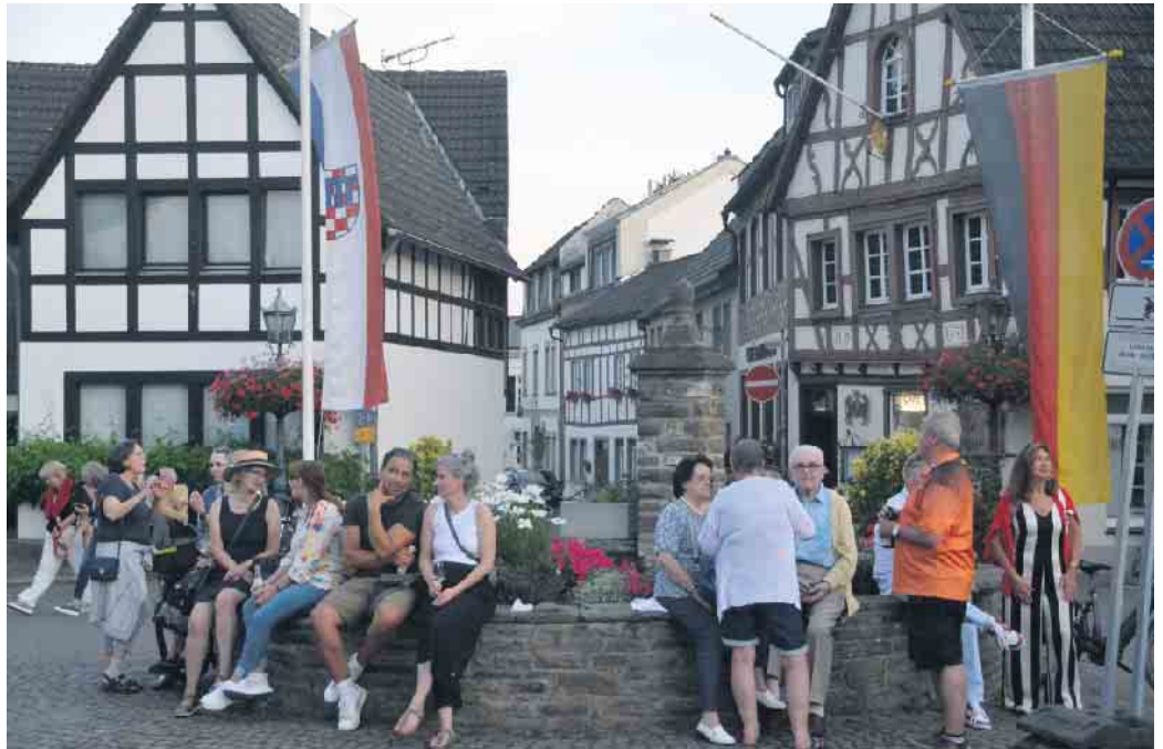
Das idyllische Herz von Rhöndorf, der Ziepchens-Platz, lädt stets zum Verweilen und Genießen ein