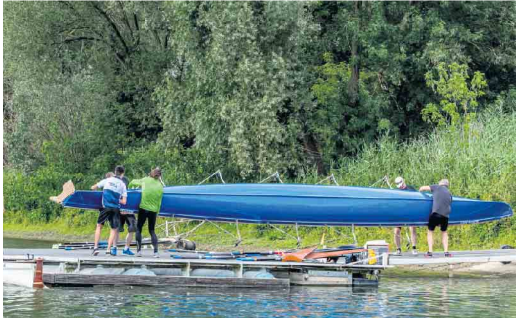
Das richtige Tragen von Booten und Skulls gehört vom ersten Ausbildungstag an dazu

Der geschützte Tote Rheinarm des WSVH bietet dazu die idealen Voraussetzungen.