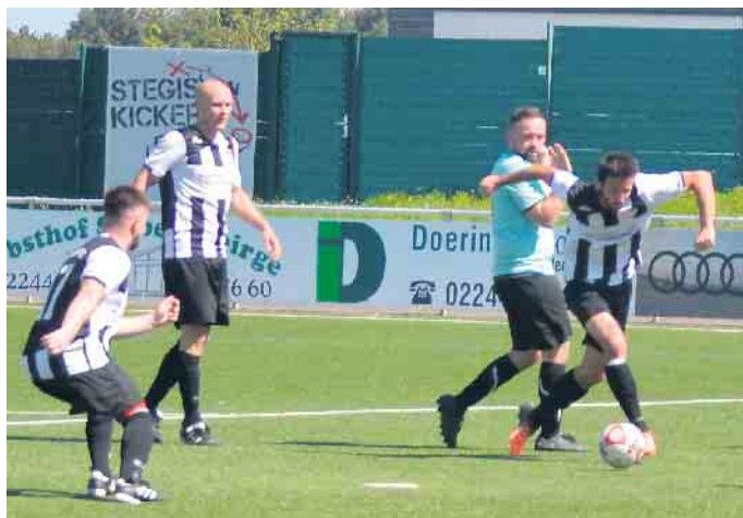
Wenn der TuS 05 einmal in den gegnerischen Strafraum vordringen konnte mangelte es oftmals an dem erfolgreichen Abschluss