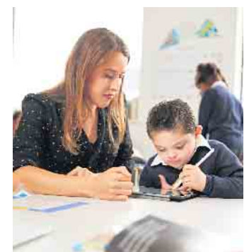
Schulbegleiterinnen unterstützen Kinder mit psychischen Störungen und geistigen oder körperlichen Behinderungen, die an einer Regelschule unterrichtet werden, langfristig und individuell.

Dass Bildung nicht teuer sein muss, beweisen die vielen Fördermöglichkeiten: Arbeitssuchende können sich ihre berufliche Weiterbildung mit einem Bildungsgutschein finanzieren lassen, Träger wie die Agentur für Arbeit übernehmen dann die anfallenden Kosten der Kurse. Berufstätige und Arbeitgeber werden zum Beispiel durch das Qualifizierungschancengesetz gefördert. Unter www.ibb.com sind weitere Informationen zum Kursangebot sowie zu Fördermöglichkeiten zu finden. (DJD)