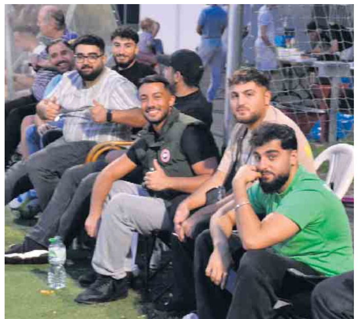
Die Fans des Gastgebers konnten mit Leistung ihrer Mannschaft zufrieden sein, auch wenn am Ende der Sieg ausblieb