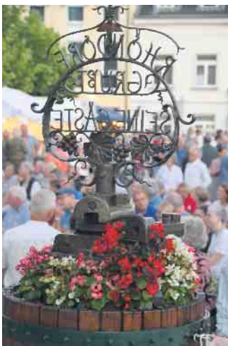
Ein Geheimtipp für wahren musikalischen Genuss - die Kulturserie „Musik im Pavillon“

ieren. Beide wurden bei ihrem Auftritt in Rhöndorf durch Stefan Berger am Kontrabass begleitet.