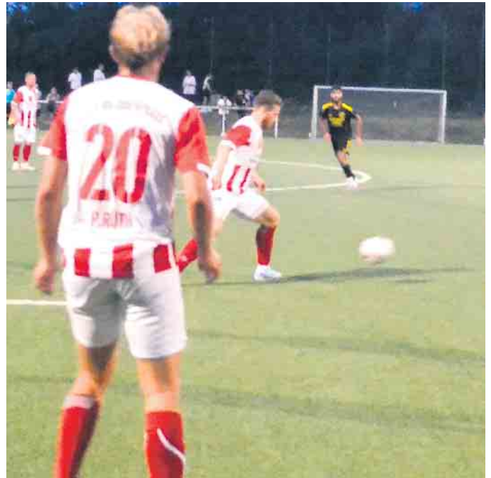
Die Troisdorfer machten dem TuS 05 Oberpleis den Sieg nicht leicht