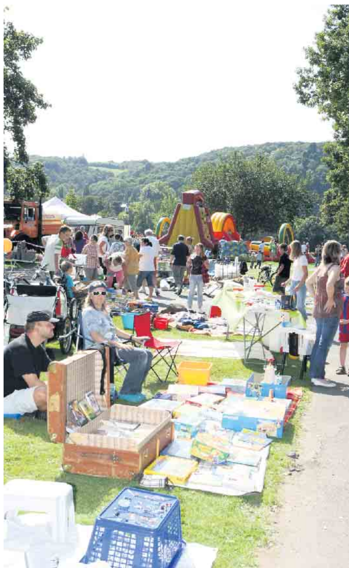
Der Kinderflohmarkt bei R(h)einspaziert ist sehr beliebt