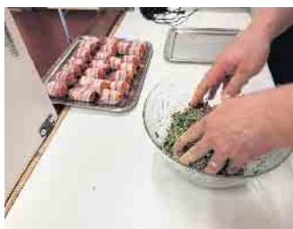
Liebevoll zubereiten.

Der Sommergrillabend des Oberpleiser Angebotes „Gemeinsam