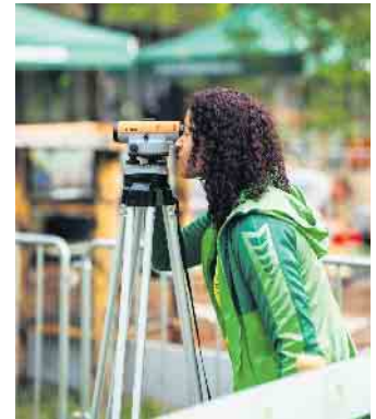
Für die exakte Vermessung werden hochmoderne Laser eingesetzt.

Garten- und Landschaftsbau. Statt Strohhut und Schürze sind hier verschiedenste Baumaschinen und Werkzeuge gefragt, technisches Verständnis und intensive Teamarbeit. Rund 3.000 junge Frauen und Männer starten jedes Jahr in Deutschland eine Ausbildung im