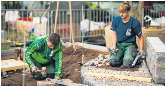
Bei der kunstvollen Verlegung von Pflastersteinen für Wege oder kleinere Plätze ist Teamarbeit und Handwerkskunst gefragt.

vor allem zur Visualisierung für die Kundinnen und Kunden ist spezielle Software, Virtual Reality und 3D-Modellierung im Einsatz. Bei der Pflasterung von größeren Flächen werden Maschinen genutzt, die körperlich schwere Arbeiten erleichtern. Der GaLaBau arbeitet heute mit modernster Technik - sei es Künstliche Intelligenz bei der Kundenberatung und für die Planung, Flugroboter für die Vermessung, die mobile Datenerfassung auf der Baustelle oder auch das Online-Berichtsnetz für Auszubildende.