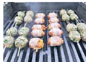
Gemeinsam grillen auf der Terrasse.

Wer gerne dabei sein möchte, eine Teilnahmebeschränkung gibt es für diesen letzten Sommerkoch-