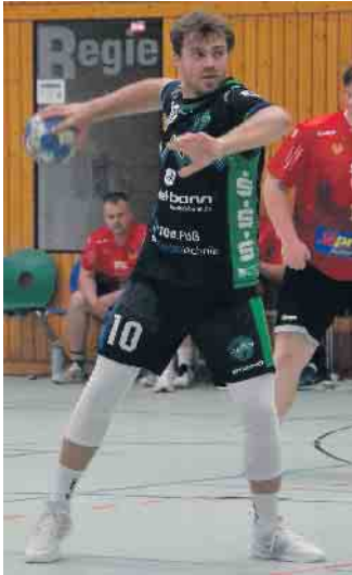
Bereits im Auftaktspiel holten die Siebengebirgler beide Punkte

Reserve der HSG Siebengebirge triumphiert im Derby bei der HSG Geislar-Oberkassel