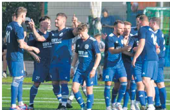
Gleich siebennal konnten sich die Sportfreunde über ein Tor freuen