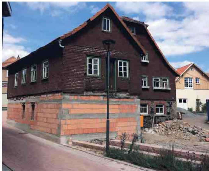
Bevor die Maler kamen, war die Mühle in einem traurigen Zustand.

werden. Immerhin gelang es, das Originalfachwerk, Bemalungen und Teile des alten Holzfußbodens zu retten. Die alten Putzstrukturen der Mühle sollten übernommen werden, und da war es ein Glück, dass ein älterer Geselle der ausführenden Firma diese