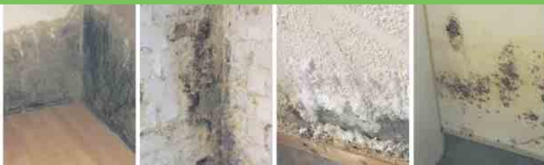
Defekte Horizontalsperre Querdurchfeuchtung Ausblühungen Schimmelbefall