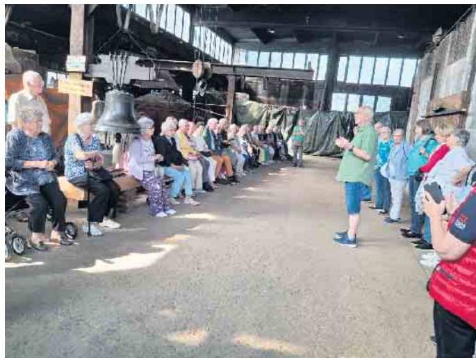
Besuch in der Eifeler Glockengießerei

Dort folgte dann eine einstündige Moselrundfahrt mit der MS Moselprinzessin. Die Mosel, mit ihren sanften Windungen und maleischen Ufern bietet ein wahres Paradies für Wasserspaß und Abenteuer. Die Fahrt führte zunächst Mosel aufwärts vorbei am Hafen nach Andel, Lieser, Mülheim und wieder zurück nach Bernkastel. Nach der Schifffahrt hatte man die Möglichkeit in einem kleinen Spaziergang den Ort mit den prachtvoll verzierten Fachwerkhäusern kennenzulernen. Den