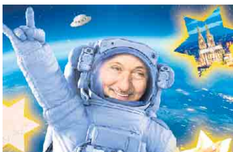
Den Kabarettisten Konrad Beikircher live erleben

(bk) Thomasberg. Wer sind eigentlich die Aliens - die Imis oder die Einheimischen? Im rätselhaftesten Universum ist vieles anders. Die Sprache, der Karneval, die Kirche, die Politik, die Wirtschaften, das Essen, die Krankenhäuser und so weiter. Beikircher erzählt und weiß, wovon er spricht. Sein neues Programm ist eine kleine Bilanz aus 57 Jahren Leben im rheinischen Universum.