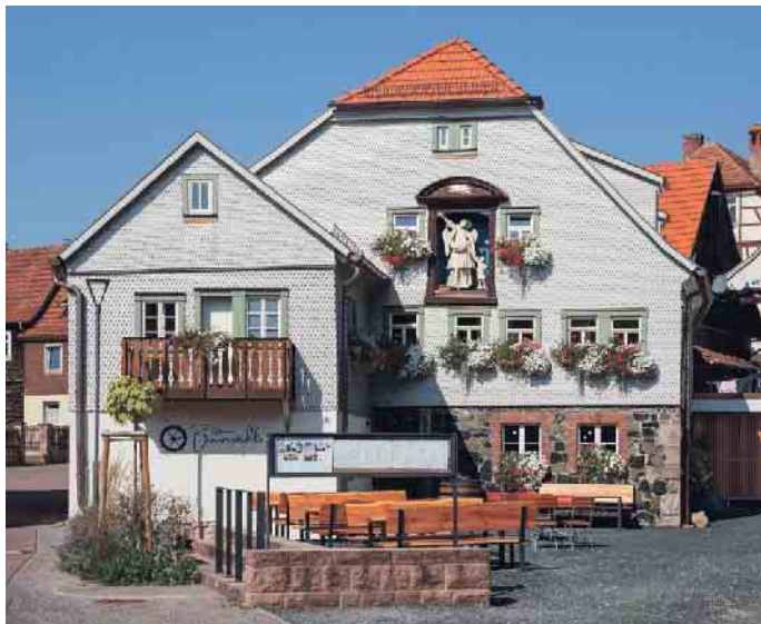
Wer die alte Mühle kannte, kommt aus dem Staunen nicht heraus.

Nicht sachgemäße Umbaumaßnahmen in der Vergangenheit und das undicht gewordene Dach hatten erhebliche Bauschäden am jahrhunderte alten Gebäude einer Müllerfamilie verursacht. Der Dachstuhl musste erneuert und das Gebäude komplett entkernt